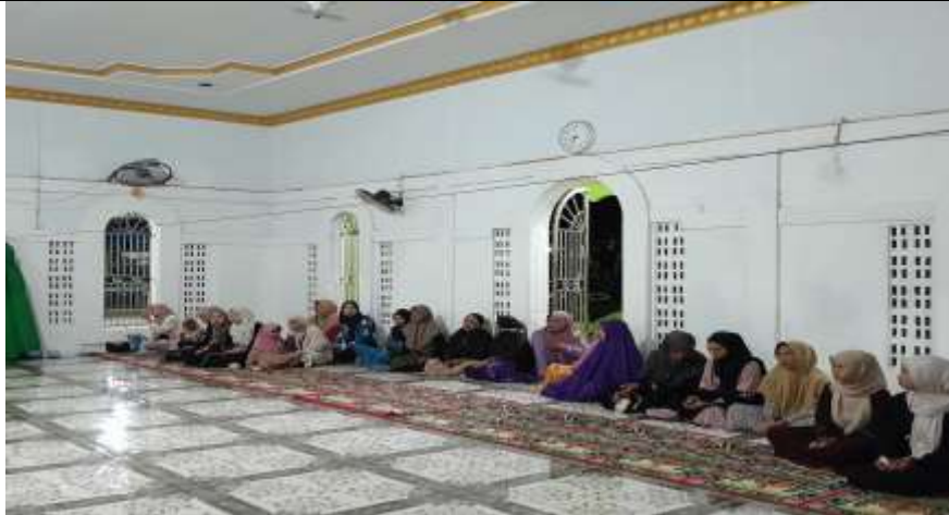
Gambar 4. Suasana Kajian Moderasi Beragama