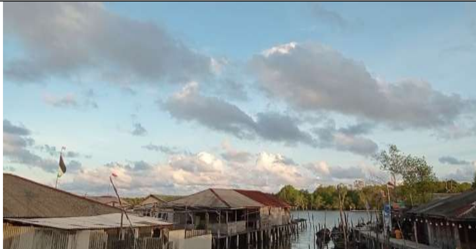
Gambar 1. Desa Kwala Besar