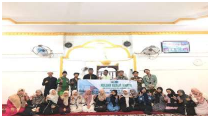
Gambar 5. Foto Bersama Ketua LPMD Desa Kwala Besar