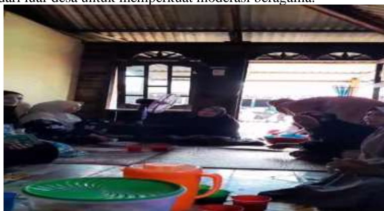
Gambar 2. Perwiritan Ibu-ibu Desa Kwala Besar

Selama menjalankan program kerja, kami mengamati bahwa masyarakat di Desa Kwala Besar aktif dalam kegiatan Keagamaan, seperti melaksanakan pengajian, wirid, dan apabila ada warga yang meninggal dunia maka masyarakat yang lain datang untuk melayat dan melaksanakan takziah. Ditinjau dari hal ini dapat dipahami bahwa masyarakat di daerah Desa Kwala Besar sudah memahami kewajiban dalam bermasyarakat menurut syariat Islam yang salah satunya adalah melaksanakan Fardhu Kifayah. Ibu-ibu di Desa Kwala Besar selalu melaksanakan wirid. Aktivitas ini dilakukan tiap hari jum'at siang yang bertempat di salah satu rumah warga. Selain itu juga setiap bulan dilaksanakan kajian di Masjid Baiturrahman dengan mengundang pemateri atau ustadz dari luar desa untuk memperkuat moderasi beragama.