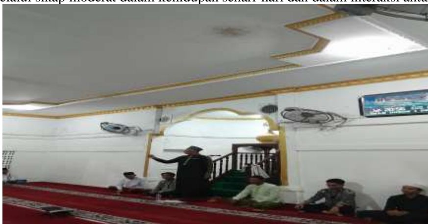
Gambar 3. Pemateri Kajian Moderasi Beragama