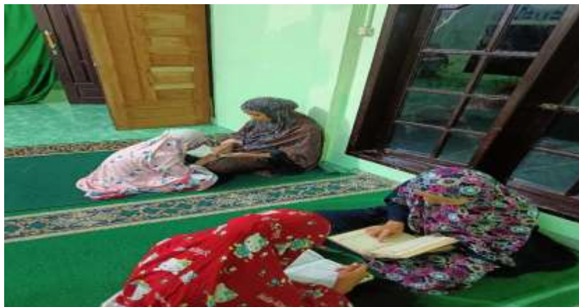
Gambar 7. Belajar Membaca Iqro dan Al-Qur'an