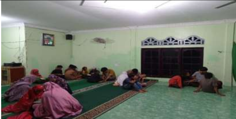
Gambar 6. Suasana Belajar Mengaji