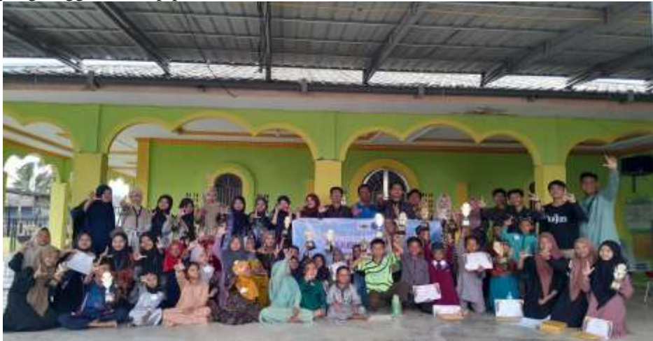
Gambar 8. Foto Bersama Peserta Lomba dan Pemenang Lomba Festival Anak Sholeh

Melalui kegiatan Festival Anak Sholeh yang dilaksanakan di Masjid Baiturrahman desa Kwala Besar, diharapkan mampu memberikan motivasi untuk menjadi lebih baik dan menanam rasa cinta anak terhadap Al-Qur'an. Mahasiswa juga berharap anak-anak desa Kwala Besar dapat membangun insan yang berakhlak mulia dan bertalenta serta menjadi pemimpin generasi islami yang berakhlakul karimah dan memiliki semangat juang yang tinggi terhadap peradaban Islam.