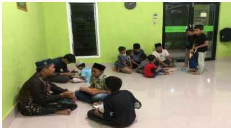
Gambar 8. Les Mengajar Ngaji

Mahasiswa KKN juga ikut serta dalam kegiatan perwiridan ibu-ibu dan membawakan kultum beserta tahtim dan tahlil. Tujuan dari kegiatan ini untuk memberikan motivasi kepada ibu-ibu agar selalu untuk menyebarkan pesan-pesan agama Islam, mempromosikan nilai-nilai moral, dan menginspirasi pendengarnya dengan pesan-pesan positif.