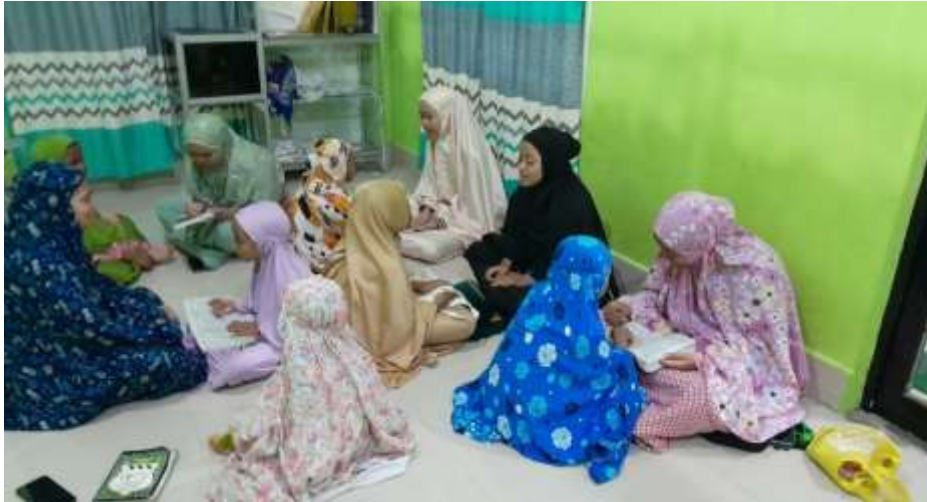
Gambar 7. Mengajar Ngaji

Salah satu kegiatan yang dijalankan yaitu mengajari mengaji yang diadakan pada malam hari mulai hari Minggu sampai hari Selasa yang bertempat di rumah salah satu warga. Anak – anak Desa Perkebunan Dolok sangat senang dengan kegiatan ini karena mereka bisa lebih lancar dan fasih dalam membaca Al– Qur’an serta mengenal huruf hijaiyah. Anak-anak yang datang dari berbagai usia baik laki-laki dan perempuan seperti dilihat pada gambar dibawah: