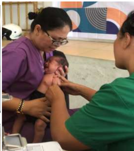
Gambar 14. Pencegahan dan Penanganan Stunting