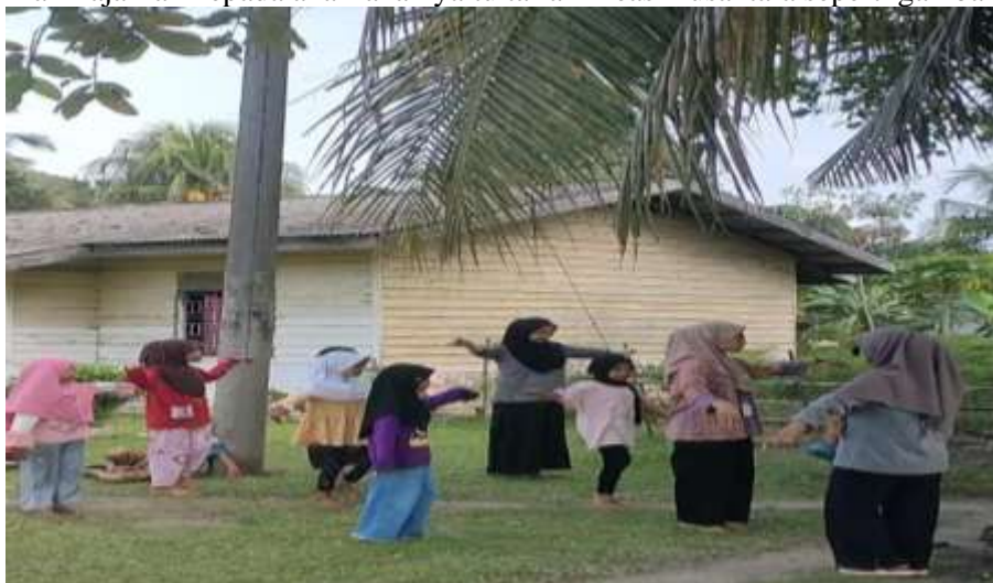
Gambar 6. Les Nari

Di minggu kedua dan seterusnya Anak mulai terlihat aktif dan kritis dalam bertanya dan menanggapi kegiatan pembelajaran yang mungkin anak-anak sudah mulai bisa menyesuaikan dengan kami. Kami pun mengadakan les tari daerah dikarenakan kurangnya minat anak dan pengetahuan anak mengenai tarian-tarian daerah, dan kebanyakan anak lebih menyukai tarian-tarian nusantara. Adapun tari daerah yang kami perkenalkan dan kami ajarkan kepada anak-anak yaitu tarian kreasi nusantara seperti gambar 6.