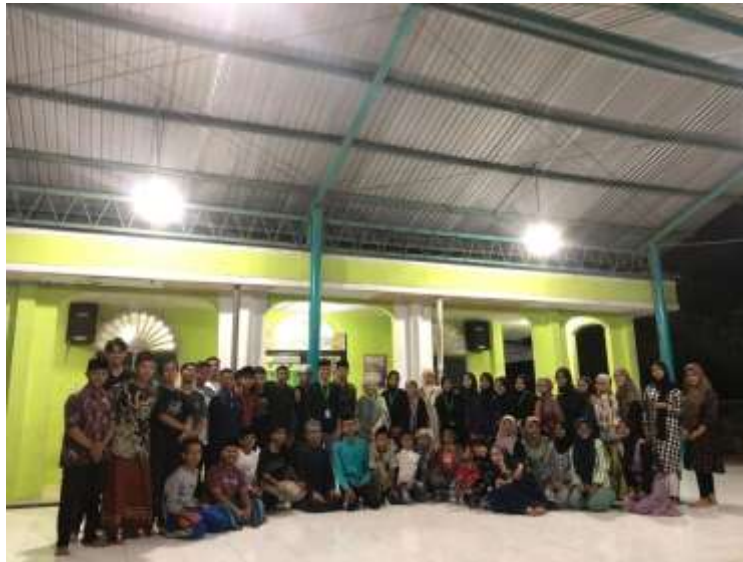
Gambar 11 : Pembentukan Remaja Masjid

Selanjutnya mahasiswa KKN ikut serta dalam pembentukan kembali Remaja masjid. Terbentuknya kembali remaja masjid sebagai wadah untuk mengembangkan potensi remaja-remaja dalam kegiatan keagamaan.