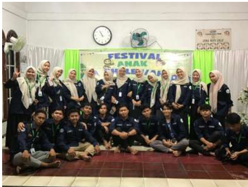
Gambar 12. Mahasiswa KKN 39 UINSU

Kemudian mahasiswa KKN mengadakan kegiatan peringatan 1 muharram dan festival anak sholeh yang dilaksanakan pada 11 agustus 2024. Kegiatan ini dilaksanakan untuk mengasah kemampuan anak-anak di desa perkebunan dolok.