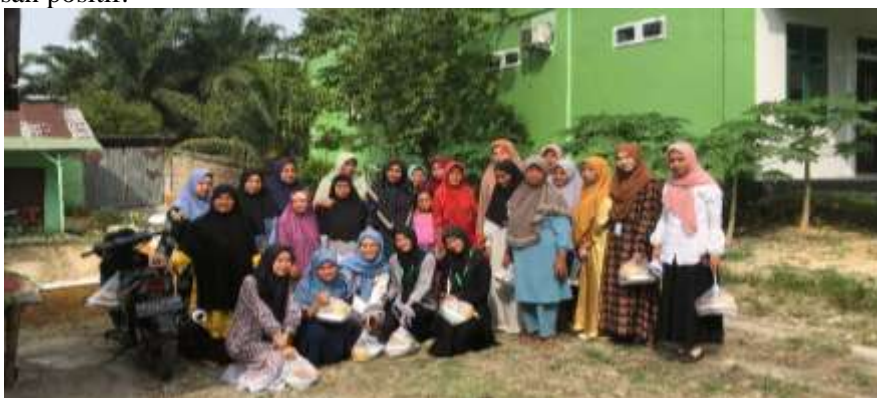
Gambar 9 : Perwirit-an Ibu-ibu

Mahasiswa KKN juga ikut serta dalam kegiatan perwiridan ibu-ibu dan membawakan kultum beserta tahtim dan tahlil. Tujuan dari kegiatan ini untuk memberikan motivasi kepada ibu-ibu agar selalu untuk menyebarkan pesan-pesan agama Islam, mempromosikan nilai-nilai moral, dan menginspirasi pendengarnya dengan pesan-pesan positif.