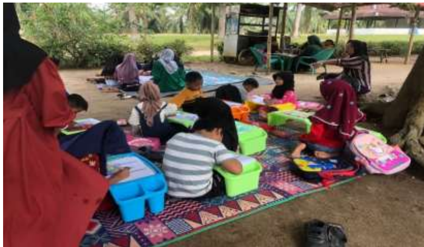
Gambar 3. Bimbel Mengajar Dusun 3

Kegiatan bimbel (bimbingan belajar) atau kegiatan pembelajaran tambahan yang diberikan kepada anak-anak di Desa Perkebunan Dolok dilakukan di TPI (Taman Pendidikan Islam) yang berada di dusun 1. Kegiatan bimbel ini guna untuk meningkatkan prestasi atau hasil belajar yang lebih optimal, membantu memahami dan menyerap pelajaran, memancing anak untuk lebih aktif dan pandai bersosialisasi, dan anak mendapatkan pergaulan positif. Materi yang diberikan berupa les bahasa Arab yang dilaksanakan pada hari Selasa dan les Bahasa Inggris dilaksanakan pada hari Kamis, les tari daerah dan juga mengadakan kegiatan bimbel di Dusun 3 Desa Perkebunan Dolok. Kegiatan bimbingan belajar ini bertujuan untuk meningkatkan hasil atau prestasi belajar, membantu dalam memahami dan menginternalisasi pelajaran, memotivasi anak untuk bersosialisasi lebih aktif dan giat, serta membantu mereka dalam mengembangkan hubungan yang sehat. Fakta bahwa anak-anak telah berkumpul untuk berpartisipasi dalam pembelajaran bahkan sebelum waktu kegiatan dimulai menunjukkan betapa bersemangatnya mereka untuk berpartisipasi dalam kegiatan pembelajaran lebih lanjut.