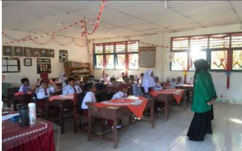
Gambar 2. UPT SDN 11 PERKEBUNAN DOLOK