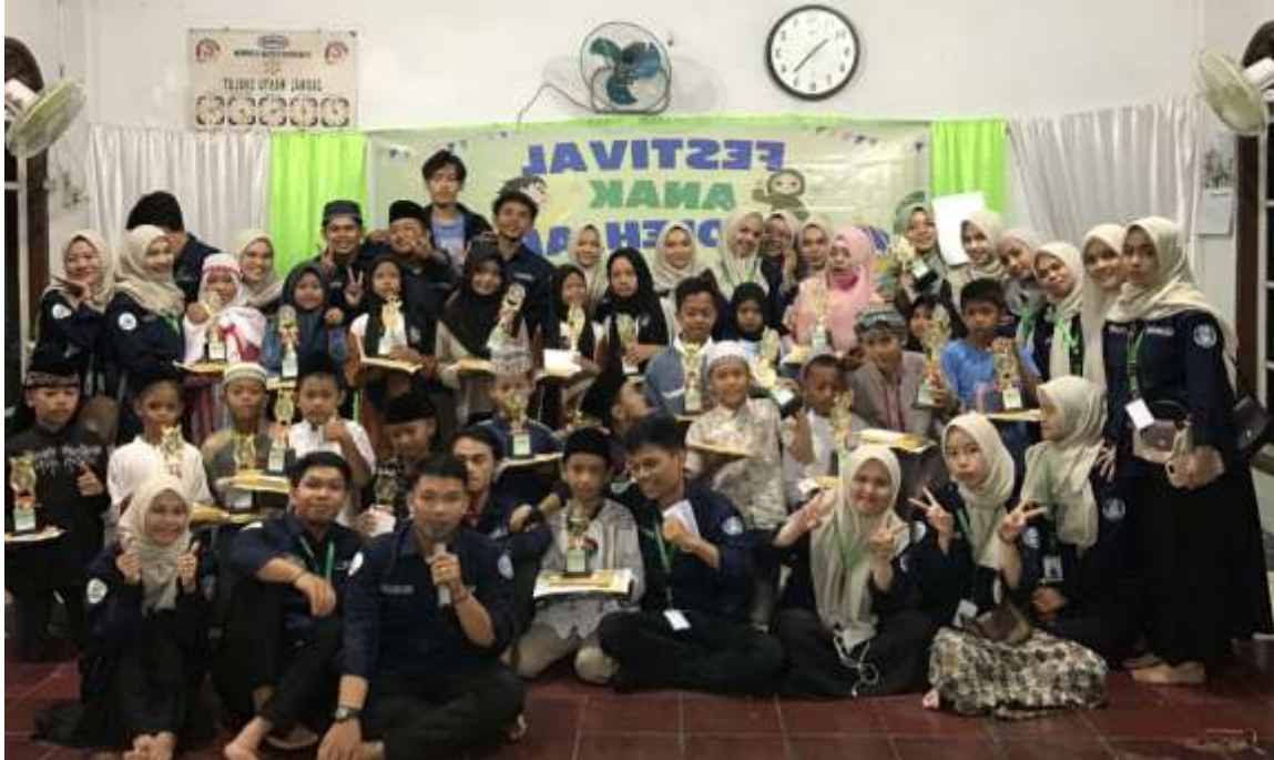
Gambar 13. Peringatan 1 Muharram dan Kegiatan Festival Anak Sholeh