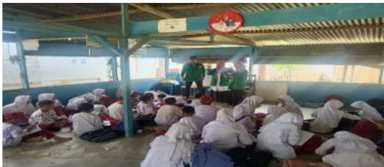
Gambar 1. UPT SDN 22 PERKEBUNAN DOLOK

Demi merealisasikan peran mahasiswa, kegiatan KKN mengajar merupakan kegiatan belajar mengajar dengan konsep belajar sambil bermain di UPT SDN 11 Perkebunan Dolok, kegiatan ini dilakukan mahasiswa KKN selama seminggu. Sebagai latihan pembelajaran, anak-anak di Desa Perkebunan Dolok diberikan pengarahan ekstra. Setelah kelas dimulai kembali, pembelajaran di sekolah berupa materi yang diberikan dan dilaksanakan pada hari Senin sampai Rabu. Tugas membantu ekstra ini membangkitkan rasa ingin tahu anak-anak. Mahasiswa KKN juga harus berada di UPT SDN 22 Perkebunan Dolok selama 30 hari untuk melaksanakan kegiatan bimbingan belajar tambahan (Bimbel). Dapat dilihat pada gambar 1 dan 2 sebagai berikut.