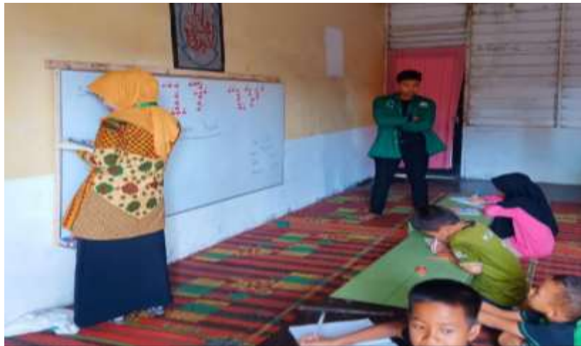
Gambar 5. Les Bahasa Arab

Di minggu kedua dan seterusnya Anak mulai terlihat aktif dan kritis dalam bertanya dan menanggapi kegiatan pembelajaran yang mungkin anak-anak sudah mulai bisa menyesuaikan dengan kami. Kami pun mengadakan les tari daerah dikarenakan kurangnya minat anak dan pengetahuan anak mengenai tarian-tarian daerah, dan kebanyakan anak lebih menyukai tarian-tarian nusantara. Adapun tari daerah yang kami perkenalkan dan kami ajarkan kepada anak-anak yaitu tarian kreasi nusantara seperti gambar 6.