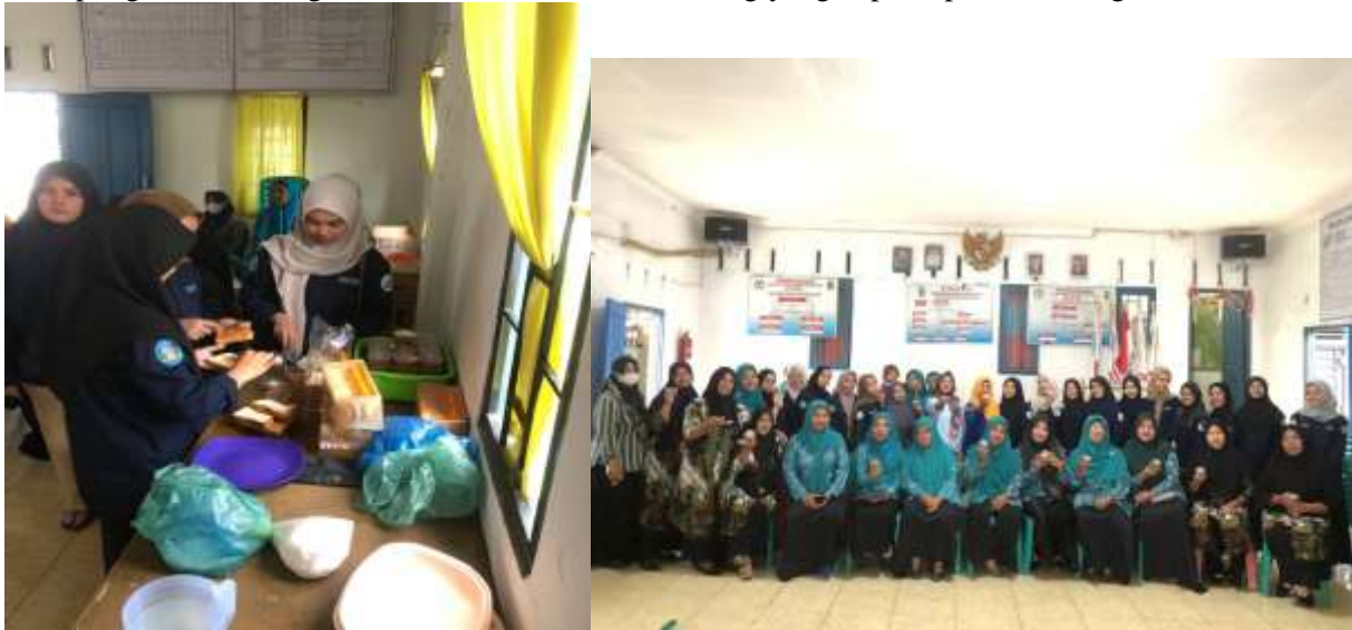
Gambar 15. Pembuatan Selai Belimbing

fasilitas yang sudah disediakan oleh pemerintahan desa berupa outlet yang terletak di pinggir jalan lintas sumatera, hal ini menjadi sebuah kesempatan untuk UMKM untuk meningkatkan daya jualnya karena mendapatkan tempat strategis. Selain UMKM yang berbasis di outlet tersebut terdapat juga beberapa UMKM hasil olah rumahan berupa pisang gosong, brownis, martabak. Mahasiswa KKN mengadakan kegiatan seminar workshop digital marketing dan demo masak selai belimbing yang dapat dipadukan dengan olahan martabak.