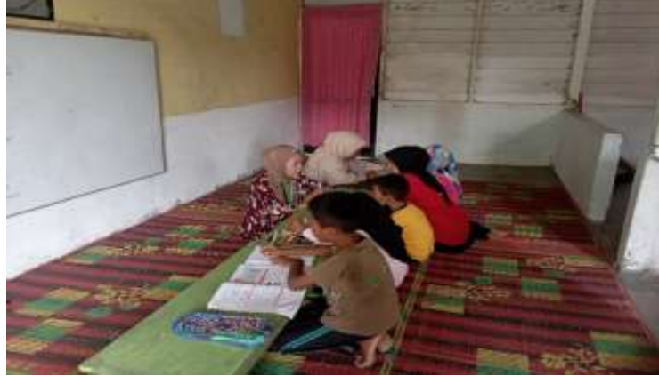
Gambar 4. Les Bahasa Inggris