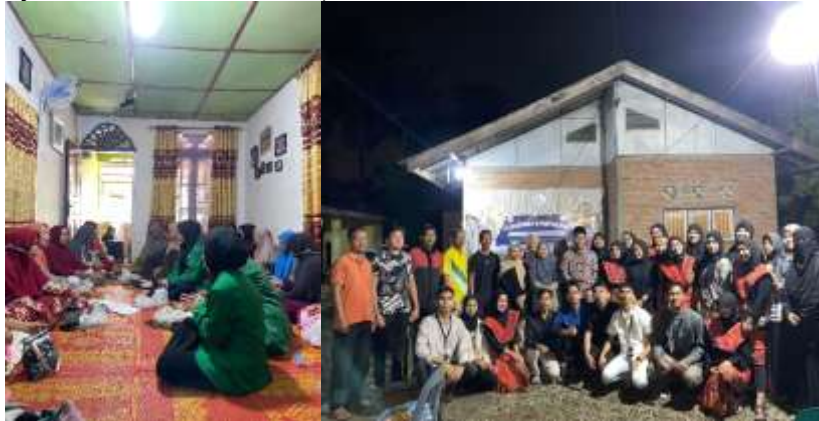
Gambar 1. Dokumentasi Penguatan Nilai-Nilai Moderasi Beragama Kepada Masyarakat oleh Mahasiswa Kelompok KKN 119 UINSU

kepercayaan yang berbeda turut berpartisipasi. Perayaan keagamaan, seperti perayaan hari besar Islam maupun kegiatan lainnya, dihadiri secara bersama-sama, menciptakan suasana kebersamaan dan saling menghormati antarwarga. Hal ini menunjukkan bahwa moderasi agama telah melekat dalam kehidupan masyarakat Desa Suka Makmur (Yusriyah & Khaerunnisa, 2024).