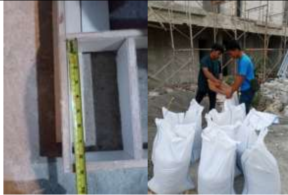
Gambar 3. Persiapan pelaksanaan