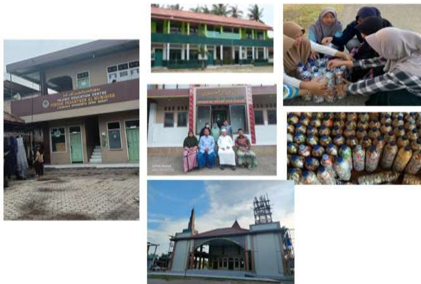
Gambar 1. Kondisi Mitra