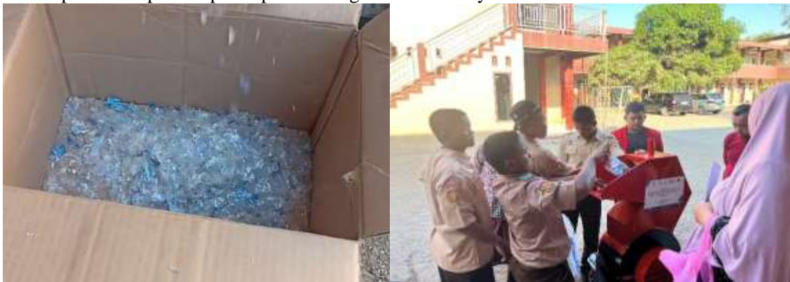
Gambar 4. Pencacahan sampah plastik