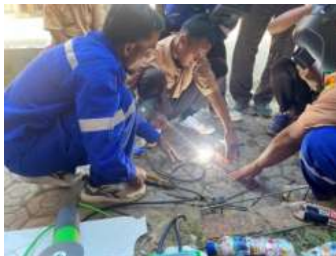
Gambar 9. Pelatihan Pengelasan untuk pembuatan kreasi ecobrick