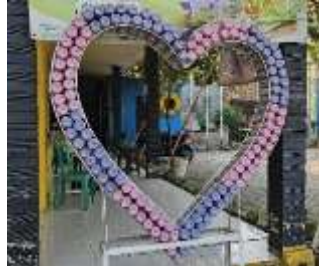
Gambar 10. Hasil kreasi ecobrick

Keterlibatan mitra dalam kegiatan ini sangat tinggi, dengan partisipasi aktif dari berbagai pihak, mulai dari santri hingga ustadz di Pesantren Modern Al Mu'minien. Sejak awal, baik santri maupun ustadz memperlihatkan semangat dan ketertarikan yang besar terhadap proses pembuatan kreasi ecobrick, yang memanfaatkan plastik daur ulang sebagai bahan baku. Mitra juga terlibat dalam pelatihan perhitungan harga pokok produksi dan pencatatan sederhana dalam akuntansi menggunakan Microsoft excel