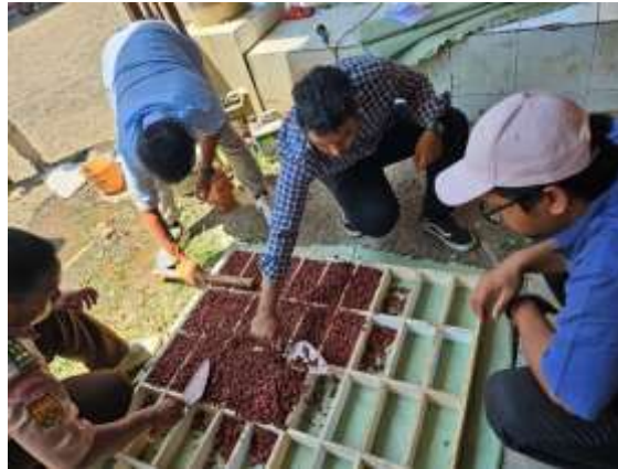
Gambar 6. Pencetakan paving blok dari cacahan sampah plastic

Partisipasi mitra dalam kegiatan ini sangat antusias dan melibatkan berbagai elemen, mulai dari santri hingga para ustadz di Pesantren Modern Al Mu'minien. Sejak awal, baik santri maupun ustadz menunjukkan minat yang besar dalam proses pembuatan paving block tembus air, yang menggunakan bahan baku dari plastik hasil daur ulang. Keterlibatan mereka bukan hanya sebagai peserta, tetapi juga sebagai penggerak utama dalam pelaksanaan program ini.