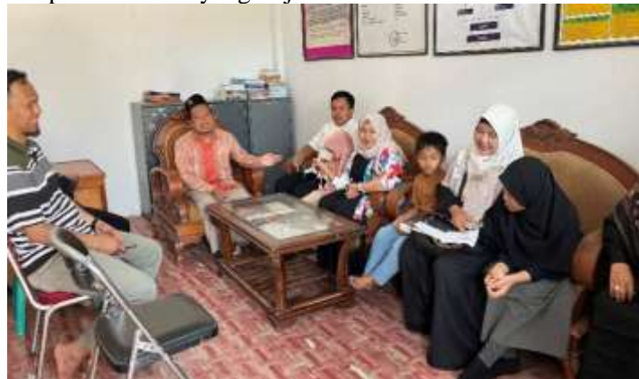
Gambar 2. Survei pelaksanaan