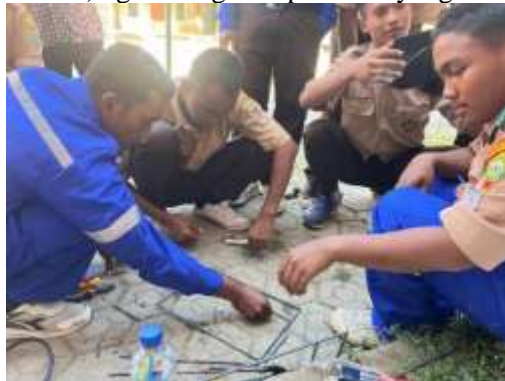
Gambar 8 Pelatihan pemotongan besi untuk pembuatan kreasi ecobrick