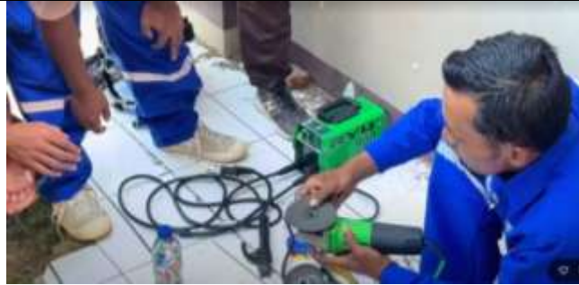
Gambar 7. Pengukuran dan pembuatan pola untuk pembuatan kreasi ecobrick