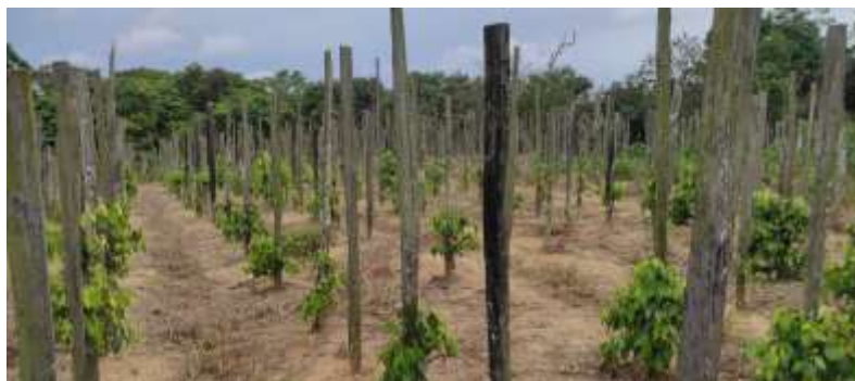
Gambar 2. Kondisi Kebun Lada Milik Petani

Selain itu, petani akan dibekali tentang informasi mengenai diversifikasi produk dari tanaman lada yang dapat memberikan nilai jual lebih tinggi daripada lada yang selama ini dijual dalam bentuk biji. Melalui kegiatan ini, diharapkan terbentuk rumah usaha produksi yang dikelola oleh para petani yang tergabung dalam anggota kelompok tani tersebut yang dapat mengolah hasil panen lada menjadi bubuk lada yang dikemas dan dipasarkan sehingga dapat meningkatkan pendapatan ekonomi petani.