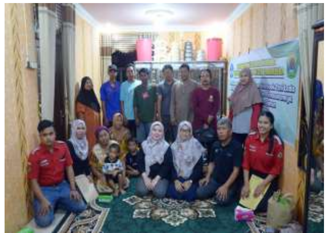
Gambar 4. Foto Bersama dengan Peserta Pengabdian