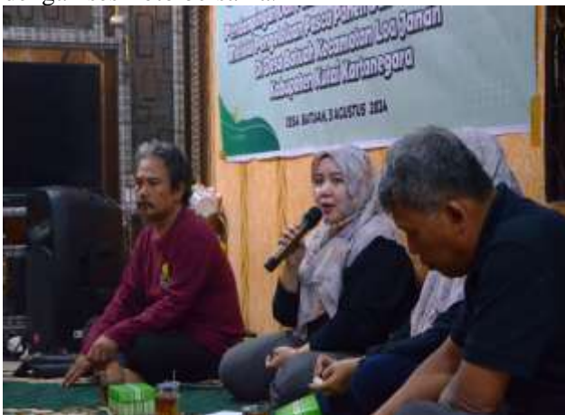
Gambar 3. Penyerahan Materi

Kegiatan ini diakhiri dengan penyerahan secara simbolis alat pengabdian kepada Ketua Poktan diikuti dengan sesi foto bersama.