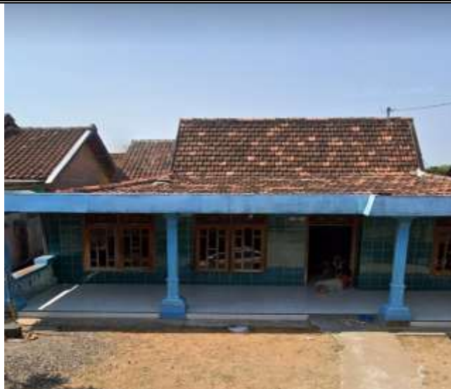
Gambar 1. Lokasi UMKM “RAIDA COLLECTION” belum memiliki identitas usaha