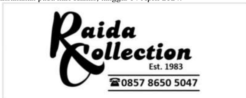
Gambar 3. Logo UMKM “RAIDA COLLECTION”