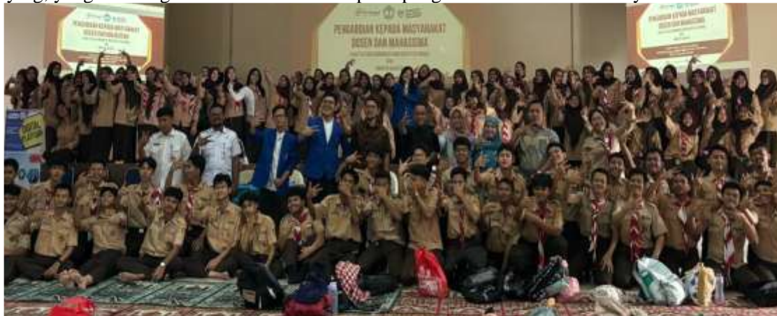
Gambar 3. Sesi Pelatihan

Setelah itu, peserta diberikan kesempatan untuk berlatih keterampilan melalui latihan praktik langsung dan role-playing, yang memungkinkan mereka menerapkan pengetahuan dalam situasi nyata.