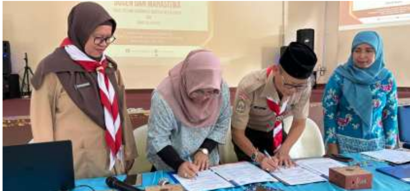
Gambar 2. Observasi langsung dan penandatanganan kerja sama dengan SMAN 8 Jakarta

yang tepat sasaran, menyesuaikan materi dan metode pelatihan, serta memastikan bahwa program dapat memberikan solusi yang sesuai dengan kebutuhan sekolah dan siswa, baik untuk jangka pendek maupun jangka panjang.