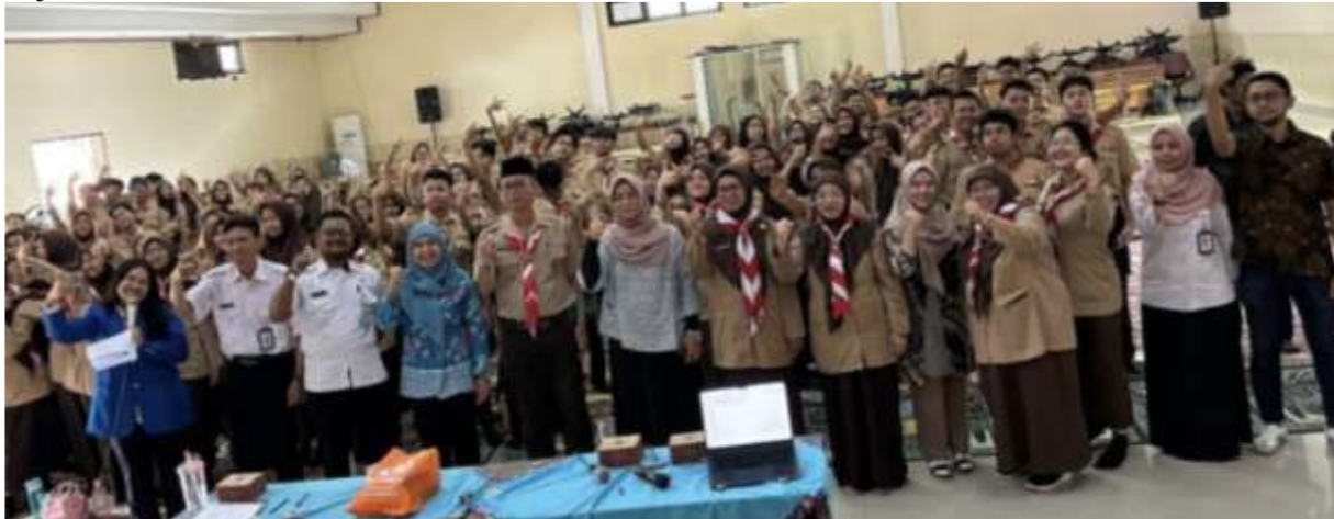
Gambar 1. Kegiatan Pengabdian Masyarakat di SMAN 8 Jakarta

adopsi perilaku di era digital meliputi: 1). Minimnya Literasi Digital dan Pemahaman Etika Penggunaan Teknologi. 2). Kesenjangan Penggunaan Teknologi untuk Kegiatan Produktif. 3). Kurangnya Keterampilan Manajemen Waktu dan Prioritas.