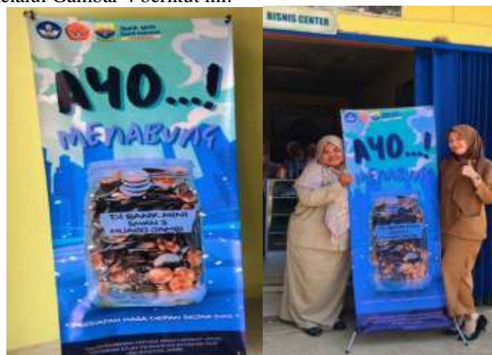
Gambar 5. Standing Benner Bank Mini dan Guru SMKN 3 Muaro Jambi dan himbauan Ayo menabung

Adapun hasil rancangan media informasi terkait implementasi Bank Mini dari hasil kegiatan PkM ini dapat dilihat melalui Gambar 4 berikut ini: