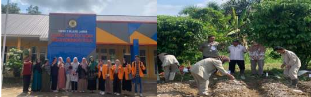
Gambar 1. Para guru dan Tim PkM di depan ruang dan Praktek siswa ATPH dan DKV

di dunia usaha, dunia industri, dan dunia kerja serta dapat melanjutkan ke jenjang pendidikan tinggi. Berdasarkan hasil pengamatan dan data Dapodik tahun 2024 diketahui bahwa SMKN 3 Muaro Jambi memiliki kondisi sekolah dengan fasilitas yang mendukung proses pembelajaran. Saat ini SMKN 3 Muaro Jambi memiliki tiga jurusan kompetensi keahlian, meliputi Desain Komunikasi Visual (DKV), Agribisnis Tanaman Pangan dan Hortikultura (ATPH), dan Akuntansi dan Keuangan Lembaga (AKL). Adapun kondisi fisik sekolah dan sarana praktek pembelajaran yang dimiliki SMKN 3 Muaro Jambi dapat dilihat melalui gambar 1 berikut ini: