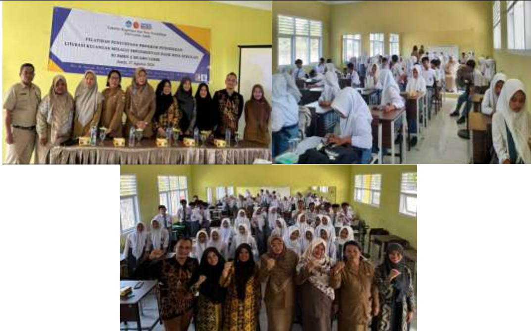
Gambar 3. Pembukaan Kegiatan FGD, Penyampaian Materi dan Diskusi dan Penutupan kegiatan FGD