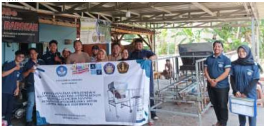
Gambar 4. Dokumentasi Pelaksanaan Pengabdian

Kendala yang terjadi saat implementasi yakni untuk proses penataan tembakau dirasa kurang rapi karena kadar air yang tinggi pada daun tembakau. Kadar air yang tinggi pada daun tembakau yang telah dirajang membuat rajangan saling mengikat dan ketika diturunkan dari wadah saling menggumpal. Namun terkait dengan kendala itu akan diselesaikan dari mitra. Dari mitra menyampaikan bahwa dengan adanya alat ini sudah sangat membantu mengingat adanya keterbatasan waktu dan SDM yang ada sedangkan permintaan selalu tinggi. Pengembangan alat untuk kedepan juga diharapkan untuk mampu menyelesaikan permasalahan-permasalahan lain di Mitra.