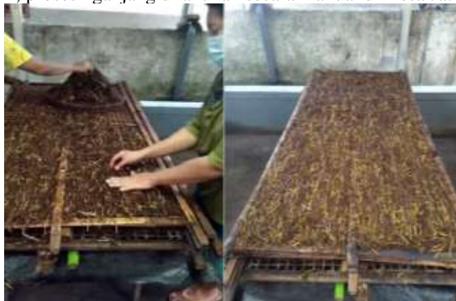
Gambar 1. Proses Nganjang Daun Tembakau di KUB. Makmur Barokah

Proses pascapanen tembakau melibatkan beberapa tahap, termasuk klasifikasi daun tembakau, perajangan daun tembakau, dan tahap nganjang. Nganjang merupakan salah satu tahap dalam pengolahan daun tembakau, di mana rajangan daun tembakau ditata pada rigen atau papan bambu untuk dijemur di bawah sinar matahari. Saat ini, proses nganjang dilakukan secara manual di Desa Jatiguwi.