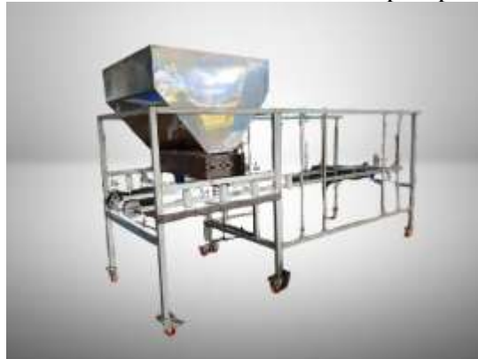
Gambar 3 Mesin Nganjang Daun Tembakau

Sehingga dirancang alat nganjang daun tembakau secara otomatis, dimana mesin ini dapat melaksanakan penataan rajangan tembakau pada rigen secara otomatis dan dengan ketebalan yang sama. Sehingga dengan adanya alat ini, permasalahan-permasalahan yang telah dipaparkan dapat diselesaikan. Ketika alat telah didesign, dirancang dan diuji coba, maka tim melaksanakan sosialisasi terkait penyampaian pengoperasian dan cara kerja alat kepada masyarakat Desa Jatiguwi yang berhubungan langsung dengan proses nganjang daun tembakau ini. Masyarakat antusias dengan adanya alat nganjang otomatis ini, karena dirasa dapat memberikan efektifitas dan efisiensi para pelaku Nganjang daun tembakau.