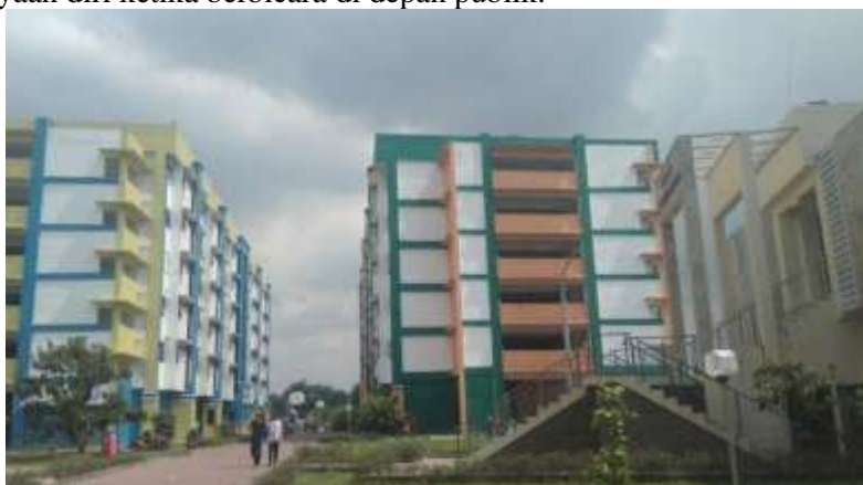
Gambar 1. Situasi Kompleks Rusunawa Jatinegara Kaum

Maka dari itu, permasalahan utama pada anak-anak setara usia sekolah dasar adalah: 1) kurangnya pelatihan keterampilan yang dapat mempersiapkan mereka untuk menghadapi tantangan global seperti keterampilan berbicara di depan publik, 2) pendidikan karakter yang sesuai dengan pelajar Pancasila, dan 3) peningkatan kepercayaan diri ketika berbicara di depan publik.