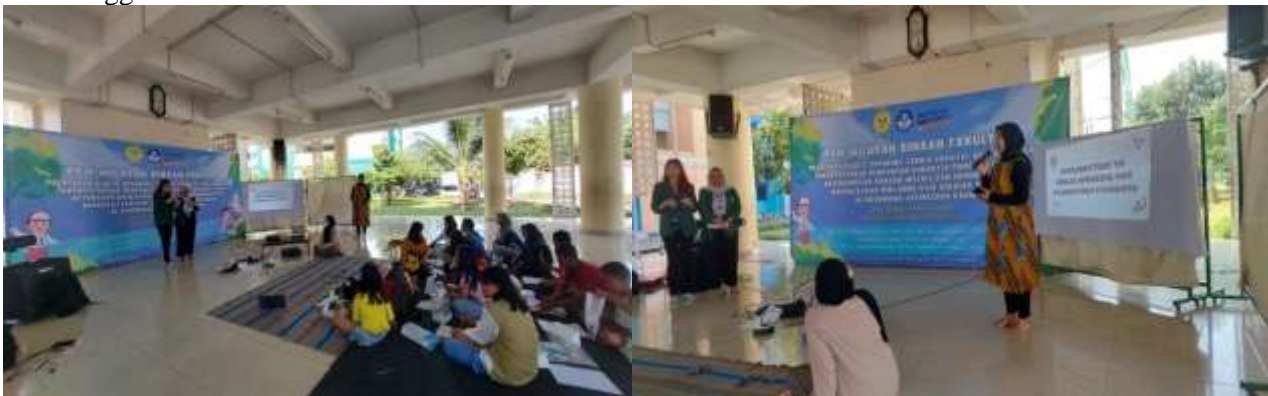
Gambar 1733. Pembukaan kegiatan yang dilanjutkan dengan paparan materi

Dalam kegiatan pelatihan public speaking dalam bahasa Inggris ini selain pemahaman tentang public speaking, peserta juga diberikan pembekalan tentang keilmuan bahasa Inggris dalam public speaking. Mereka diberikan tips dan trik bagaimana cara yang baik untuk menyampaikan kalimat pembuka dan penutup dalam bahasa Inggris.