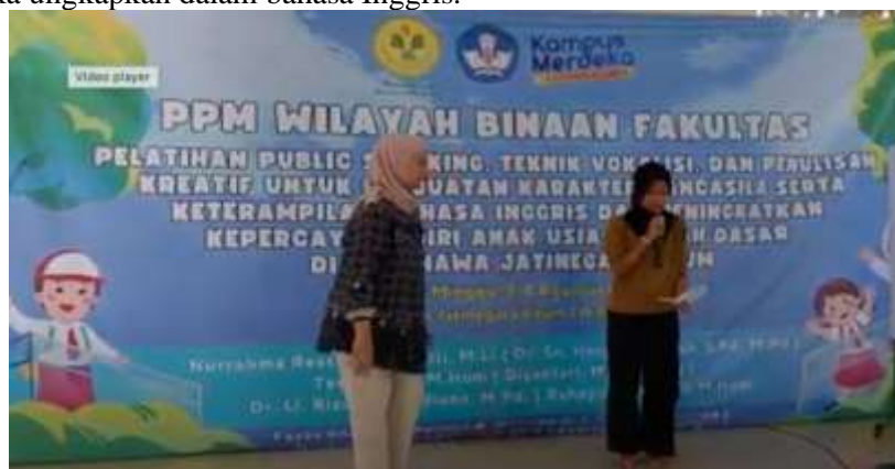
Gambar 3.. Peserta melakukan praktik presentasi di panggung

Pada hari selanjutnya, para peserta akan diminta untuk mempraktikkan apa yang telah mereka pelajari di hari pertama. Mereka menjelaskan tentang cita-cita apa yang mereka impikan ketika mereka dewasa. Beberapa hal mereka ungkapkan dalam bahasa Inggris.