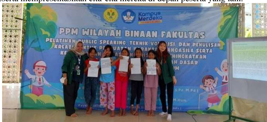
Gambar 6. Mahasiswa Sebagai Fasilitator Berfoto Dengan Beberapa Peserta

Hasil yang dipaparkan di atas adalah hasil dari pemberian materi public speaking dan keterampilan bahasa Inggris ketika peserta mempresentasikan cita-cita mereka di depan peserta yang lain.