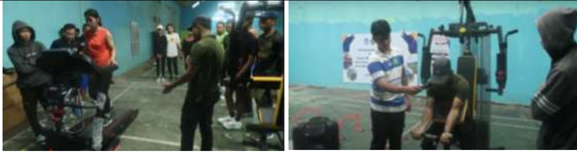
Gambar 4. Pembekalan Penggunaan Alat Olahraga