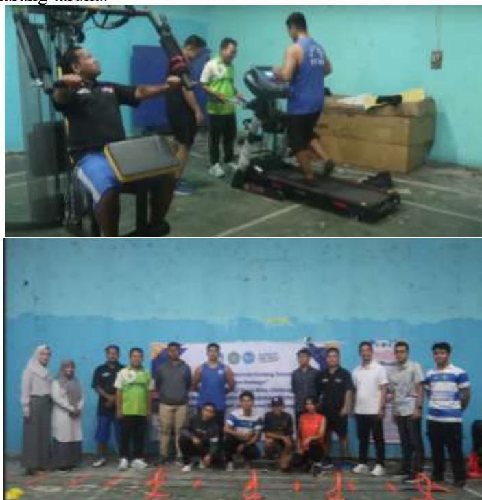
Gambar 5. Penggunaan Alat Secara Mandiri Karang Taruna Manunggal Jaya