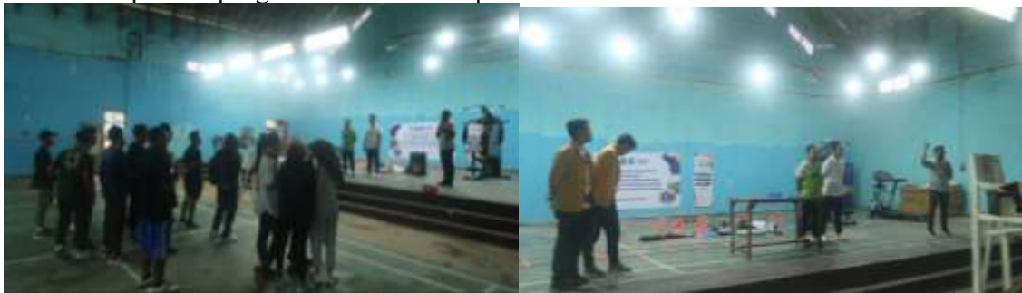
Gambar 3. Pemberian Pemahaman Terkait Alat Olahraga Pada Karang Taruna