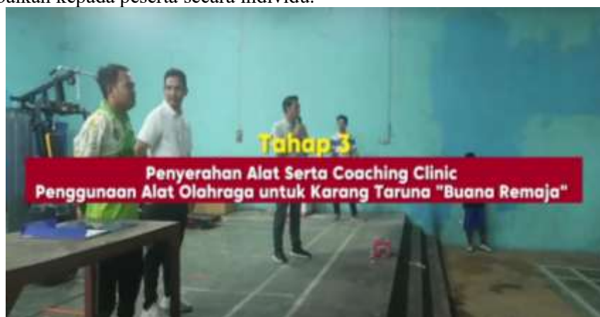
Foto Kegiatan 2. Pembukaan Coaching Clinic

Memberikan penyuluhan secara langsung mengenai manfaat olahraga, pentingnya teknik yang benar, serta dampak positif penggunaan alat olahraga seperti treadmill dan home gym bagi kesehatan fisik. Penyuluhan akan dilaksanakan dengan pendekatan interaktif agar peserta dapat berpartisipasi aktif dalam diskusi. Instruktur akan menunjukkan secara langsung cara penggunaan treadmill dan home gym dengan teknik yang benar. Demonstrasi ini mencakup langkah-langkah penggunaan dasar, pengaturan intensitas sesuai kemampuan, serta latihan yang sesuai dengan kebutuhan kebugaran peserta. Peserta akan diberikan kesempatan untuk mencoba alat olahraga di bawah pengawasan instruktur. Pendampingan secara langsung dilakukan untuk memastikan teknik penggunaan alat sudah benar dan sesuai. Instruktur juga akan memberikan koreksi dan saran perbaikan kepada peserta secara individu.