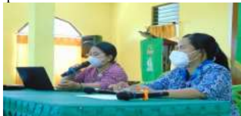
Gambar 3. Penyuluhan Sesi 1 tentang ‘Konsep Diri ’

Penyuluhan adalah upaya perbaikan dari apa yang dikerjakan sebelumnya yang ditempuh melalui system Pendidikan non formal (AS, 2009). Penyuluhan diberikan kepada para warga binaan di LAPAS kelas IIA Kupang terkait Konsep Diri