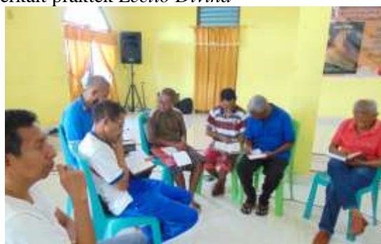
Gambar 5. Pelatihan ‘ Lectio Divina ’