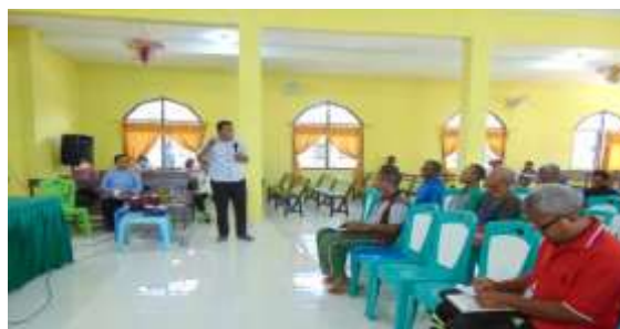
Gambar 4. Penyuluhan Sesi 2 tentang “Praktek Lectio Divina ”