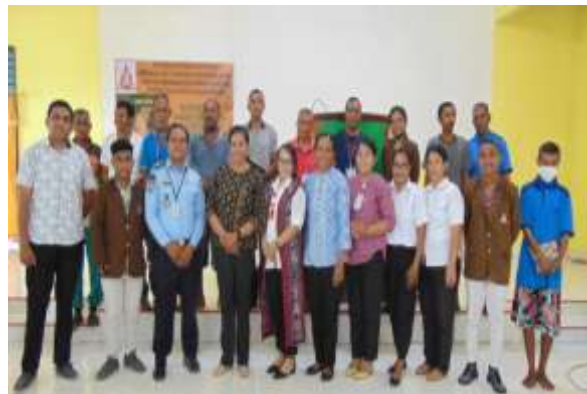
Gambar 2. Foto bersama peserta kegiatan.

Selain itu warga binaan dapat memahami Lectio Divina untuk mengembangkan mental spiritual warga binaan LAPAS IIA Kupang dengan harapan warga binaan dapat membangun, memperbaiki hubungan yang baik dengan Tuhan.