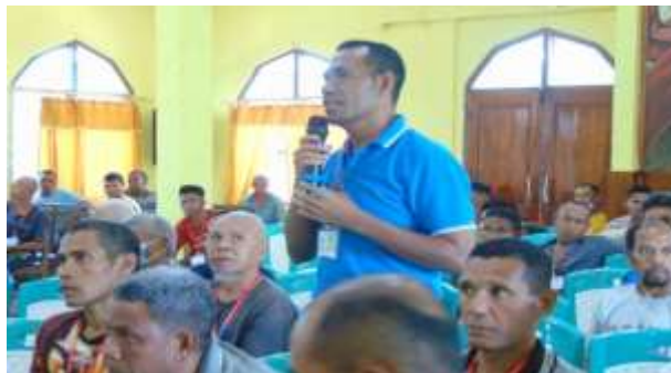
Gambar 7. Penyampaian usul dan saran dari warga binaan

Setelah penyuluhan dan praktek, warga binaan diberikan kesempatan untuk memberikan evaluasi berupa usul dan saran berkaitan dengan materi dan praktek dalam pelaksanaan kegiatan pengabdian kepada Masyarakat.