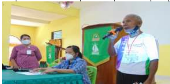
Gambar 6. Warga Binaan aktif menyampaikan pendapat

Keberhasilan kegiatan pengabdian kepada masyarakat lewat hasil pengamatan bahwa kegiatan ini disambut positif oleh peserta pada saat mendengar materi penyuluhan yang diberikan oleh masing-masing narasumber. Hal ini Nampak dari adanya peran aktif dari peserta untuk aktif bertanya dan mengemukakan apa yang tidak dipahami untuk dipahami. Keaktifan peserta dapat dilihat pada gambar di bawah ini