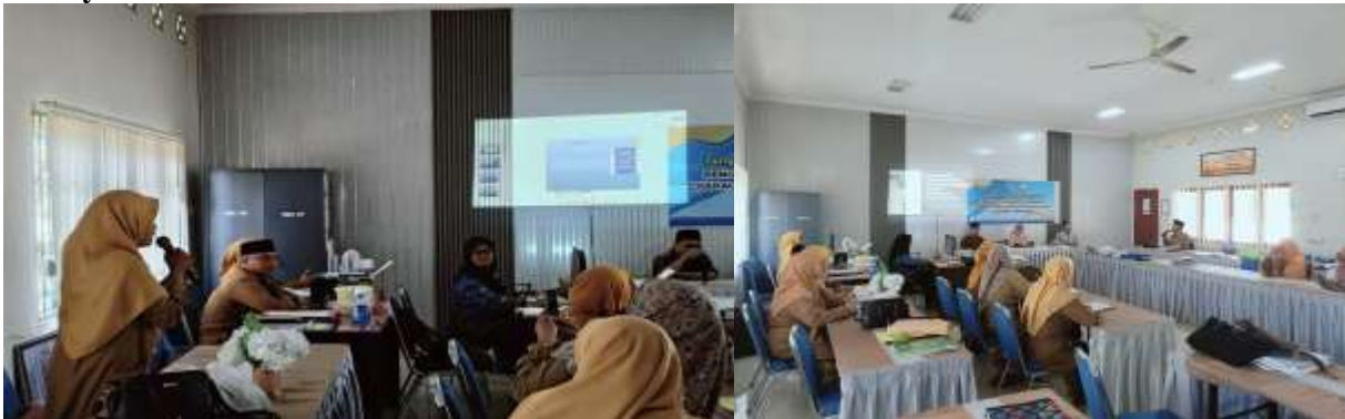
Gambar 3. Sesi Tanya Jawab Kegiatan Pengabdian Kepada Masyarakat

Pada sesi tanya jawab, guru diberi kesempatan untuk menceritakan pengalaman mereka dalam menangani bullying di sekolah. Diskusi ini memperlihatkan tantangan yang dihadapi guru, seperti sulitnya mengenali tanda awal perilaku bullying dan ketidakcukupan pendekatan yang digunakan sebelumnya (Bachri et al., 2021). Diskusi juga menekankan perlunya pendekatan yang lebih terintegrasi, seperti melibatkan Characterapy , yang bertujuan membentuk sifat karakter positif siswa dan membantu mereka membuat keputusan yang lebih baik dalam kehidupan sehari-hari (Faqih et al., 2024).