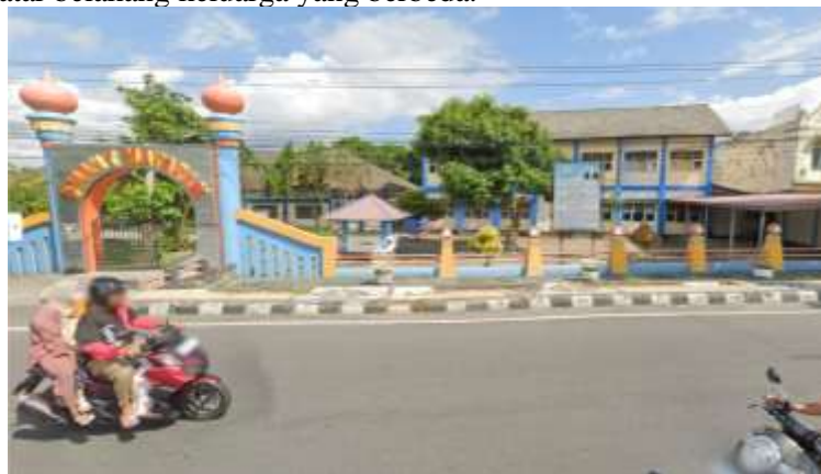
Gambar 1. Lokasi SMA 7 Mataram

Permasalahan perlindungan anak menjadi problem serius di NTB dan masih membutuhkan solusi yang tepat. Tingkat kekerasan anak di NTB terus meningkat tahun 2018 sebanyak 625 kasus, menurun dari tahun 2017 sebanyak 1063 kasus namun meningkat lagi pada tahun 2021 sebanyak 1060 kasus. SMAN 7 Mataram, terletak di sekitar komunitas yang didominasi oleh pedagang dari pasar lokal dan nelayan yang beraktivitas di pantai. Di lingkungan ini, masyarakat dan siswa memiliki ciri khas mobilitas dan kesetaraan. Namun, di balik keseharian yang riuh itu, fenomena bullying muncul dengan karakteristik yang lebih banyak bersifat non-verbal daripada verbal. Bentuknya pun beragam: mulai dari tindakan fisik seperti menyembunyikan barang-barang teman, hingga perilaku non-verbal seperti memanggil dengan nama hewan atau menggunakan kata-kata kotor. Bahkan, ada juga bentuk psikologis yang lebih halus, seperti stereotyping atau tindakan rasis terhadap teman dengan latar belakang keluarga yang berbeda.