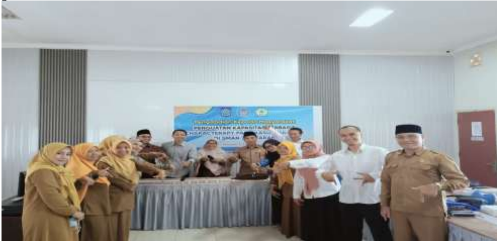
Gambar 4. Sesi Akhir Pengabdian Kepada Masyarakat di SMA 7 Mataram

Pada tahap ini, tim pengabdian kepada Masyarakat mengadakan foto Bersama dengan para peserta pelatihan. Pencapaian yang diperoleh dari kegiatan PKM ini adalah peningkatan pengetahuan teori bullying dan characterapy.