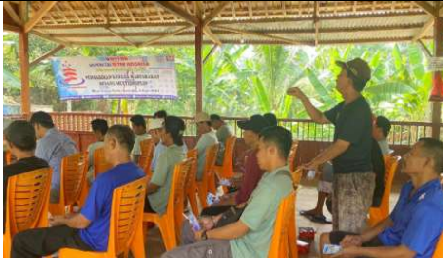
Gambar 4. Sesi Tanya Jawab Pengabdian Masyarakat