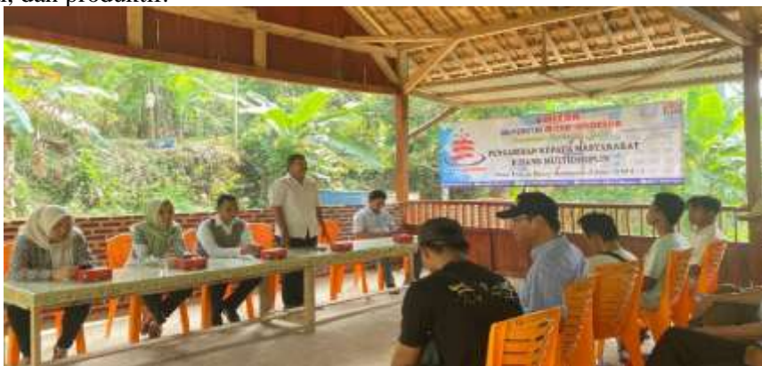
Gambar 2. Pembukaan Pengabdian Masyarakat

Secara keseluruhan, hasil pelaksanaan pendampingan pembuatan konten digital yang aman dan legal di Desa Way Tebing Ceba sangat memuaskan. Program ini tidak hanya meningkatkan keterampilan dan pengetahuan masyarakat tetapi juga membawa manfaat ekonomi dan sosial yang berkelanjutan. Desa Way Tebing Ceba kini lebih siap menghadapi era digital dengan kemampuan untuk memanfaatkan teknologi secara aman, legal, dan produktif.