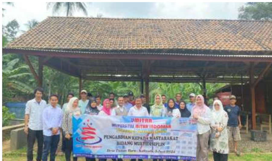
Gambar 5. Penutupan Pengabdian Masyarakat