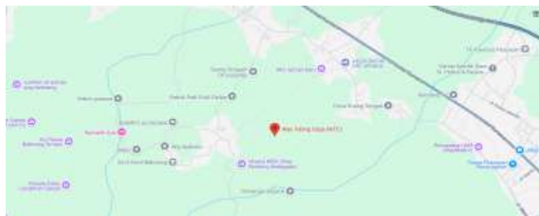
Gambar 1. Lokasi Pengabdian Masyarakat

Berdasarkan hasil survey atau observasi pada Masyarakat Desa Wisata Way Tebing Ceba (WTC) Kabupaten Lampung kurang memahami peraturan dan hukum yang mengatur penggunaan konten digital, termasuk hak cipta, privasi, dan etika digital. Hal ini dapat menyebabkan pelanggaran hukum yang tidak disengaja.