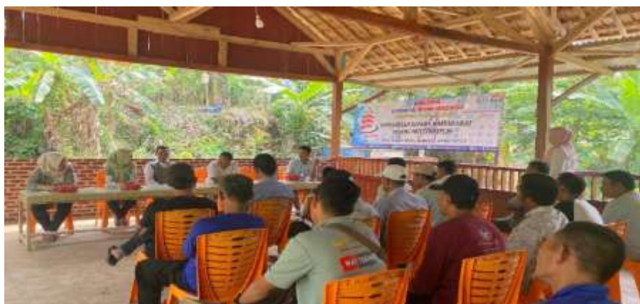
Gambar 3. Penyampaian Materi Pengabdian Masyarakat