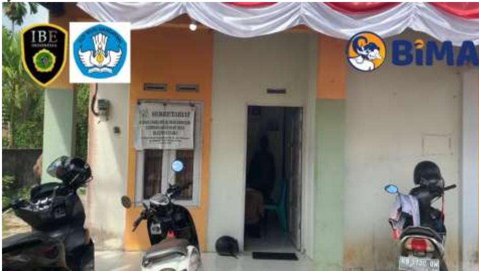
Gambar 1. Lokasi BUMDESMA Raja Bina Usaha LKD

BUMDesma Raja Bina Usaha, yang berlokasi di Kecamatan Rasau Jaya, Kabupaten Kubu Raya, saat ini menghadapi berbagai tantangan dalam proses transisi dari sistem konvensional ke sistem berbasis syariah. Sebagai lembaga keuangan desa yang mengelola modal awal miliaran rupiah dari program PNPM MPd, transformasi ini dilakukan untuk menjawab kebutuhan masyarakat akan layanan keuangan yang sesuai dengan prinsip syariah. Namun, proses ini tidak lepas dari berbagai permasalahan yang menghambat implementasinya.