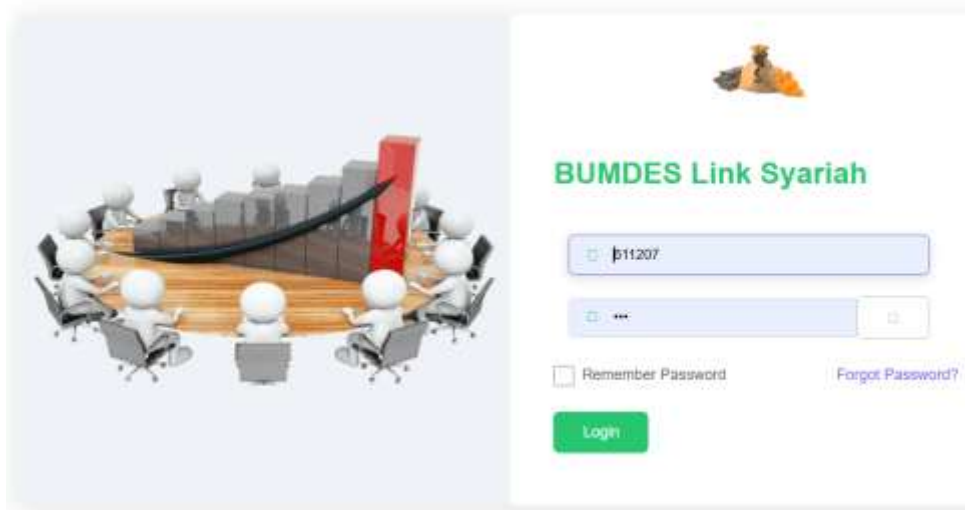
Gambar 2. Aplikasi Simpan Pinjam Syariah

Secara keseluruhan, hasil dari program transformasi ini menunjukkan bahwa penerapan sistem keuangan syariah dan adopsi teknologi berbasis digital di BUMDesma memberikan dampak positif yang signifikan. Selain meningkatkan efisiensi dan transparansi dalam pengelolaan keuangan, transformasi ini juga memperkuat peran BUMDesma dalam pemberdayaan ekonomi masyarakat desa, dengan prinsip yang sesuai dengan nilai-nilai syariah yang dipegang oleh masyarakat. Diharapkan, hasil positif ini dapat menjadi model yang bisa diterapkan pada BUMDesma lain di Indonesia, mendukung kesejahteraan ekonomi berbasis prinsip keadilan dan kesejahteraan sosial.