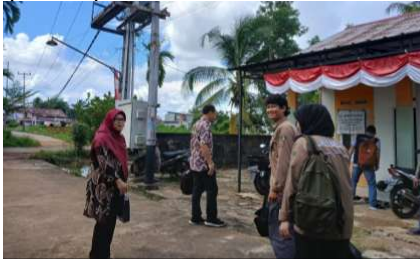
Gambar 2. Tim PKM IBE Indonesia tiba di Lokasi

Salah satu keberhasilan signifikan yang dicapai adalah peningkatan kepercayaan masyarakat terhadap BUMDesma setelah penerapan sistem syariah. Dalam survei awal, masyarakat mengungkapkan kekhawatiran terkait unsur riba dalam sistem konvensional yang selama ini diterapkan. Setelah transformasi, partisipasi masyarakat meningkat secara signifikan, menunjukkan bahwa sistem syariah lebih mudah diterima, terutama bagi masyarakat yang memiliki preferensi keuangan sesuai nilai agama. Dengan adanya peningkatan partisipasi ini, jumlah dana simpan pinjam yang dikelola oleh BUMDesma pun meningkat, memberikan dampak positif terhadap stabilitas ekonomi lokal.