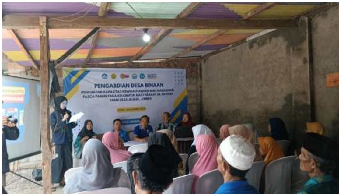
Gambar 5. Pembukaan pelatihan manajemen keuangan oleh MC