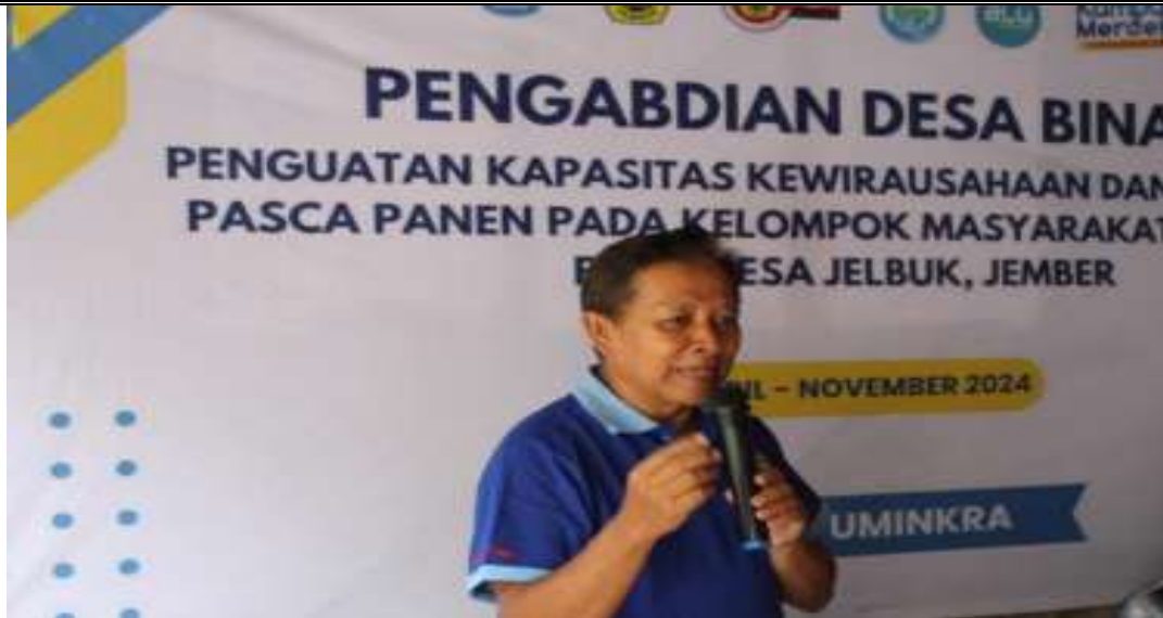
Gambar 6. Penyampaian materi