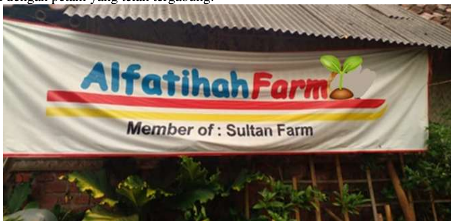
Gambar 1. Lokasi POKMAS Al-Fatihah Farm

Terdapat kelompok masyarakat yang terdiri dari anak muda Desa Jelbuk yang peduli terhadap kesejahteraan petani yang dinaungi dengan pembentukan Kelompok Masyarakat (POKMAS) Alfatihah Farm. POKMAS Al Fatihah Farm terbentuk pada tahun 2021 dan disahkan melalui keputusan Kepala Desa Jelbuk Nomor: 141/20/15.09.25.2004/2023. POKMAS Al Fatihah Farm telah mengkoordinir masyarakat di Desa Jelbuk untuk tidak lagi menjual hasil panennya dalam bentuk gabah melainkan menjual dalam bentuk beras yang sudah dikemas dan hasil penjualan produk tersebut nantinya akan diperhitungkan menggunakan pengelolaan manajemen keuangan yang lebih baik. Rencananya harga jual beras disepakati antara POKMAS Al-Fatihah Farm dengan petani yang telah tergabung.