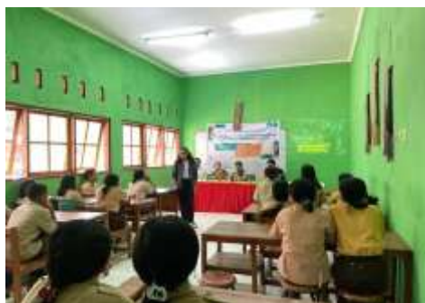
Gambar 1. Kegiatan Presentasi Menggunakan Media Visual

Pelaksanaan sosialisasi pencegahan dan penanganan bullying di SMKN Bikomi Selatan, tim memulai dengan membuka acara dan memperkenalkan tujuan kegiatan kepada para siswa yang hadir serta pemberian pretest untuk mengetahui kemampuan awal siswa tentang perundungan. Kegiatan ini diikuti oleh siswa kelas XI sebanyak 21 orang. Kami menjelaskan pentingnya menciptakan lingkungan sekolah yang aman dan bebas dari perilaku perundungan atau bullying , serta dampak positif yang bisa dirasakan oleh siswa. Selanjutnya, sesi sosialisasi dimulai dengan penyampaian materi menggunakan metode yang interaktif dan komunikatif. Tim menggunakan media visual, seperti video edukatif tentang jenis-jenis bullying dan dampak psikologis yang ditimbulkannya, hal ini bertujuan untuk memberikan pemahaman yang mendalam bagi siswa tentang perilaku bullying .