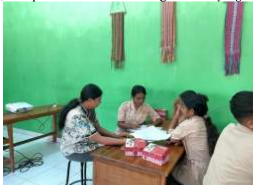
Gambar 2. Kegiatan Diskusi Kelompok

Setelah sesi materi, kami mengajak siswa untuk berdiskusi dalam kelompok kecil, agar mereka dapat berbagi pandangan, pengalaman, dan pemahaman baru mengenai bullying .