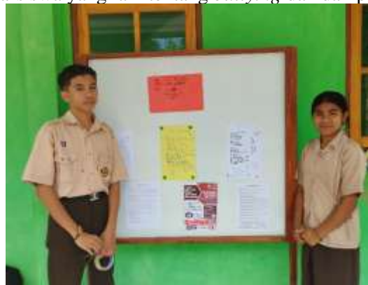
Gambar 3. Kegiatan Simulasi Pembuatan Poster Anti-Bullying

Kegiatan ini dilanjutkan dengan simulasi sederhana untuk menyampaikan aspirasi mereka tentang bullying melalui puisi dan poster yang ditempel pada majalah dinding sekolah sebagai sarana untuk menginformasikan kepada siswa-siswa yang lain tentang bullying dan dampaknya di sekolah.