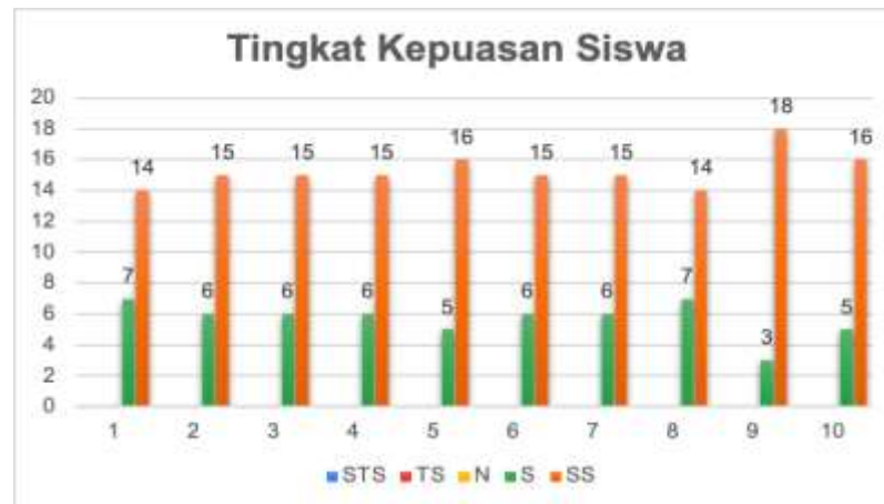
Gambar 4. Grafik Tingkat Kepuasan Siswa Terhadap Kegiatan Sosialisasi

Pada tahap pengisian kuesioner umpan balik, siswa di SMKN Bikomi Selatan diminta untuk memberikan tanggapan mereka terkait kegiatan sosialisasi pencegahan dan penanganan bullying . Kuesioner yang diberikan mencakup beberapa aspek utama, seperti ketertarikan peserta terhadap sosialisasi, relevansi topik bullying , serta minat untuk mempelajari lebih lanjut cara pencegahan dan penanganan bullying . Peserta juga diminta untuk mengevaluasi kualitas materi yang disampaikan, antusiasme mereka selama mengikuti kegiatan, serta kesadaran akan pentingnya materi tersebut dalam meningkatkan pemahaman tentang bahaya bullying .