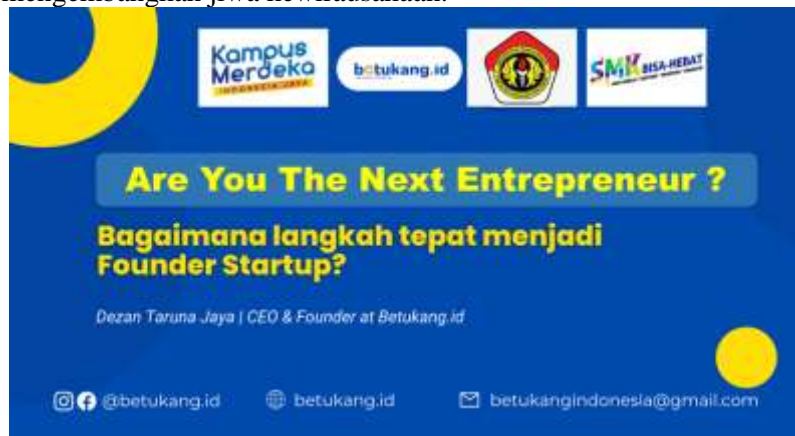
Gambar 3. Modul Literasi Kewirausahaan Tentang Bisnis Start-up

Mitra dalam kegiatan ini adalah pihak dari SMK Negeri 1 Sungai Raya yang telah menyiapkan peserta, menyediakan sarana dan prasarana hingga mendukung terlaksananya kegiatan pengabdian kepada masyarakat ini. Keberlanjutan program pengabdian kepada masyarakat ini diupayakan agar dijalin kerjasama sebagai mitra binaan dalam bidang kewirausahaan untuk meningkatkan motivasi siswa SMK Negeri 1 Sungai Raya dalam mengembangkan jiwa kewirausahaan.