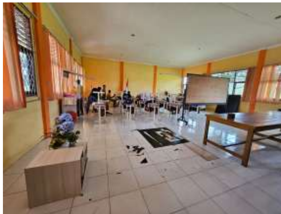
Gambar 1. Situasi Ruang Pembelajaran SMK Negeri 1 Sungai Raya

Tenaga pengajar di SMK dihadapkan keterbatasan materi seperti buku teks, materi pembelajaran, dan perangkat lunak yang diperlukan untuk mendukung pengajaran kewirausahaan. Keterbatasan ini dapat mempengaruhi kualitas pembelajaran dan pemahaman siswa terkait kewirausahaan. Sekolah Menengah Kejuruan Negeri 1 Sungai Raya berlokasi di Jalan Sultan Agung, Kuala Dua, Kecamatan Sungai Raya, Kabupaten Kubu Raya. Sekolah ini memiliki 783 siswa dengan jumlah guru sebanyak 38 orang. SMK Negeri 1 Sungai Raya memerlukan pemahaman tentang kewirausahaan agar kedepannya minat berwirausaha dapat meningkat. Kurikulum kewirausahaan yang ada pada SMK Negeri 1 Sungai Raya masih dianggap kurang komprehensif dan tidak terintegrasi dengan baik dengan mata pelajaran lainnya. Pengembangan literasi kewirausahaan di kalangan siswa SMK merupakan langkah penting untuk mempersiapkan generasi muda yang siap menghadapi tantangan dunia kerja yang dinamis. Adapun keterbatasan kemampuan tenaga pengajar melalui pelatihan dan pengembangan profesional untuk mengajar mata pelajaran kewirausahaan menjadi salah satu faktor penghambat. Pengabdian Kepada Masyarakat ini bertujuan untuk menyediakan pemahaman dan pengetahuan kepada siswa terkait kewirausahaan dan memberikan dorongan kepada siswa