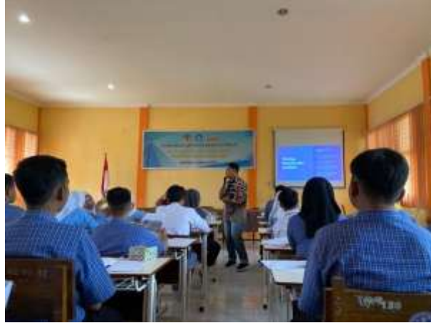
Gambar 2. Pelaksanaan Kegiatan PKM

Pelaksanaan diawali dengan materi mengenai konsep kewirausahaan hingga simulasi dan diskusi mengenai model bisnis startup bagi siswa SMK Negeri 1 Sungai Raya meliputi: