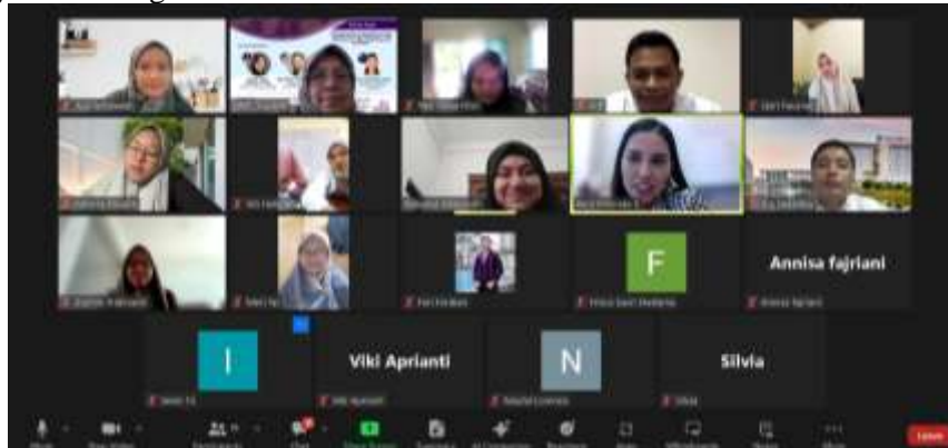
Gambar 3. Pelaksanaan Zoom untuk merencanakan kegiatan studi lapangan ke Taylor University

Tahap Perencanaan ini dilakukan secara daring (dalam jaringan) via ZOOM selama 2 bulan sejak bulan Agustus hingga bulan September 2024. Pembahasan pada tahap ini meliputi manfaat yang ingin didapatkan pada kegiatan ini, pemilihan tujuan studi lapangan yang dipilih yaitu Taylor University Malaysia dan Malaysia Tourism Centre (MaTiC), penyusunan roundup kegiatan dan pedoman wawancara serta pemilihan agent travel yang bekerja sama dengan Fakultas Pariwisata dan Perhotelan.