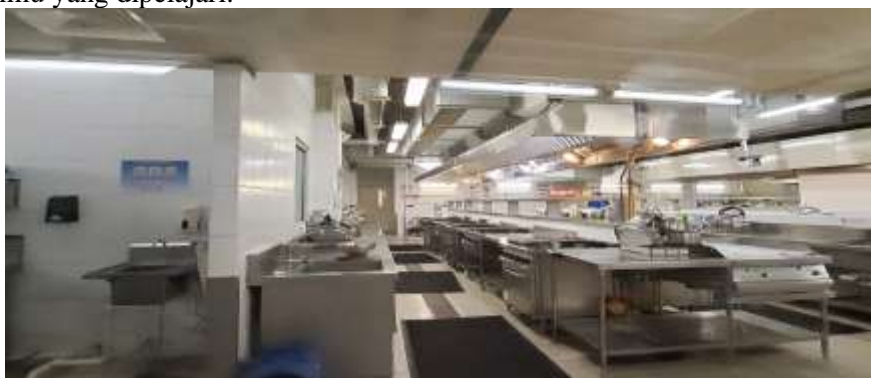
Gambar 6. Ruang Praktek Culinary

Pada aspek kekuatan pertama, perkuliahan di Taylor University memiliki keunggulan yang kuat dalam penggunaan teknologi dan metode pengajaran interaktif. Penggunaan Learning Management System (LMS) dan platform digital lainnya memungkinkan mahasiswa mengakses materi kuliah, berinteraksi dengan dosen, serta melakukan diskusi kelompok secara lebih mudah dan terstruktur. Penggunaan teknologi ini didukung oleh fasilitas kampus yang modern, seperti ruang kelas digital, laboratorium inovasi, dan perpustakaan online yang memungkinkan mahasiswa melakukan riset dan pembelajaran mandiri dengan optimal. Selain itu, keberadaan dosen berkualitas yang memiliki pengalaman internasional menjadi nilai tambah dalam menyampaikan materi dengan perspektif global yang mendalam, sehingga mahasiswa memiliki pemahaman yang lebih luas dan kontekstual terhadap disiplin ilmu yang dipelajari.