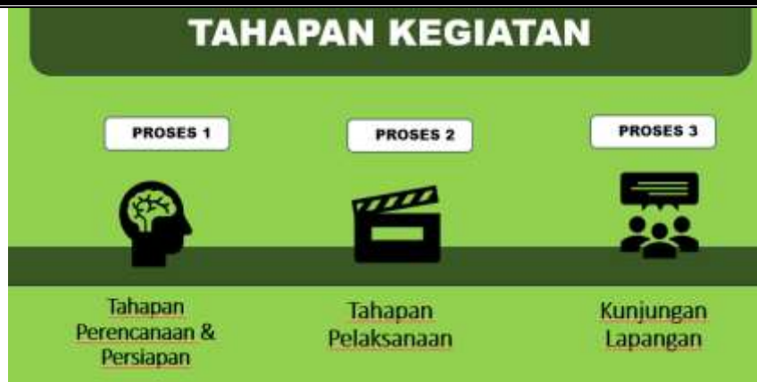
Gambar 2. Tahap Kegiatan

Kegiatan ini terdiri dari 3 tahapan umum, yaitu Perencanaan, Pelaksanaan dan Kunjungan ke lapangan. Kegiatan ini dilakukan dengan tujuan tempat yang relevan dengan bidang studi mahasiswa S2 Pariwisata yaitu salah satu universitas terkemuka di Malaysia yang dikenal dengan nama Taylor University.