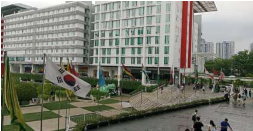
Gambar 9. Bendera Negara yang Berkolaborasi dengan University Taylor Malaysia

institusi lokal, yang pada akhirnya memperkuat daya saing dan reputasi perguruan tinggi lokal di tingkat global.