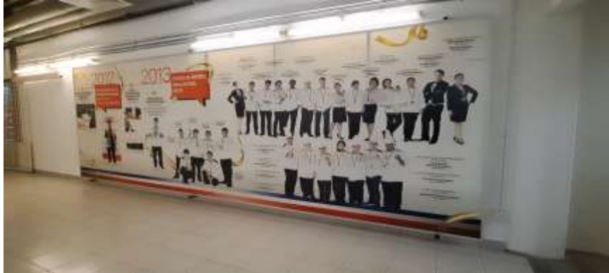
Gambar 11. Mading Pencapaian kompetisi yang diraih Taylor's Culinary Institute

Dari analisis SWOT, terdapat sejumlah pelajaran strategis yang dapat diambil untuk meningkatkan daya saing universitas lokal agar mampu bersaing di tingkat global. Pertama, pengembangan kurikulum berbasis kompetensi yang menekankan penguasaan keterampilan praktis sesuai kebutuhan industri menjadi hal yang penting. Universitas lokal dapat mengevaluasi struktur kurikulum mereka untuk memastikan keterkaitan yang kuat antara teori dan praktik, serta memberikan penekanan pada kompetensi yang relevan dengan permintaan pasar global.