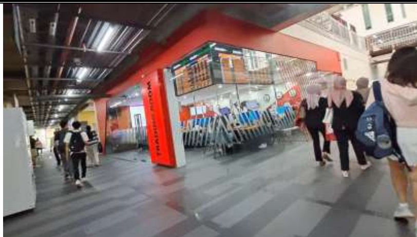
Gambar 7. Trading Room