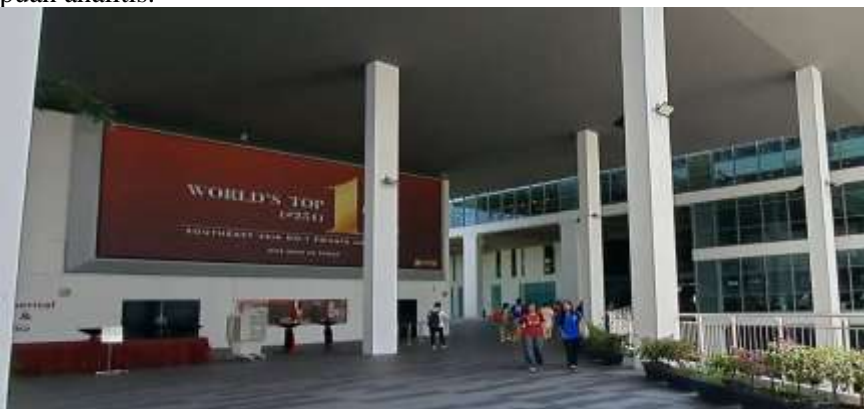
Gambar 10. Taylor University World's Top 1 Asia

Dalam upaya meningkatkan kualitas pendidikan tinggi di universitas lokal, ada beberapa elemen kunci dari sistem pembelajaran Taylor University yang relevan dan dapat diadopsi. Pertama, metode pembelajaran interaktif yang diterapkan di Taylor University menunjukkan bahwa partisipasi aktif mahasiswa dalam proses belajar dapat meningkatkan pemahaman dan keterlibatan mereka terhadap materi. Universitas lokal dapat menerapkan metode serupa dengan memperkenalkan kelas berbasis diskusi, studi kasus, atau pembelajaran berbasis proyek, yang memungkinkan mahasiswa untuk berperan aktif dalam mengembangkan pemikiran kritis dan kemampuan analitis.