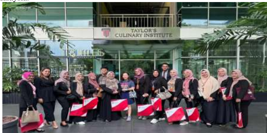
Gambar 1. Taylor's Culinary Institute

Sasaran kegiatan ini adalah untuk mempelajari dan membandingkan sistem perkuliahan, kurikulum, serta metode pembelajaran di universitas-universitas terkemuka di Malaysia, dengan tujuan mengidentifikasi praktik-praktik terbaik yang dapat diadopsi untuk meningkatkan kualitas pendidikan di Indonesia. Selain itu, kegiatan ini dapat memperluas wawasan mahasiswa dalam bidang pariwisata berkelanjutan melalui pengamatan empiris di lapangan, serta membangun jaringan kerja sama antara Universitas Negeri Padang dan universitas di Malaysia.