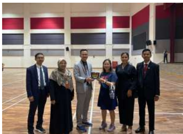
Gambar 8: Penyerahan Cendramata dengan Dosen Taylor University Malaysia

Sistem perkuliahan berbasis teknologi di Taylor University dapat menjadi inspirasi bagi pengembangan pendidikan di negara-negara lain, termasuk Indonesia. Adaptasi model ini dapat meningkatkan kualitas pembelajaran di perguruan tinggi lokal, sehingga mampu mencetak lulusan dengan kompetensi yang lebih unggul. Institusi pendidikan tinggi lokal dapat menggunakan Taylor University sebagai model dalam mendesain kurikulum berbasis kompetensi, yang lebih responsif terhadap kebutuhan pasar kerja dan perkembangan teknologi.