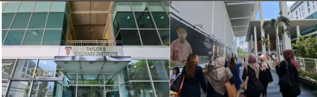
Gambar 5. Kunjungan Mahasiswa dan Dosen ke Taylor University (Taylor's Culinary Institute)