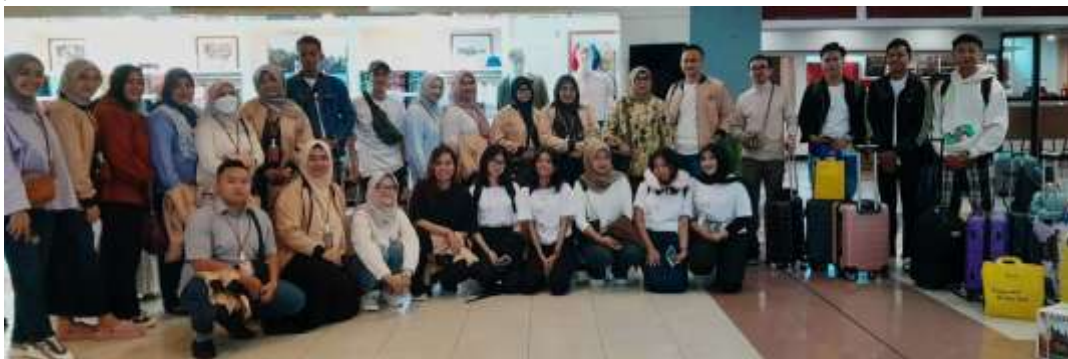
Gambar 4. Keberangkatan menuju Malaysia (Bandara International Minangkabau)

Pelaksanaan kegiatan ini pada tanggal 8 sampai dengan 11 Oktober dengan jumlah mahasiswa S2 Pariwisata sebanyak 20 orang, Mahasiswa D4 Perhotelan sebanyak 10 orang dan 3 orang Dosen Pembimbing. Keberangkatan langsung dari Bandara International Minangkabau ke Malaysia dalam lama perjalanan 1 jam 45 menit.