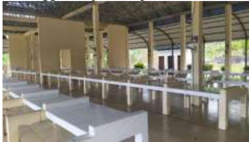
Gambar 2. Kondisi Pasar Karang Joang Saat ini

penyebaran dan angka kematian semakin meningkat, WHO memberlakukan PSBB (Pembatasan Sosial Berskala Besar) karena kekhawatiran akan tersebar luasnya wabah tersebut. Hal tersebut bertujuan agar semua negara meningkatkan kewaspadaan dalam mencegah dan menangani wabah penyakit tersebut. Dengan adanya Kebijakan tersebut memberikan dampak yang sangat besar terhadap pendapatan pedagang dengan adanya penurunan jumlah pembeli sehingga menjadikan pasar terhenti ataupun tidak beroperasi lagi.