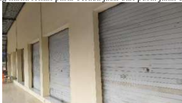
Gambar 4. Kondisi Pasar Karang Joang Saat ini

Berdasarkan hasil wawancara bersama Kepala Bidang Sarana Perdagangan, beliau mengatakan bahwa faktor utama penghambat keberlangsungan Pasar Karang Joang adalah penurunan omzet pedagang sehingga bisnis yang mereka jalankan tidak sesuai dengan harapan yang ada. Hal tersebut disebabkan oleh kurangnya pengunjung di Pasar Karang Joang karna lokasi pasar berada jauh dari pusat jalan dan rumah pembeli.