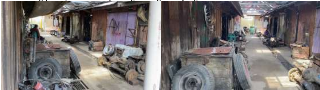
Gambar 3. Kondisi Pasar Loak Besi Saat Ini

Hasil penelitian yang dilakukan menunjukkan bahwa Pasar Karang Joang pada awalnya telah beroperasi sejak lama, namun dengan adanya pandemi Covid-19 membuat pasar ini semakin hari semakin sepi pengunjung yang pada akhirnya tidak beroperasi, Oleh karena itu dilakukan berbagai perencanaan yang dapat mengatur pemanfaatan dan pengelolaan Pasar Karang Joang agar dapat beroperasi kembali. Perencanaan yang utama diterapkan pada Pasar Karang Joang adalah perencanaan jangka Panjang, yaitu pemindahan pasar Loak Besi ke Pasar Karang Joang. Pasar Loak Besi merupakan pasar yang menjual berbagai macam bentuk mesin, perlengkapan alat berat, dan alat-alat mesin bekas seperti besi tua. Kondisi pasar Loak Besi saat ini memiliki petak atau toko yang lebih sedikit dibanding pasar pada umumnya dengan bangunan yang kumuh dan berantakan.