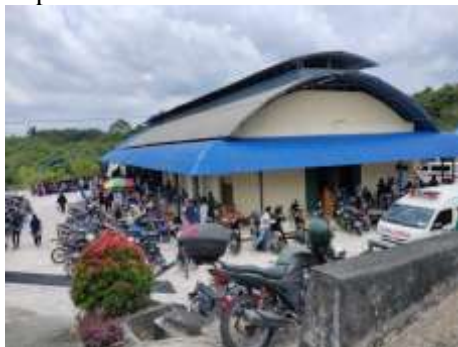
Gambar 1. Kondisi Pasar Karang Joang Sebelum Pandemi

Dalam perkembangan ekonomi perkotaan, keberadaan pasar tradisional dan pasar modern menjadi bagian yang saling terikat di kalangan masyarakat salah satu nya adalah Pasar Karang Joang. Pasar Karang Joang adalah pasar tradisional yang berlokasi di kelurahan Karang Joang, kecamatan Balikpapan Utara, Kota Balikpapan yang berdiri sejak tahun 2014. Karang Joang merupakan pasar yang dikelola oleh Dinas Perdagangan Kota Balikpapan. Pasar ini dilengkapi dengan fasilitas umum yang memadai contohnya lahan parkir, mushola, toilet, dan petak ataupun los.