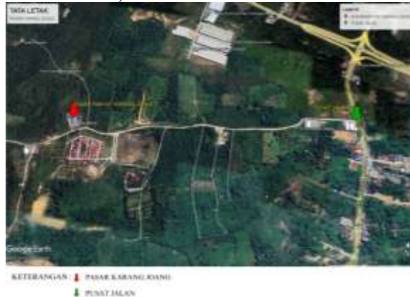
Gambar 5. Lokasi Pasar Karang Joang

“yang menjadi penghambat adalah jarak yang tidak dekat dengan jalan utama dan jumlah penduduk yang masih sedikit” (Wawancara Bersama Ibu Yusvinie Fzriah H selaku Kepala Bidang Sarana Perdagangan, Tanggal 7 Oktober 2024).