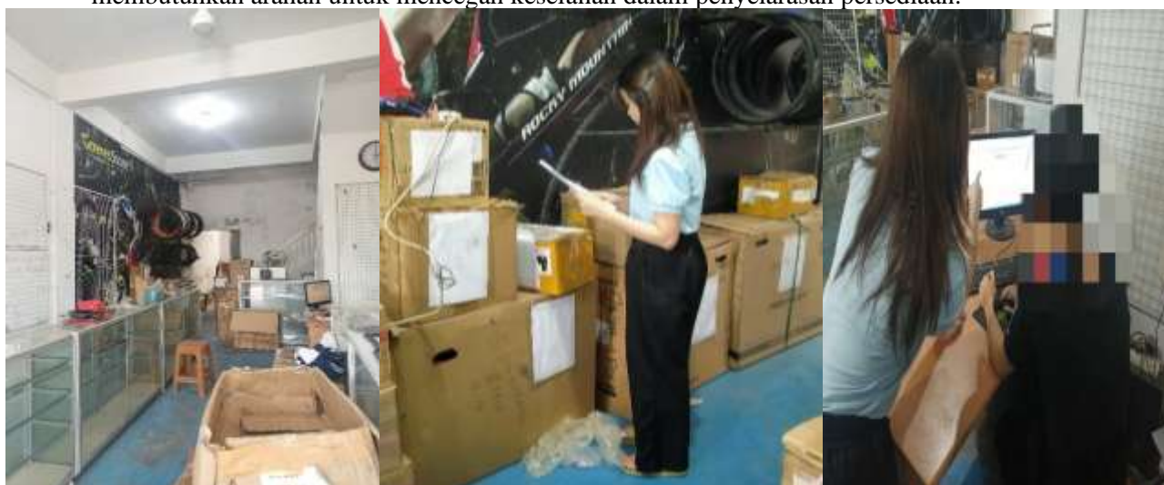
Gambar 4. Perhitungan persediaan dan Stock Opname , Sumber: Penulis (2024)

Setelah mencetak daftar persediaan toko, langkah berikutnya adalah menghitung jumlah persediaan fisik yang ada di toko secara teliti. Proses ini bertujuan untuk memastikan keakuratan data persediaan yang ada di lapangan. Proses perhitungan tersebut dilakukan oleh penulis bersama dengan karyawan Goves Store Premium untuk memastikan semua persediaan didalam toko telah dihitung dengan baik. Setelah perhitungan persediaan fisik selesai dilakukan, tahap selanjutnya adalah melaksanakan Stock Opname . Langkah ini dilakukan untuk menyelaraskan hasil perhitungan fisik dengan data yang tercatat dalam sistem, sehingga dapat meminimalkan kesalahan dalam manajemen persediaan. Stok Opname dilakukan oleh karyawan mitra dengan arahan penulis sebagai bentuk pelatihan dalam melakukan Stok Opname menggunakan sistem akuntansi GF-Akuntansi. Hal tersebut dilakukan karena karyawan tidak memahami proses Stok Opname yang perlu dilakukan sehingga membutuhkan arahan untuk mencegah kesalahan dalam penyelarasan persediaan.