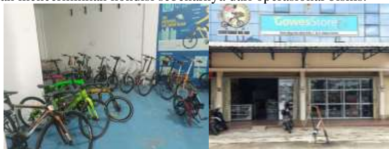
Gambar 2. Lokasi Gowes Store Premium

Gowes Store Premium mengalami beberapa masalah yang mempengaruhi operasional sehari-hari. Salah satu masalah utama yang perlu diselesaikan adalah adanya perbedaan antara persediaan fisik dengan catatan di sistem GF-Akuntansi. Hal ini disebabkan karena pengecekan persediaan seringkali dilakukan ketika barang hampir habis, kemudian dibandingkan dengan data di sistem. Selain itu, karyawan sering kali mencatat secara manual karena kurang familiar dengan penggunaan sistem akuntansi yang ada. Masalah ini bisa menimbulkan kesulitan dalam manajemen persediaan dan menyebabkan ketidakakuratan dalam laporan keuangan, yang pada akhirnya dapat mempengaruhi pengambilan keputusan bisnis. Untuk menjaga kelangsungan bisnis yang baik dan meningkatkan pengelolaan persediaan, penting bagi Gowes Store Premium untuk mengatasi masalah ini dengan memperbaiki manajemen persediaan dan melatih karyawan dalam penggunaan sistem akuntansi yang efektif. Dengan demikian, toko dapat menghindari kesalahan dalam manajemen persediaan dan memastikan bahwa laporan persediaan mencerminkan kondisi sebenarnya dari operasional bisnis.