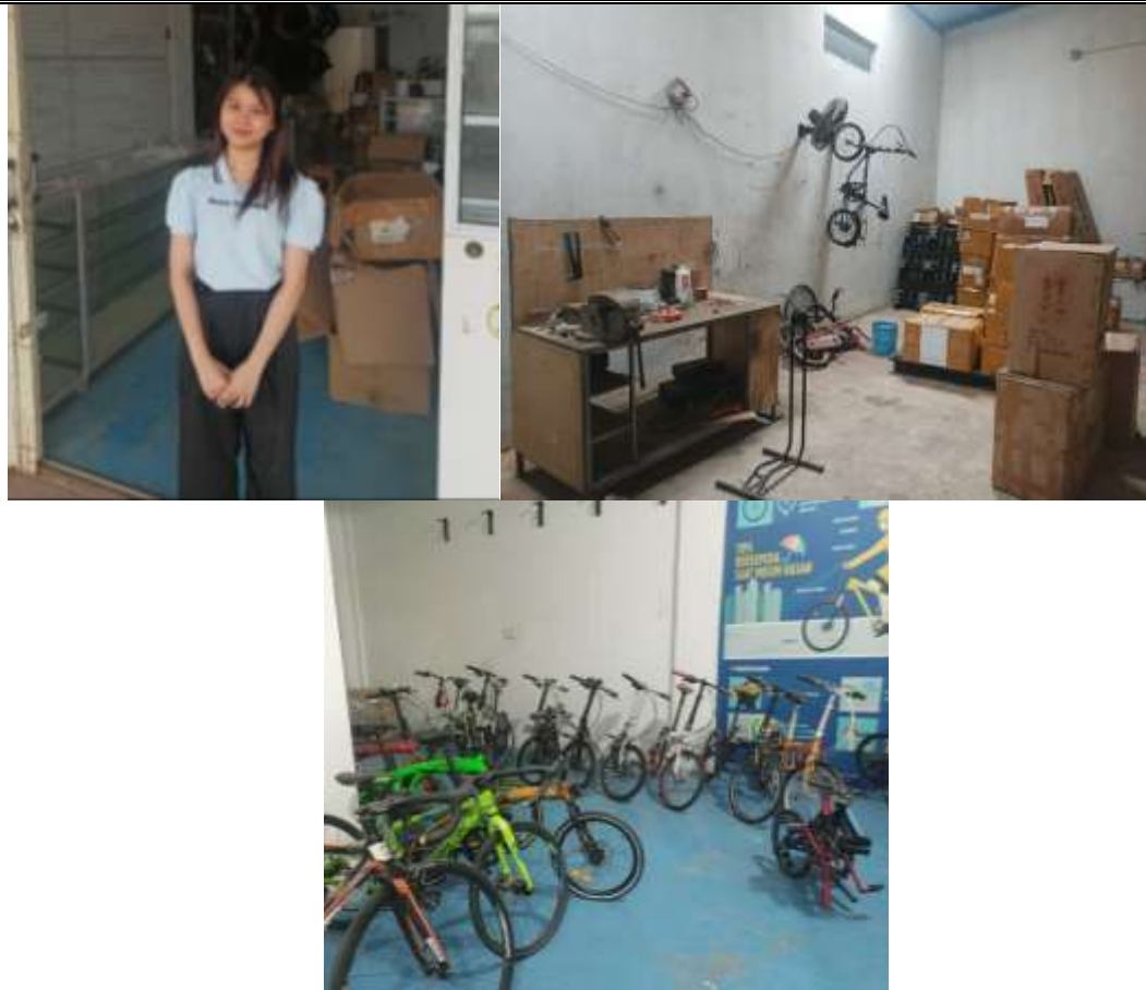
Gambar 6. Dokumentasi Pelaksanaan Pengabdian, Sumber: Penulis (2024)