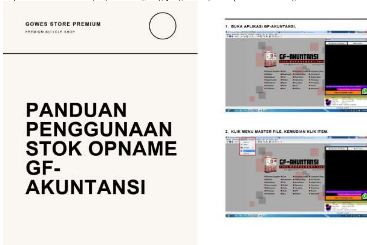
Gambar 5. Modul Stock Opname

pelaksanaan Stok Opname dalam sistem GF-Akuntansi. Modul dibuat menggunakan Microsoft Word yang kemudian diserahkan kepada mitra dalam bentuk PDF, Isi dari modul yang dibuat berupa tahapan dari awal bukanya sistem sampai akhir tahapan Stok Opname beserta foto langkah-langkah yang dibutuhkan untuk memudahkan pengguna dalam mengikuti panduan. Dengan adanya panduan ini maka UMKM dapat dengan mudah mengajarkan prosedur tersebut kepada karyawan baru hanya dengan memberikan panduan tersebut tanpa harus memberikan penjelasan langsung yang bisa saja terlupakan dan kurang efektif.