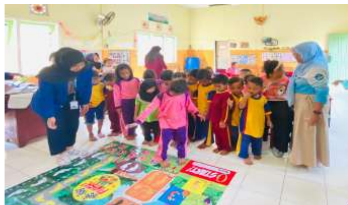
Gambar 3. Pelaksanaan Permainan