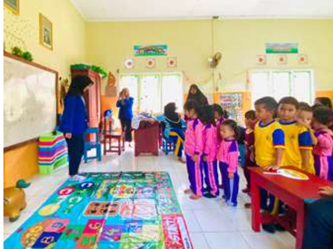
Gambar 2. Demonstrasi Permainan