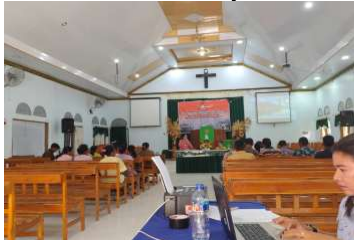
Gambar 1. Lokasi Pelaksanaan Kegiatan

dalam memanfaatkan sumber daya lokal secara berkelanjutan. Keterbatasan infrastruktur dan sulitnya akses pasar juga menjadi hambatan besar bagi masyarakat untuk mengembangkan usaha kecil dan menengah. Di sisi lain, rendahnya dukungan untuk membangun kolaborasi sosial dan ekonomi memperparah situasi, karena masyarakat tidak memiliki ekosistem kewirausahaan yang inklusif untuk mendorong perubahan sosial. Terakhir, kurangnya pemahaman jemaat akan peran sosial gereja membuat potensi gereja sebagai agen perubahan sosial belum dimanfaatkan secara maksimal. Sebagian besar jemaat masih memandang gereja hanya sebagai tempat untuk kegiatan spiritual, tanpa menyadari kemampuannya untuk memberdayakan komunitas melalui inisiatif kewirausahaan berbasis nilai-nilai agama.