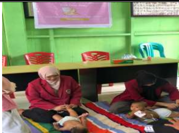
Gambar 2. Pelaksanaan Massage Baby Di Desa Padang