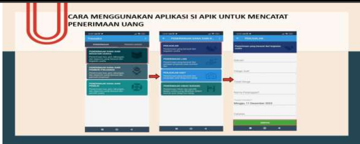
Gambar 6. Gambar Alur pencatatan laporan pemasukan

Pada bagian ini peserta kegiatan dituntun untuk mengklik bagian penerimaan dan memilih penerimaan jenis apa yang didapati, setelah itu akan diarahkan untuk melengkapi semua informasi terkait jenis penerimaan tersebut. Setelah selesai klik simpan dan secara otomatis akan tercatat dalam aplikasi.