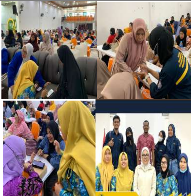
Gambar 8. Pendampingan penggunaan Aplikasi Si Apik dalam Menyusun laporan keuangan