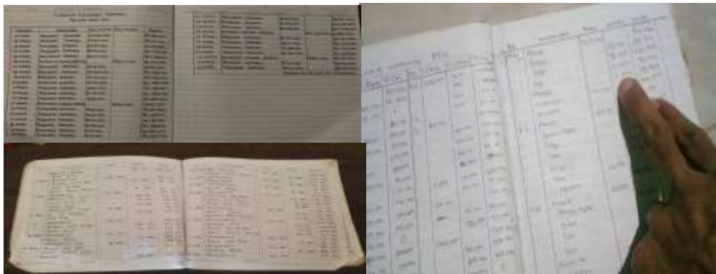
Gambar 1. Laporan Keuangan peserta UMKM yang disusun masih manual