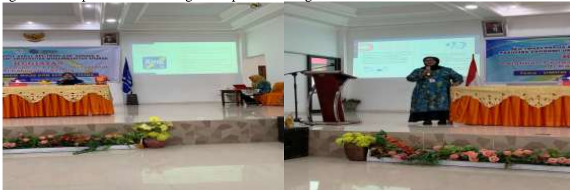
Gambar 3. Pemaparan penjelasan mengenai Laporan Keuangan dan Aplikasi Keuangan Si Apik

Kegiatan ini bertujuan untuk memberikan pemahaman terkait pengertian dan manfaat laporan keuangan, Pentingnya Penyusunan Laporan Keuangan yang baik dan benar, dan peran Aplikasi penyusunan laporan keuangan. Dengan demikian diharapkan para peserta secara intens telah mendapatkan pemahaman yang mendasar dalam Menyusun laporan keuangan yang baik dan benar menggunakan aplikasi keuangan si Apik. Dalam kegiatan ini seluruh peserta diarahkan dan dituntun untuk mendownload Aplikasi keuangan Si Apik.