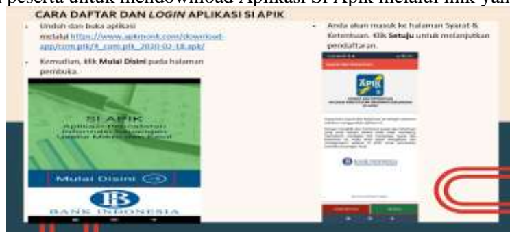
Gambar 4. Tampilan Aplikasi keuangan SiApik dan link untuk mendownload