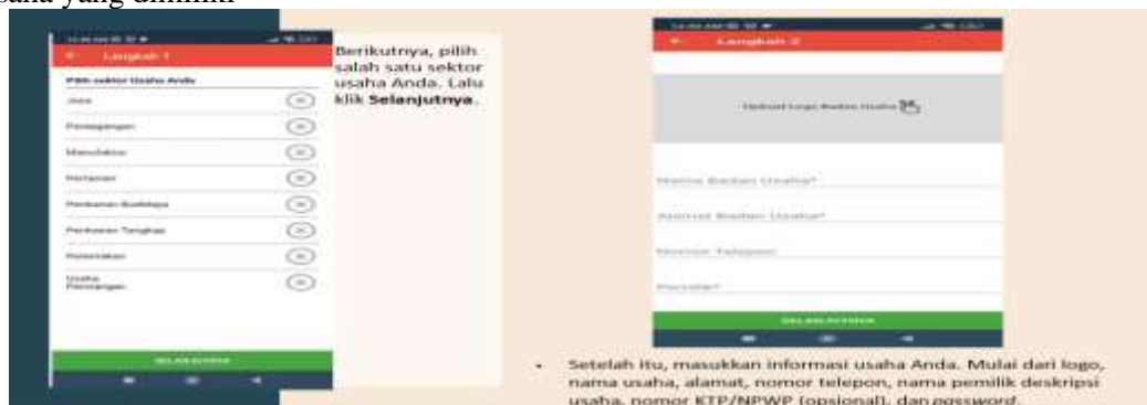
Gambar 5. Gambar tampilan sektor jenis usaha dan informasi yang harus dilengkapi

Pada bagian ini peserta harus mengisi sektor usaha yang dimiliki, Mulai dari logo, nama usaha, alamat, nomor telepon, nama pemilik deskripsi usaha, nomor KTP/NPWP (opsional), dan password .