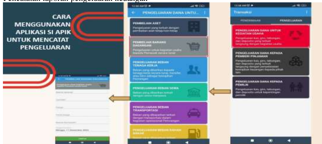
Gambar 7. Gambar Alur pencatatan laporan pengeluaran

Pada bagian ini peserta kegiatan dituntun untuk mengklik bagian pengeluaran dan memilih jenis pengeluaran apa yang telah dilakukan, setelah itu akan diarahkan untuk melengkapi semua informasi terkait jenis pengeluaran tersebut. Setelah selesai klik simpan dan secara otomatis akan tercatat dalam aplikasi.