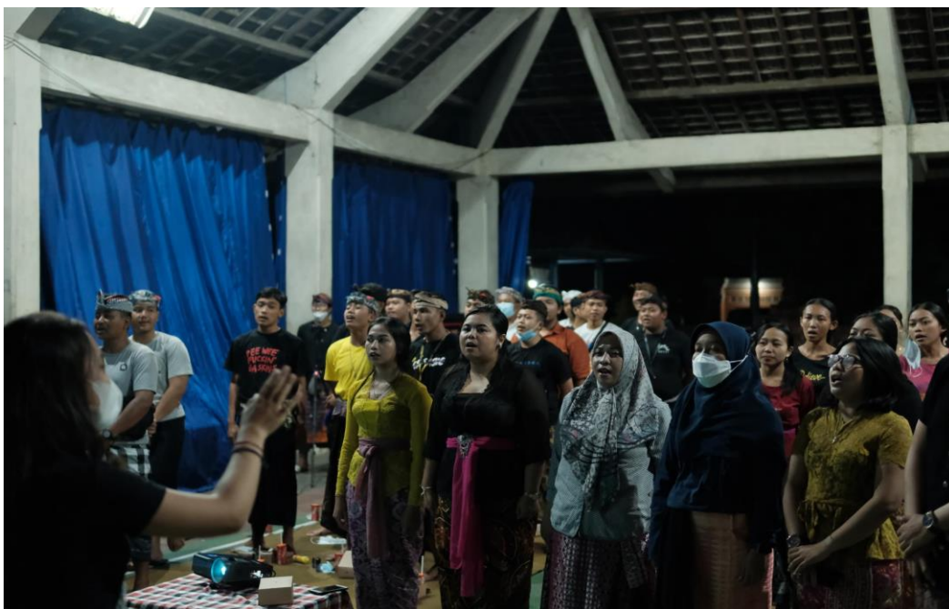
Gambar 2. Pembukaan Kegiatan Pengabdian Masyarakat

Kegiatan pengabdian masyarakat di Desa Adat Tulikup, Gianyar berlangsung pada hari Minggu, 15 November 2022. Kegiatan ini dimulai dari tahap perencanaan yang menghasilkan Term of Reference (ToR) yang kemudian menjelaskan waktu dan tempat pelaksanaan kegiatan, narasumber serta peserta dari kegiatan.