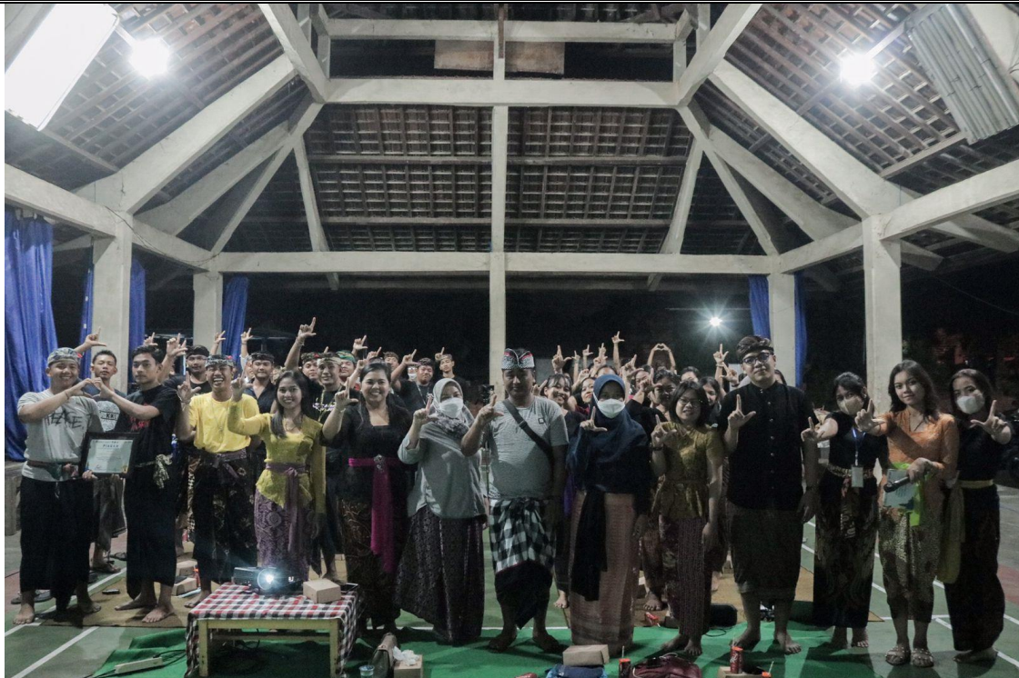
Gambar 3. Peserta Kegiatan Pengabdian

Hasil lainnya dari kegiatan ini adalah diperoleh evaluasi dari tingkat pemahaman peserta kegiatan setelah dilakukan edukasi. Berdasarkan kegiatan evaluasi didapatkan hasil pengukuran sebelum dan setelah edukasi seperti ditunjukkan pada tabel dibawah ini: