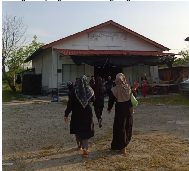
Gambar 1. Lokasi Sanggar Bimbingan Kuala Langat

Di Sanggar Bimbingan Kuala Langat memiliki kendala seperti adanya beberapa jadwal yang harus diubah, yakni pembelajaran tentang Pancasila yang seharusnya dilakukan terlebih dahulu tetapi harus diubah menjadi pagi karena adanya kendala. Selain itu, sistem sekolah tidak memberikan informasi mengenai kehadiran murid, sehingga pada saat melakukan kegiatan mempraktikkan modul P5 mengenai pemilihan umum, ada seorang siswa yang berhalangan hadir namun tidak ada informasi izin yang diberikan kepada mahasiswa-mahasiswa pengabdian yang ada di Sanggar Bimbingan Kuala Langat. Lalu adanya bentrok jadwal dengan program kerja yang dilakukan oleh mahasiswa-mahasiswa KKN dari kampus lain, yang dimana pada saat ingin melakukan kegiatan pembelajaran yang sesuai dengan rundown harus tertunda, karena adanya jadwal latihan menari dan membaca puisi murid-murid untuk diadakannya perpisahan dengan mahasiswa-mahasiswa dari kampus lain tersebut, sehingga jadwal pembelajaran yang telah disusun sebelumnya. Dengan demikian, para mahasiswa harus beradaptasi dengan hambatan-hambatan tersebut dan mencari solusi yang efektif untuk mengatasi masalah tersebut dan memastikan keberhasilan kegiatan pengabdian, dengan berkomunikasi dengan pihak-pihak terkait, seperti guru-guru yang ada di Sanggar Bimbingan untuk mendapatkan bantuan dan dukungan yang diperlukan. Selain itu, para mahasiswa juga harus bersikap fleksibel dan dapat beradaptasi dengan perubahan yang terjadi selama kegiatan pengabdian berlangsung.