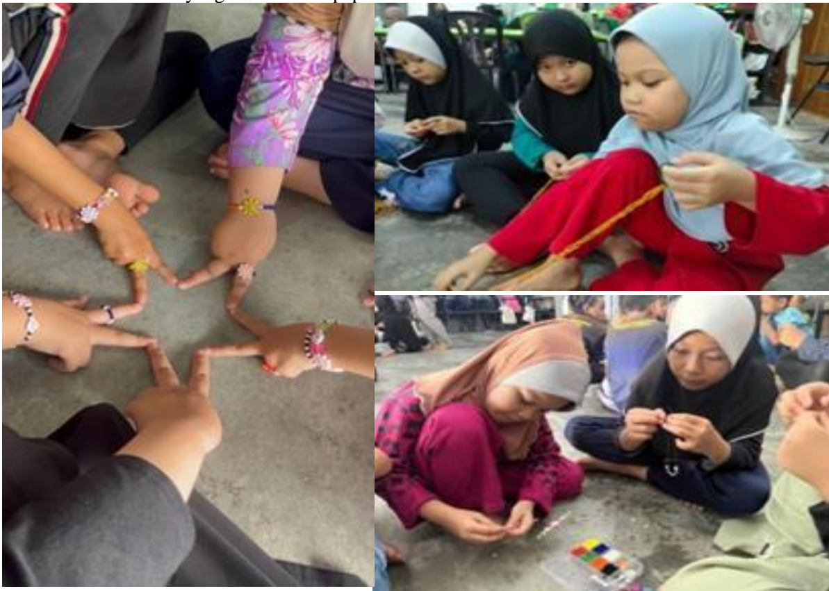
Gambar 7. Program Happy

Terlihat dalam gambar 6, para siswa-siswi juga diselingi dengan mata pelajaran umum yang terjadwal di jadwal pembelajaran Sanggar Bimbingan Kuala Langat, yang meliputi pelajaran IPA, Bahasa Indonesia dan Matematika. Pada pembelajaran ini tim pengabdian berbagi tugas untuk menjadi pengajar di masing-masing kelas mulai dari kelas 1 hingga 6. Tim pengabdian mencoba mempelajari mata pelajaran yang akan dijelaskan kepada siswa-siswi di setiap kelasnya, agar dapat dipahami dengan mudah oleh para siswa-siswi. Hasil dari pembelajaran ini adalah para siswa-siswi dapat memahami dengan mudah apa dijelaskan oleh pengajar dan bisa mengerjakan soal yang diberikan oleh pengajar. Pada pelajaran Bahasa Indonesia, para siswa-siswi menunjukkan kemampuan mereka dengan baik dalam membaca dan menulis kalimat yang benar. Dalam pelajaran Matematika, mereka menunjukkan kemampuan mereka dalam mengerjakan soal perkalian dan pertambahan yang diberikan pengajar, dan pada pelajaran IPA, mereka dapat mengidentifikasi dengan benar bagaimana konsep dasar ilmiah dan diterapkan dalam kehidupan sehari-hari. Dengan ini siswa-siswi menunjukkan peningkatan dalam menulis dan membaca, terkhusus siswa-siswi di kelas 1 dan 2. Dalam pembelajaran ini ada beberapa siswa-siswi kelas 1 dan 2 sudah ada yang mulai terbiasa dan bisa menulis dan membaca melalui tulisan yang diberikan di papan tulis.