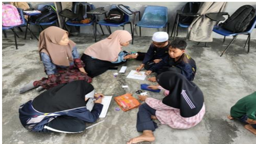
Gambar 3. Mengerjakan Tugas P5 Bersama Siswa-Siswi Sanggar Bimbingan Kuala Langat