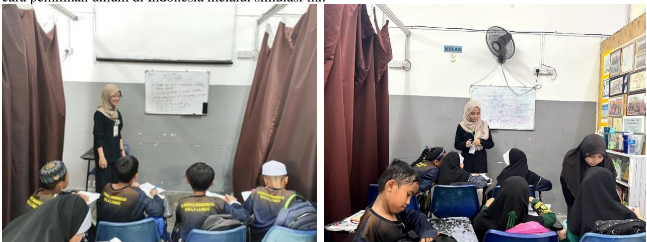
Gambar 6. Pembelajaran Mata Pelajaran Umum