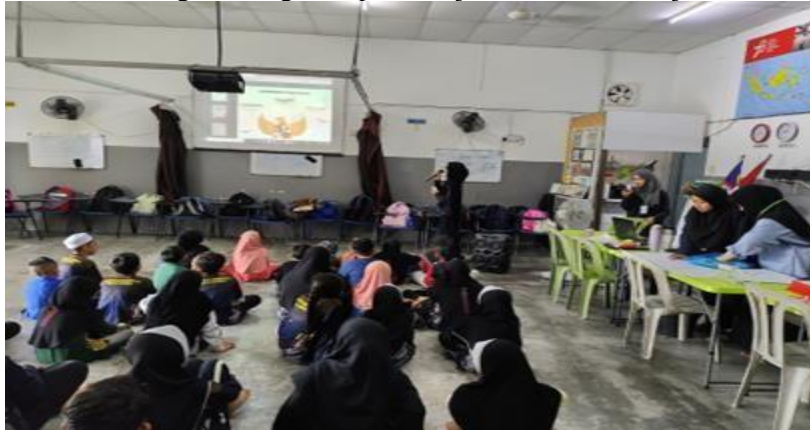
Gambar 2. Penjelasan Mengenai P5

pembelajaran kelas dalam suasana yang kondusif dan menyenangkan, para siswa-siswi digabung menjadi satu agar dapat memperhatikan dan mengikuti kegiatan pembelajaran bersama (Anjar et al., 2024).