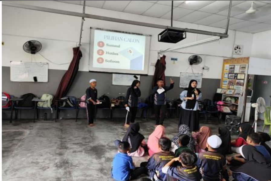
Gambar 5. Simulasi Pemilihan Ketua Kelas (PEMILAS)