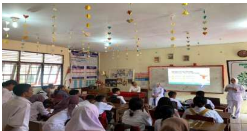
Gambar 2. Penyuluhan Kesehatan Mental Pada Remaja di SMP Pertiwi

Hasil efektivitas perhitungan sebesar 96,15%, yang dihitung berdasarkan pre-test dan post-test pada peserta sosialisasi, yaitu murid SMP, menunjukkan bahwa program sosialisasi ini sangat efektif. Angka ini mencerminkan keberhasilan program dalam meningkatkan pengetahuan, sikap, atau perilaku murid secara signifikan. Tingginya selisih antara pre-test dan post-test menandakan bahwa sosialisasi materi berhasil dilaksanakan dengan baik, serta mampu mendorong perubahan yang diharapkan pada peserta. Siswa SMP, sebagai sasaran sosialisasi, berada pada tahap perkembangan usia yang mudah menerima pengaruh, sehingga pendekatan yang relevan, menarik, dan sesuai dengan karakteristik mereka memberikan dampak yang besar. Keberhasilan ini juga menunjukkan bahwa metode dan media penyampaian materi telah dirancang secara tepat, serta didukung oleh fasilitator yang efektif. Secara keseluruhan, hasil ini menunjukkan bahwa program sosialisasi berhasil mencapai tujuan dengan sangat baik, menghasilkan perubahan yang nyata dan signifikan pada peserta.