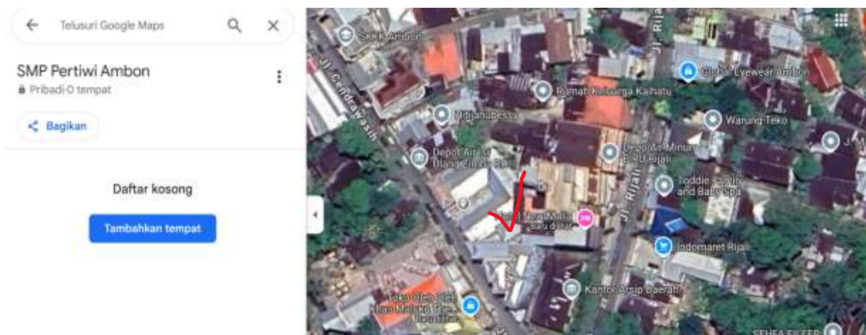
Gambar 3. Lokasi SMP Pertiwi Ambon (Google Maps)