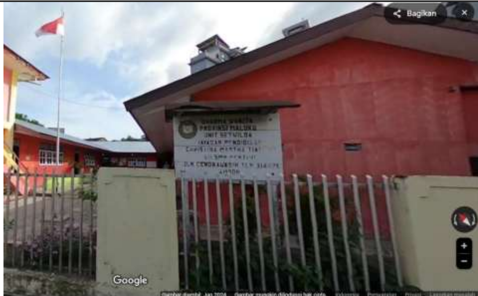
Gambar 2. Tampak Depan SMP Pertiwi Ambon