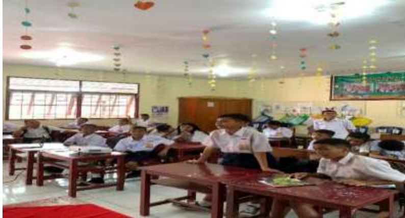
Gambar 3. kegiatan metode tanya jawab