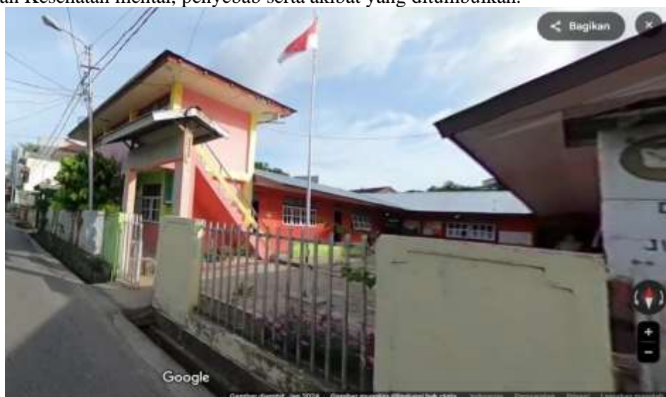
Gambar 1: Tampak Samping SMP Pertiwi Ambon

Permasalahan yang ada pada SMP Pertiwi seperti yang telah disebutkan, berpotensi meningkatkan kasus yang diakibatkan oleh gangguan kesehatan mental dikalangan siswa, oleh karena itu maka kegiatan sosialisasi ini merupakan hal paling mendesak untuk dilakukan, dalam upaya meningkatkan pengetahuan siswa tentang apa itu Gangguan Kesehatan mental, penyebab serta akibat yang ditimbulkan.