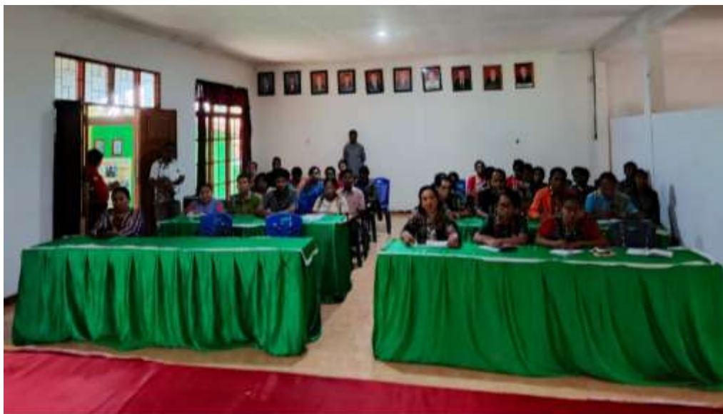
Gambar 1. Peserta Workshop