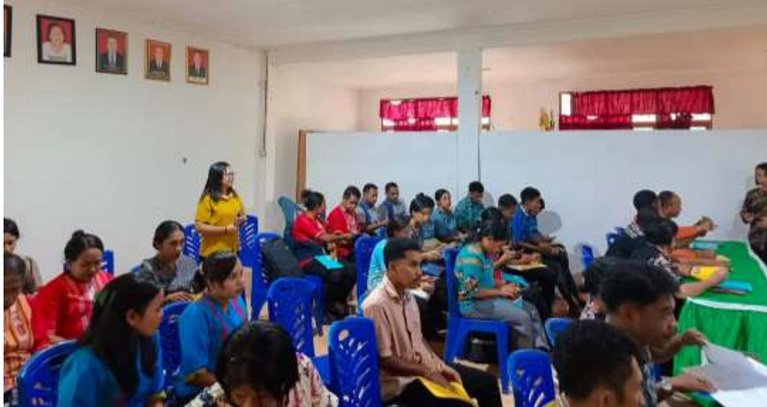
Gambar 3. Latihan Konversi Laporan PTK menjadi Draft Artikel

Peserta juga dibekali dengan pemahaman memilih jurnal target atau jurnal tujuan publikasi untuk PTK. Langkah ini dimulai dengan memastikan kesesuaian antara fokus penelitian dan ruang lingkup jurnal. Oleh karena itu, jurnal yang dipilih harus memiliki fokus pada topik-topik pendidikan, pembelajaran, atau inovasi dalam pendidikan. Peserta perlu memilih jurnal yang secara eksplisit menerima artikel yang berkaitan dengan praktik pembelajaran, metodologi pendidikan, dan peningkatan kualitas pengajaran, karena tidak semua jurnal pendidikan mencakup topik PTK. Membaca pedoman untuk penulis dan artikel yang telah dipublikasikan sebelumnya di jurnal tersebut dapat membantu memastikan kecocokan ini.