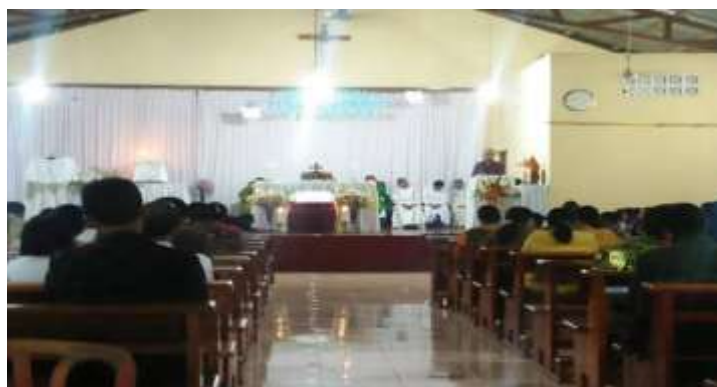
Gambar 2. Kapela Organisasi