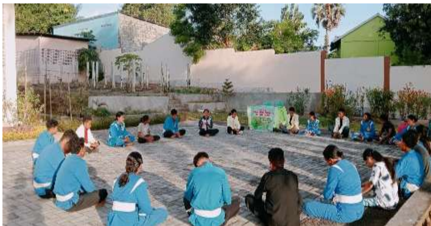
Gambar 3. Pemaparan Materi

Pendidikan karakter para anggota komunitas sangat memprihatinkan. Hal ini menjadi salah satu masalah yang telah diuraikan di atas. Pendidikan karakter yang buruk ini menjadi sebuah kenyataan negatif dan berdampak pada kehidupan secara kompleks. Aspek ini menjadi focus penting yang diperahatkan oleh tim PkM. Aspek menjadi salah satu aspek yang perlu diperhatikan secara serius dalam rangka memperbaiki kehidupan individu dalam kehidupan berorganisasi secara khusus dan kehidupan sosial secara umum. Sosialisasi yang dilakukan memuat materi-materi penting berkaitan dengan pengembangan karakter melalui pendidikan karakter yang terfokus dan berkelanjutan. Materi yang dipaparkan disampaikan dengan baik dan menekankan perubahan yang konkret berkaitan dengan pendidikan karakter bagi para anggota komunitas. Pada tahap ini ditemukan bahwa pemahaman berkaitan dengan pendidikan karakter dari para anggota sangatlah minim. Pendidikan karakter seperti sebuah hal rumit untuk dipraktekan dan ditanamkan dalam kehidupan sehari-hari.