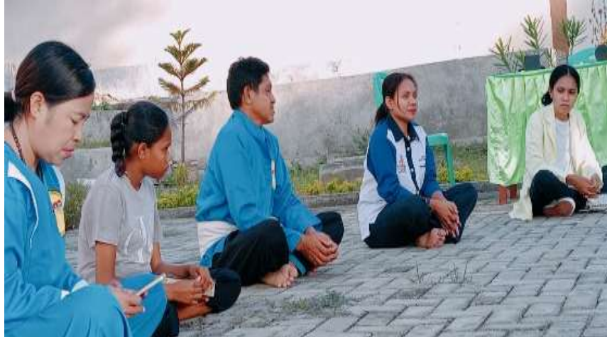
Gambar 4. Sharing Pengalaman Iman

Pada hasil lainnya, diketahui bahwa organisasi Tunggul Hati Seminari dan Tunggul Hati Maria merupakan salah satu organisasi yang berlandaskan semangat missionaris Kristus. Dinamika kehidupan secara umum mau pun khusus dari organisasi ini mengikuti teladan Kristus. Organisasi ini menjadi salah satu organisasi kerohanian yang terdapat dalam Gereja Katolik. Basis spiritualitas organisasi ini menuntut sebuah kedewasaan iman dan kematangan sikap yang dicerminkan dalam kehidupan sehari-hari. Pada kegiatan ini, sharing menjadi salah satu metode. Metode ini memungkinkan setiap anggota organisasi untuk berbagi pengalaman imannya yang konkret. Pengalaman-pengalaman konkret yang dibagikan ini menjadi kekayaan baru dalam memperbaiki karakter dari setiap anggota komunitas.