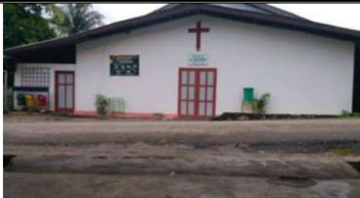
Gambar 1. Lokasi kegiatan berlangsung.