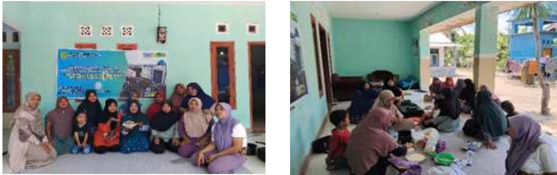
Gambar 2. Peserta kegiatan pelatihan

Kegiatan selama pelatihan pembuatan aneka olahan pisang di di dusun Bangket bawaq dapat dilihat pada Gambar 1 dan 2.