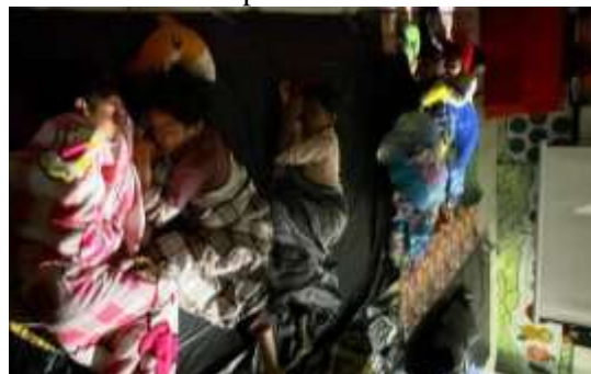
Gambar 6. Kegiatan tidur cepat waktu

Anak-anak setelah beraktivitas harus tidur cepat waktu