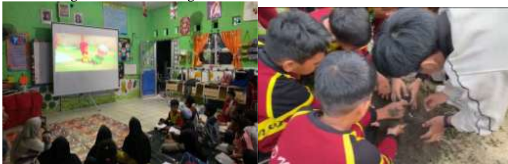
Gambar 5. Kegiatan menonton film dan belajar penyemaian bibit cabai

Anak-anak berkegiatan di dalam ruangan kelas untuk menonton sebuah film