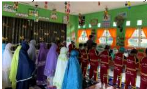
Gambar 3. Kegiatan sholat berjamaah

Hasil dari kegiatan ini setiap anak wajib untuk menunaikan sholat wajib sebagai seorang muslim