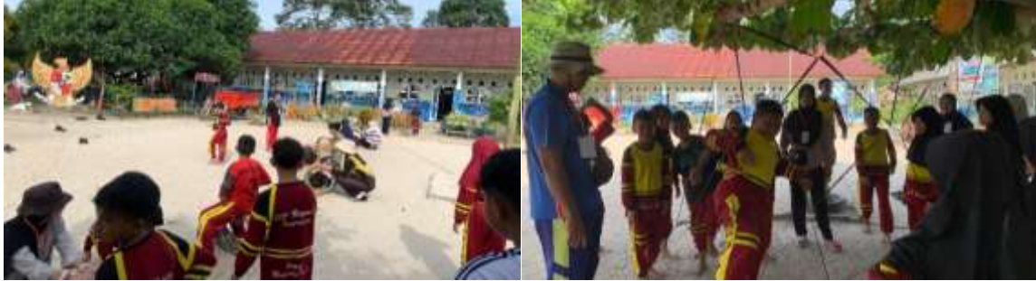
Gambar 9. Kegiatan outbound