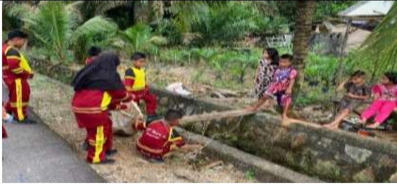
Gambar 4. Kegiatan hiking dan gotong royong