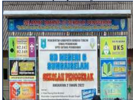
Gambar 1. SD Negeri 6 Sungaiselan Sekolah Penggerak

SD Negeri 6 Sungaiselan merupakan sekolah penggerak yang dimana, program sekolah penggerak merupakan upaya untuk mewujudkan visi Pendidikan Indonesia dalam mewujudkan Indonesia maju yang berdaulat, mandiri, dan berkepribadian melalui terciptanya Pelajar Pancasila (Sakdiyah et al., 2023).