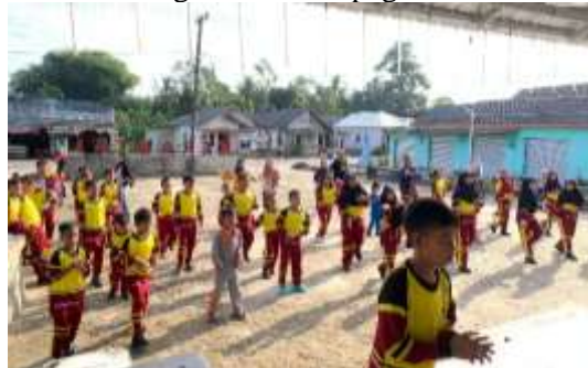
Gambar 8. Senam Anak Indonesia Hebat

Selanjutnya peserta didik melakukan kegiatan senam pagi