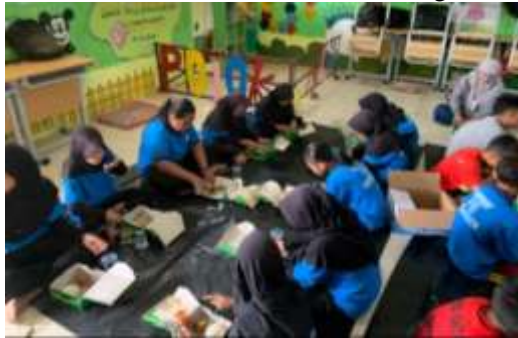
Gambar 7. Makan bersama dengan makanan bergizi

Bangun pagi diawali dengan beribadah dan makan-makanan bergizi