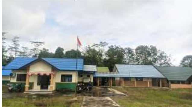
Gambar 1. Lokasi SPNF Sejenis SKB Kabupetn Pulang Pisau

SKB Sejenis SPNF Di bawah arahan Dinas Pendidikan setempat, Pemerintah Daerah membawahi Kabupaten Pulang Pisau, sebuah lembaga pendidikan nonformal. Lembaga ini dibentuk untuk memenuhi kebutuhan pendidikan masyarakat, khususnya bagi mereka yang tidak dapat mengenyam pendidikan formal seperti sekolah dasar, menengah pertama, atau atas. Program dan layanan SPNF Sejenis SKB diakui secara resmi karena memiliki status negara dan setara dengan sekolah formal. Tujuan utama SPNF Sejenis SKB adalah memberikan kesempatan belajar kepada masyarakat terutama yang kurang mampu untuk meningkatkan sikap mental, kemampuan, dan pengetahuan mereka. Melalui pembelajaran yang sesuai dengan kemajuan ilmu pengetahuan dan teknologi, masyarakat dapat meningkatkan penghasilannya serta meningkatkan potensi, bakat, dan kemandiriannya dalam memenuhi kebutuhan dasarnya.