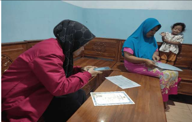
Gambar 3. Pengumpulan Bekas untuk di serahkan kepada DIKNAS Kabupaten Jombang

Hasil pelaksanaan pentingnya Pendidikan juga diperkuat dari Aliyyah dkk. (2021) juga memberikan peningkatan pendampingan kepada masyarakat secara signifikan terhadap usia-usia tertentu (PAUD, SD, SMP) serta usia lainnya agar pemahaman tugas perkembangan bisa sesuai dan hidup secara mandiri. Itupun juga memperkuat hasil Hillaya dkk. (2025) pendidikan formal dan non formal dipentingkan juga sesuai faktor-faktor dalam kegiatan pelatihan dan peningkatan keterampilan UMKM menunjukkan adanya peningkatan kesadaran dan kemampuan dalam mengelola usaha secara lebih efektif.