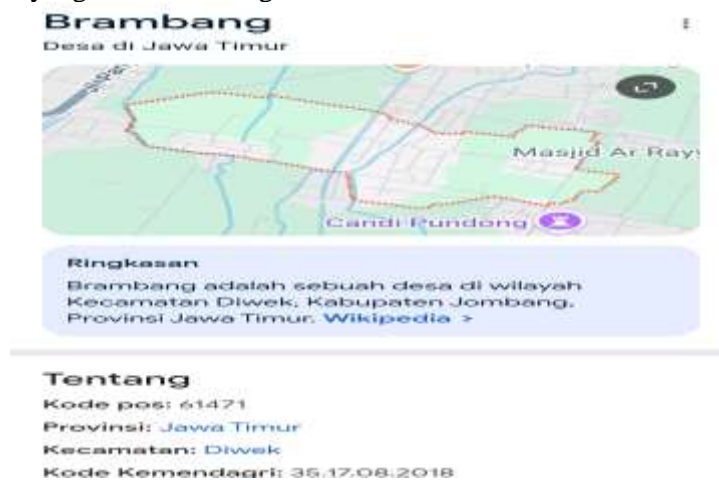
Gambar 1. Lokasi Pengabdian Masyarakat

Jika kondisi ini terus dibiarkan, generasi muda di Desa Brambang akan kesulitan bersaing dalam dunia kerja dan berisiko terjebak dalam lingkaran kemiskinan yang berulang. Oleh karena itu, diperlukan upaya nyata dalam bentuk sosialisasi dan pendampingan agar masyarakat semakin memahami bahwa pendidikan bukan hanya sekadar kebutuhan, tetapi juga kunci utama untuk meningkatkan kualitas hidup dan menciptakan masa depan yang lebih cerah bagi desa mereka.