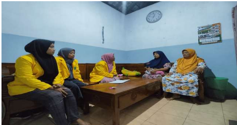
Gambar 3. Sosialisasi dan pendampingan anggota KKM kepada masyarakat tentang Pendidikan

Kegiatan Sosialisasi dan pendampingan pentingnya pendidikan dilaksanakan bulan februari 2025 yang dilaksanakan oleh anggota KKM dengan mendatangi satu per satu rumah anak-anak yang putus sekolah dan kami memfasilitasi program Pendidikan kesetaraan dengan bekerja sama dengan DIKNAS Kabupaten Jombang yang akan di mulai bulan juli.