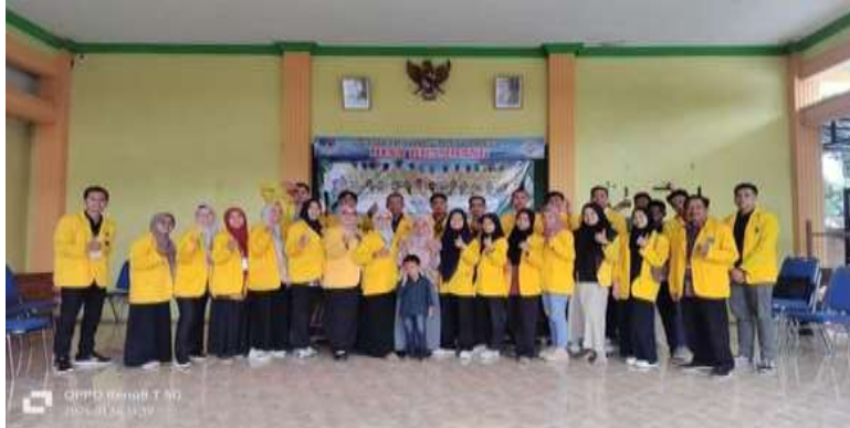
Gambar 2. Mahasiswa KKM, beserta dosen Pembimbing, di balai desa, Desa Brambang, Kecamatan Diwek Kabupaten Jombang

Program KKM ini berlangsung selama satu bulan, dimulai dari 1 Februari 2025 hingga 28 Februari 2025, dan tempat pelaksanaan ini berada di Desa Brambang, Kecamatan Diwek, Kabupaten Jombang, Provinsi Jawa Timur. Program ini mencakup partisipasi 29 mahasiswa, yang terdiri dari 15 laki-laki dan 14 perempuan, serta didampingi oleh satu dosen pembimbing lapangan. Untuk memperoleh data, digunakan metode pengamatan, observasi, dan wawancara langsung dengan masyarakat, serta analisis terhadap kondisi lingkungan dan aspek lain di desa tersebut. Pengambilan data melakukan focus group discussion yang mana diambil dari data primer dari kasus-kasus putus sekolah dari pihak perangkat desa Brambang Kecamatan Diwek Kabupaten Jombang serta pengambilan sosialisasi dari data keluarga yang posisi kurang mampu (kategori perekomenian rendah) dan hasil analisis dilakukan dengan triangulasi data dan sumber dan feedback bantuan yang sesuai dengan pendampingan masyarakat seperti pengambilan pengajuan paket C.