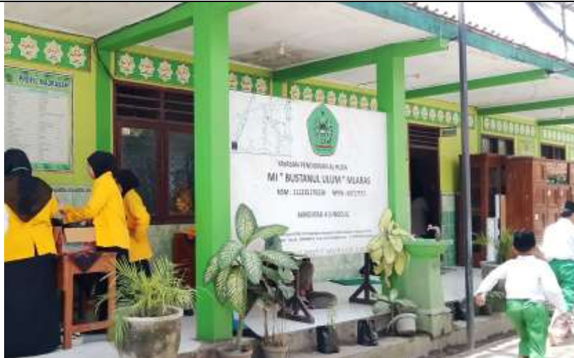
Gambar 1. Lokasi PkM