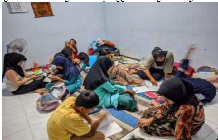
Gambar 4. Bimbingan belajar di basecamp KKM