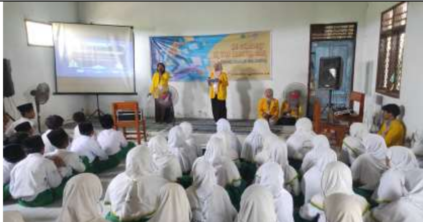
Gambar 2. edukasi digitalisasi