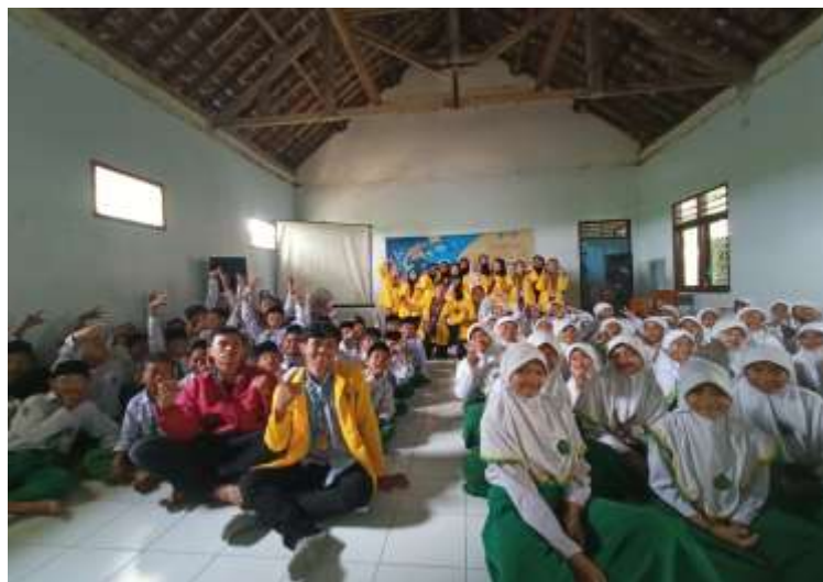
Gambar 3. Foto bersama setelah edukasi