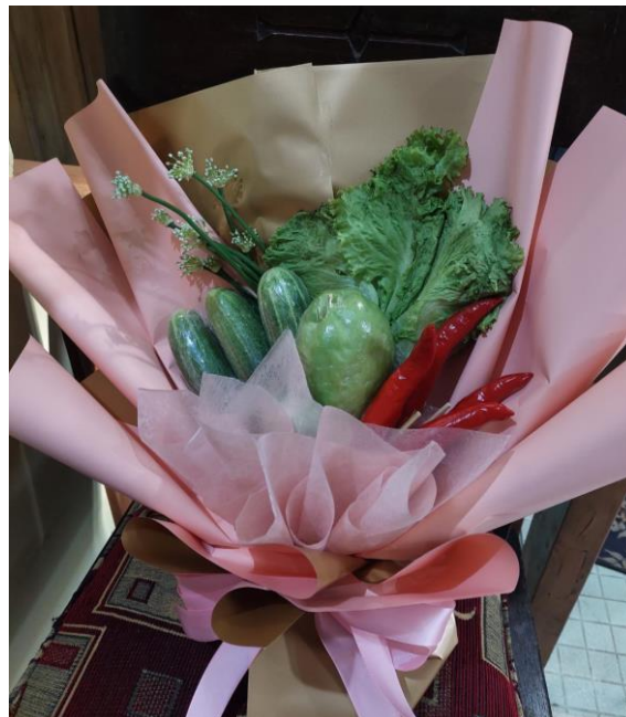
Gambar 15. Contoh buket sayur lainnya yang dibuat dengan kertas cellophane berwarna lain.