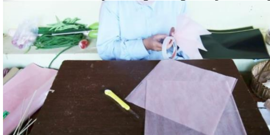
Gambar 7. Melipat dan memotong kertas tisu

Pertama-tama siapkan kertas tisu berwarna pink digunting menjadi 4 bagian.