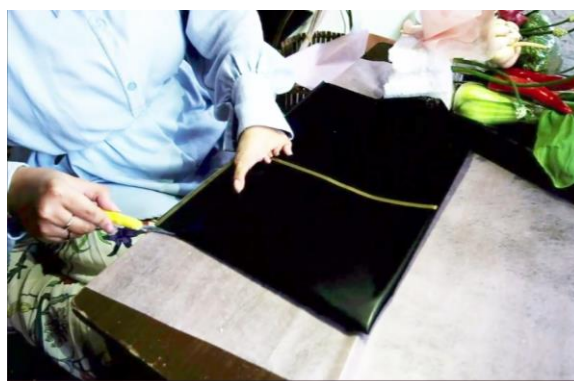
Gambar 9. Memotong kertas Cellophane

Langkah selanjutnya adalah menyiapkan kertas Chellophone berwarna hitam sebanyak 5 lembar kemudian potong menjadi dua bagian berukuran besar dan kecil. Lalu ambil kertas yang berukuran besar sebanyak 2 lembar, kemudian satukan dengan selotip lalu lipat bagian pojok bawah kiri dan kanan pada kertas yang sudah disatukan. Setelah itu rekatkan kepada rangkaian buket dengan selotip pada bagian belakang.