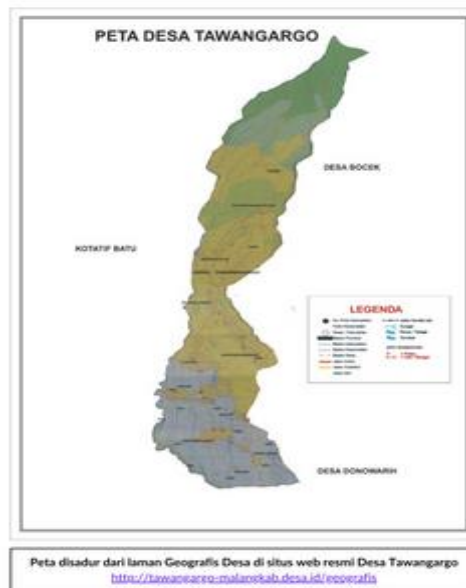
Gamabr 1. Peta Desa Tawangargo wilayah Kecamatan Karang Ploso, Kabupaten Malang

Menghadapi perkembangan desa tematik di masa kini desa memerlukan tatanan dan inovasi desain yang menarik untuk dinaikkan ke tingkat nasional maupun luar negeri. Perkembangan digital di masa kini turut juga berperan untuk mempercepat citra desa di wilayah tanpa batas. Sehingga upaya dalam mewujudkan cita-cita tersebut, desa tentu membutuhkan desain utama yang mampu membuat citra desa Tawangargo sebagai desa wisata. Sarana pendukung dapat berupa sarana fisik maupun non fisik. Sarana non fisik yang paling dibutuhkan dalam upaya pengembangan potensi wisata tersebut berupa promosi wisata yang ruang lingkupnya luas. Dalam upaya mencari identitas yang mampu menjadi citra desa Tawangargo, tim Pengabdian masyarakat FIB-UB mewujudkannya melalui buket dan parcel tema Sayuran akan menjadi awal dari ide-ide konsep penguatan pariwisata kedepan nantinya. Didasarkan hal ini, dapat dirumuskan masalah, yaitu (a) bagaimana membuat parcel dan buket sayur nantinya dijadikan sebagai citra desa ? dan (b) Bagaimana proses teknis pelaksanaan pembuatan buket dan parcel sayur yang bisa membangun citra Desa Tawangargo?