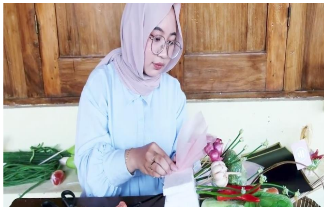
Gambar 8. Menempelkan kertas tisu pada buket

Setelah dipotong ambil titik tengah dari kertas tisu kemudian tarik hingga mengerucut dan berikan isolatif agar Bertahan dengan posisi bentuk tersebut. Jika sudah tempelkan kertas tisu pada bagian depan rangka yang buket menggunakan lem tembak dan isolatif agar lebih kuat. Tempel sebanyak kertas tisu yang sudah dipotong.