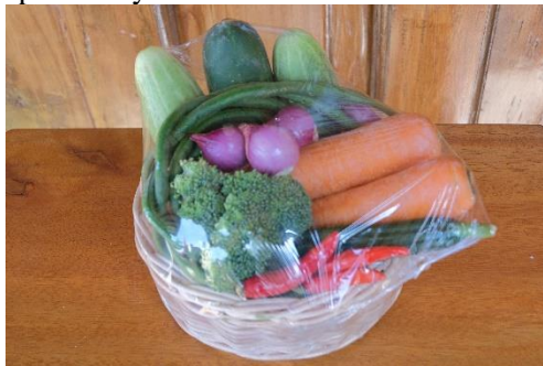
Gambar 16. Parcel sayur yang sudah jadi