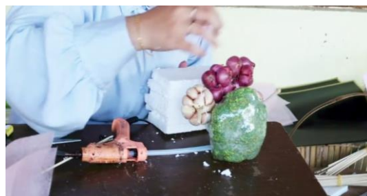
Gambar 6. Menata sayur pada styrofoam