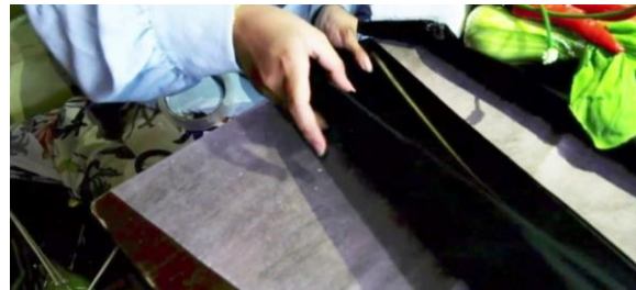
Gambar 11. Merekatkan lipatan kertas