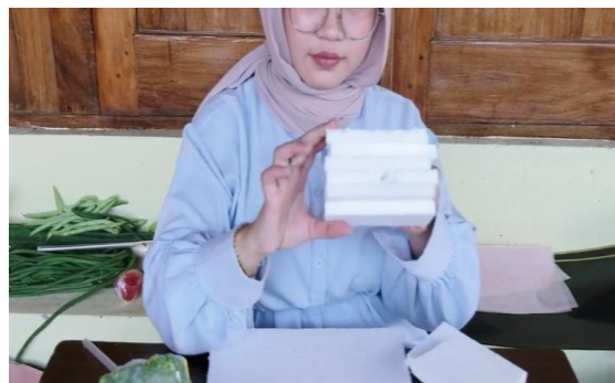
Gambar 5. Menyusun Styrofoam untuk dasar buket sayur