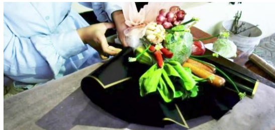
Gambar 12. Proses layer kedua

Untuk layer ketiga ambil satu lembar kertas chellophone kemudian potong menjadi dua dengan sama ukurannya dan lakukan seperti layer kedua. Selanjutnya lakukan hal yang sama seperti layer 2 dan 3 hingga sampai ke layer ke-6.