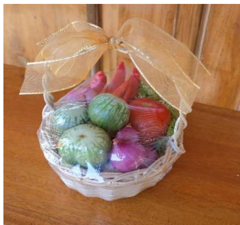
Gambar 17. Contoh lain parcel sayur

Parsel sayur tersebut di atas tidak hanya bisa menjadi hadiah kepada orang lain tapi juga bisa dijadikan souvenir pada acara-acara tertentu misalnya hajatan. Parcel sayur bisa dijual seharga 50. 000 sampai dengan 150.000 Rupiah tergantung jenis sayuran, besar parsel dan kreativitas parsel (Info harga menurut pasaran di Tokopedia).