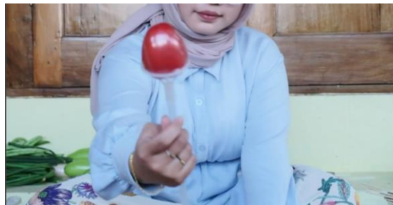
Gambar 4. Pemasangan tusuk balon pada sayuran

Agar memudahkan proses penyusunan sayuran pada buket, sayuran yang sudah dibungkus dengan plastic wrap kemudian ditancapkan ke tusuk sate dan tusuk balon sesuai dengan berat dan ukuran dari sayuran tersebut. Kemudian direkatkan lagi dengan menggunakan lem tembak. Setelah itu siapkan Styrofoam dengan ketebalan 1 cm, ukuran 10 cm x 20 cm yang disusun sebanyak 6 lapis. Susunan Styrofoam ini direkatkan lagi dengan selotip dan lem. Setelah itu sayuran yang sudah dipasang tusuk sate kemudian ditancapkan ke susunan Styrofoam ini dan ditata sedemikian rupa tergantung kreatifitas masing-masing.