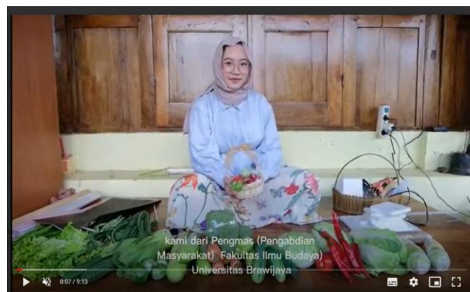
Gambar 2. Penjelasan sayur yang digunakan