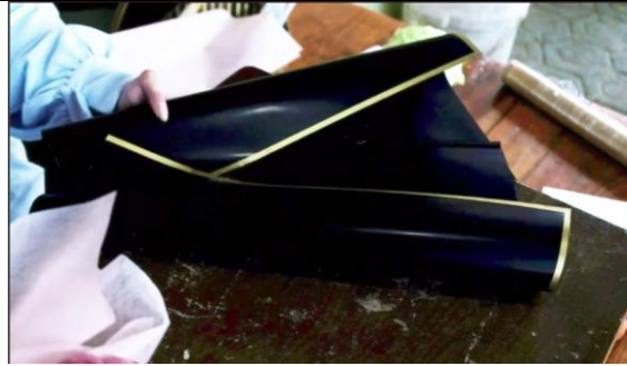
Gambar 10. Melipat kertas Cellophone