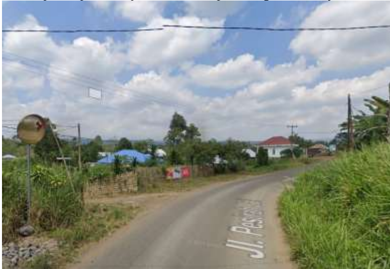
Gambar 1. Lokasi Pembangunan Gapura

inisiatif untuk membangun gapura yang tidak hanya berfungsi sebagai identitas kelurahan, tetapi juga sebagai sarana memperkuat partisipasi masyarakat dalam pembangunan wilayah.