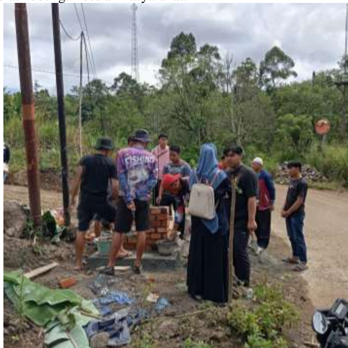
Gambar 3. Proses Pembuatan Gapura Bersama Masyarakat dan Karang Taruna

Untuk memperkuat konstruksi, pondasi gapura dibuat menggunakan batu koral, dengan dinding dari bata, semen, dan pasir. Batu koral yang dipakai untuk pembuatan gapura di dapat dari bantuan masyarakat. Struktur utama gapuradiperkuat dengan besi sengkang atau besi behel untuk menopang bangunan secara seimbang. (Alamsyah et al., 2022) menyatakan infrastruktur yang dibangun diharapkan tidak hanya memberikan manfaat jangka panjang bagi warga, tetapi juga memperluas cakupan manfaat secara berkelanjutan. Keberadaan infrastruktur desa yang dibangun secara partisipatif mampu meningkatkan rasa memiliki serta mempererat hubungan sosial masyarakat.