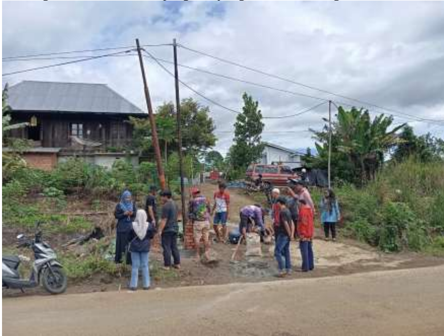
Gambar 4. Kunjungan Tim Supervisi KKN IAIP

2025) menyatakan bahwa partisipasi masyarakat yang rendah dalam kegiatan gotong royong dan pembangunan desa menghambat efektivitas program yang telah dirancang.