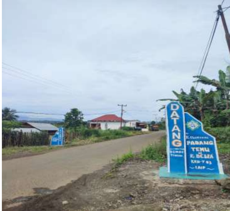
Gambar 5. Gapura Kelurahan Padang Temu

Dari sudut pandang ekonomi, keberadaan gapura juga dapat memberikan dampak positif bagi perkembangan desa dalam jangka panjang. Dengan adanya tanda pengenal yang jelas, Kelurahan Padang Temu menjadi lebih mudah dikenali oleh pendatang yang melintasi daerah tersebut. Hal ini sesuai dengan temuan (Rahman, 2020) yang menyatakan bahwa identitas visual suatu daerah, seperti gapura, dapat meningkatkan daya tarik wisata serta mendukung pertumbuhan ekonomi lokal. Oleh karena itu, pembangunan gapura ini diharapkan tidak hanya menjadi elemen infrastruktur, tetapi juga berkontribusi terhadap pengembangan potensi ekonomi desa.