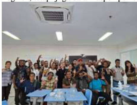
Gambar 2. Dokumentasi setelah pelatihan terselenggara

Salah satu tantangan yang dihadapi selama pelatihan adalah kurangnya pengalaman peserta dalam menggunakan peralatan laboratorium. Beberapa peserta bahkan mengungkapkan bahwa ini adalah kali pertama mereka memegang alat seperti pipet tetes atau gelas ukur. Hal ini menunjukkan adanya kesenjangan fasilitas pendidikan antara daerah asal peserta dan daerah lain yang lebih berkembang. Penelitian oleh Kurniawan et al. (2022) menyebutkan bahwa mahasiswa dari daerah 3T cenderung memiliki keterbatasan dalam akses pendidikan sains yang layak, sehingga perlu diberikan penguatan melalui pelatihan intensif berbasis praktik. Namun demikian, tantangan tersebut justru menjadi peluang dalam pelatihan ini untuk memperkenalkan peserta pada dunia laboratorium secara komprehensif. Dengan pendekatan pelatihan yang terstruktur dan bimbingan langsung dari fasilitator, peserta menunjukkan kemampuan adaptasi yang cepat. Dalam beberapa sesi terakhir, mereka mulai menunjukkan kepercayaan diri yang lebih besar dalam mengoperasikan alat dan mengikuti prosedur keselamatan kerja. Progres ini menjadi indikator keberhasilan pelatihan tidak hanya dalam aspek kognitif, tetapi juga dalam aspek psikomotorik dan afektif.