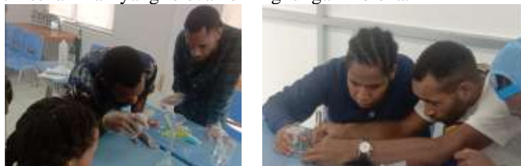
Gambar 1. Dokumentasi praktik pembuatan hand sanitizer

mudah dipahami. Peserta juga menyampaikan bahwa pelatihan ini menyenangkan dan membuka wawasan mereka terhadap penerapan ilmu kimia dalam kehidupan sehari-hari. Temuan ini sejalan dengan penelitian oleh Lestari dan Pahriyani (2020), yang menekankan bahwa metode pelatihan partisipatif yang dilengkapi praktik langsung lebih efektif dalam meningkatkan pemahaman dan keterlibatan peserta dari latar belakang pendidikan terbatas. Grafik evaluasi pelatihan menunjukkan bahwa aspek dengan capaian tertinggi adalah kepuasan peserta terhadap metode pelatihan (92%), diikuti oleh kemampuan kerja sama dan komunikasi (90%), serta pemahaman teori dasar kimia (90%). Sementara itu, aspek penggunaan alat ukur menunjukkan capaian terendah yaitu 75%, menandakan perlunya pelatihan tambahan atau penguatan keterampilan laboratorium dasar pada kegiatan lanjutan. Diskusi kelompok menjadi salah satu komponen penting dalam pelatihan ini. Dalam sesi ini, peserta diajak untuk berbagi tantangan yang mereka hadapi saat praktik dan mencari solusi bersama. Pendekatan ini terbukti mampu meningkatkan rasa percaya diri dan memperkuat ikatan sosial antar peserta. Sebagaimana disampaikan oleh Munarsih et al. (2022), diskusi kelompok dalam pelatihan berbasis laboratorium dapat memperkaya pengalaman belajar dan meningkatkan rasa memiliki terhadap proses pembelajaran. Diskusi ini juga menjadi wadah refleksi, di mana peserta dapat mengaitkan teori kimia dengan praktik sehari-hari yang relevan di lingkungan mereka.