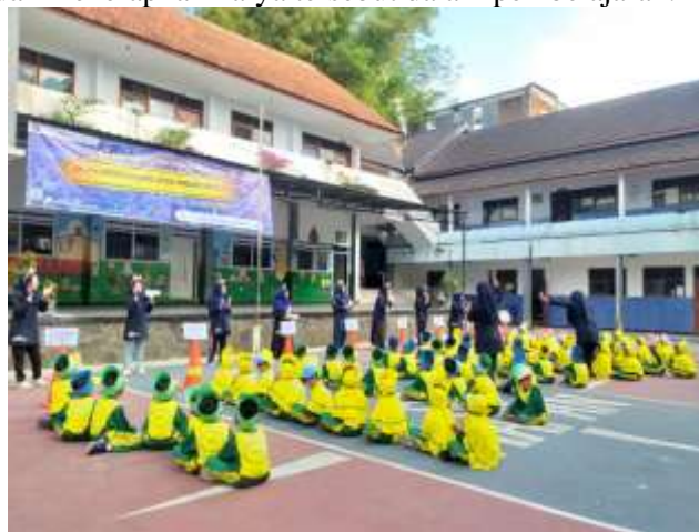
Gambar 1. SD Muhammadiyah 8 Dau, Kab. Malang

Berdasarkan permasalahan di atas, maka pihak SD Muhammadiyah Kab. Malang dan tim pengabdian sangat perlu untuk meningkatkan keterampilan guru-guru dalam penulisan cerita bergambar untuk pengenalan identitas gender pada siswa. Kegiatan yang dapat membantu memecahkan permasalahan para guru yaitu pelaksanaan pengabdian dosen di sekolah. Tim pengabdian akan melaksanakan kegiatan dengan cara melaksanakan pelatihan penulisan cerita bergambar untuk pengenalan identitas gender siswa SD. Selanjutnya tim pengabdian bersama guru menyusun buku cerita bergambar untuk pengenalan identitas gender siswa SD". Melalui kegiatan ini, para guru diharapkan dapat menulis cerita bergambar untuk pengenalan identitas gender siswa SD dan menerapkan karya tersebut dalam pembelajaran.