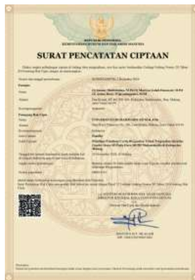
Gambar 8. Sertifikat HKI Pamflet Pelatihan Penulisan Cerita Bergambar untuk Pengenalan Identitas Gender Siswa SD pada Guru SD Muhammadiyah Kab. Malang