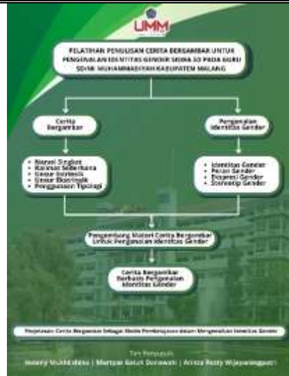
Gambar 7. Pamflet Pelatihan Penulisan Cerita Bergambar untuk Pengenalan Identitas Gender Siswa SD pada Guru SD Muhammadiyah Kab. Malang