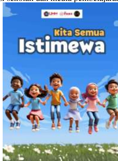
Gambar 6. Cover Buku Cerita Bergambar Berbasis Pengenalan Identitas Gender

Pada tahap hasil pelatihan cerita bergambar berbasis pengenalan identitas gender adalah kegiatan mengilustrasikan dari narasi cerita bergambar yang telah dirancang oleh guru SD/MI Muhammadiyah Kab. Malang. Harapan dari tahapan ini adalah terciptanya buku cerita bergambar berbasis pengenalan identitas gender yang telah di desain sedemikian rupa dapat digunakan oleh guru SD/MI Muhammadiyah Kab. Malang melaksanakan gerakan literasi sekolah dan media pembelajaran di kelas.