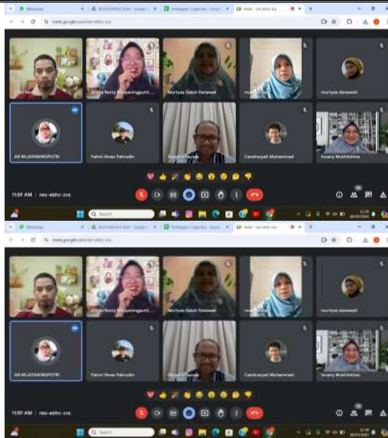
Gambar 2. Tahap persiapan berkomunikasi dengan PCIM Thailand