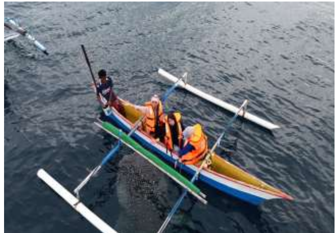
Gambar 2. Dokumentasi Kegiatan PkM

Hasil dari kegiatan ini menunjukkan adanya perubahan positif pada pemahaman masyarakat mengenai konsep ekowisata dan cara mengelola potensi wisata dengan mempertimbangkan aspek keberlanjutan. Sebagai contoh, setelah mengikuti pelatihan praktis, 90% peserta menyatakan bahwa mereka merasa lebih siap untuk menjadi pemandu wisata yang ramah lingkungan. Selain itu, sebanyak 85% dari peserta pelatihan produk lokal juga berhasil memproduksi barang berbasis hasil laut yang dapat dijual kepada wisatawan, seperti kerajinan tangan dari cangkang kerang dan ikan terumbu karang yang telah dikeringkan.