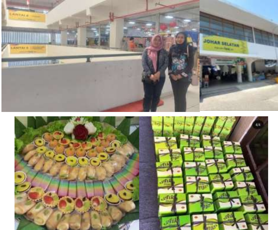
Gambar 1. Mitra, Lokasi Mitra dan Produk Mitra

Setelah dilaksanakan wawancara secara daring melalui obrolan aplikasi whatsapp, ditemukan permasalahan yang dihadapi Mitra terkait dengan perpajakan, yaitu: