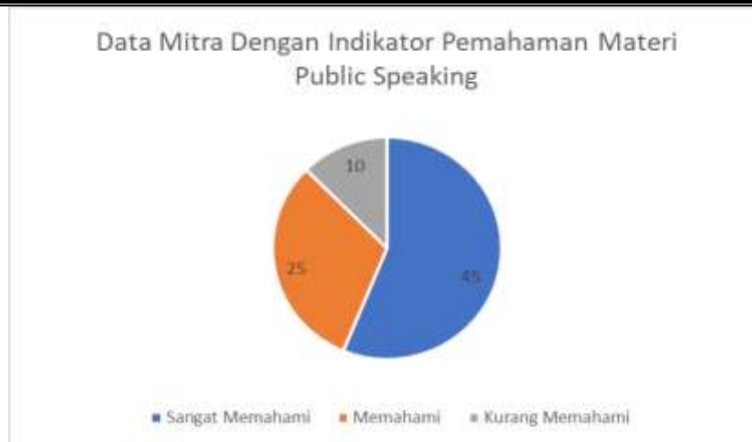
Gambar 5. Grafik Pemahaman Materi Public Speaking

Setelah tahapan penjelasan materi selesai, maka tahap selanjutnya adalah pendampingan pelaksanaan public speaking atau praktik secara langsung. Kegiatan praktik ini dilaksanakan kurang lebih selama 2 jam dimulai dari jam 13.00 – 15.00. Kegiatan praktik ini dimulai dari peserta dibagi menjadi beberapa kelompok berdasarkan keinginan mitra untuk siapa yang ingin menjadi Master of Ceremony (MC), siapa yang ingin menjadi nara sumber company profile dan siapa saja yang ingin menjadi nara sumber Seminar Bisnis (SEBI) dan Seminar Inspirasi Umrah (SIU). Langkah selanjutnya adalah 4 kelompok ini dibagi lagi menjadi beberapa grup. Kelompok MC dibagi menjadi 2 grup, kelompok CP dibagi menjadi 3 grup, kelompok SEBI dibagi menjadi 2 grup, dan kelompok SIU dibagi menjadi 2 grup. Pembagian ke dalam grup ini diharapkan dapat memberikan kesempatan kepada semua peserta untuk bisa tampil presentasi dikarenakan dengan waktu yang terbatas dan jumlah peserta mencapai 80 orang. Hasil pemetaan diperoleh sebagai berikut: