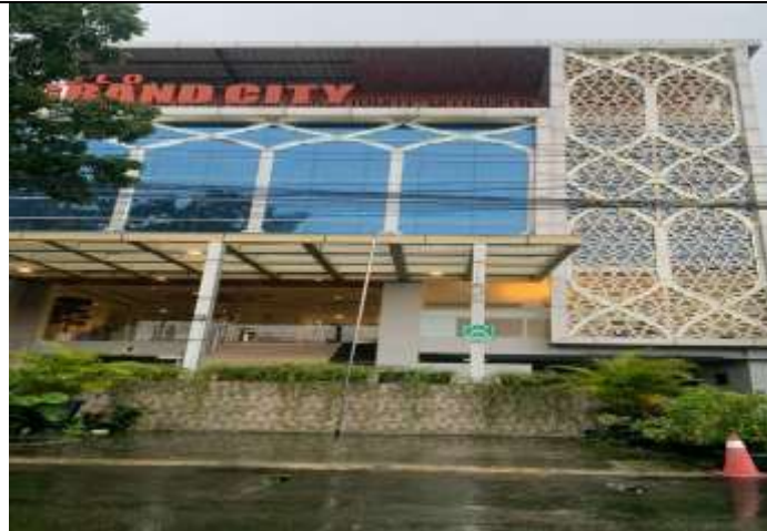
Gambar 3. Solo Grand City Hotel Lokasi Pelatihan Public Speaking

Materi presentasi yang disampaikan terkait dengan kegiatan workshop antara lain terkait dengan membuka mindset mitra Samira Travel, mengapa harus belajar public speaking , bagaimana public speaking yang baik. Presentasi dilakukan dalam waktu 2 jam dengan model ceramah dan 1 jam dilanjutkan dengan diskusi membahas kendala dan permasalahan yang dihadapi mitra Samira Travel. Dari kegiatan diskusi ini, ditemukan permasalahan yang dihadapi mitra yaitu tidak mudah untuk berbicara di depan umum atau menjadi pembicara. Setelah mengetahui beberapa permasalahan yang muncul kemudian dibahas bersama untuk menentukan solusi. Peserta pelatihan sangat antusias dalam mendengarkan penjelasan materi public speaking , seperti terlihat dalam gambar 2.