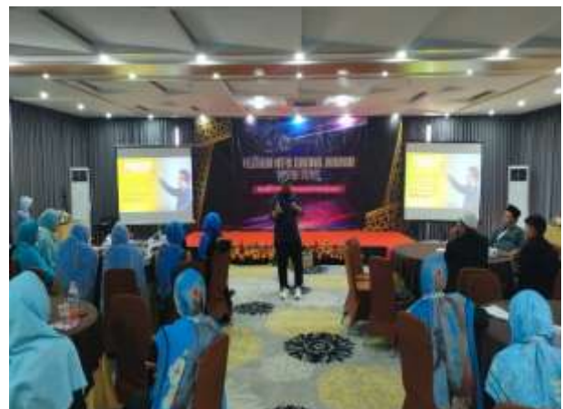
Gambar 4. Peserta Pelatihan Antusias Dalam Mendengarkan Materi Public Speaking

Hasil penjelasan materi melalui presentasi menunjukkan bahwa dari 80 peserta yang hadir dan mengikuti workshop pelatihan public speaking adalah 45 peserta menjawab sangat memahami dengan cara mengacungkan jari, 25 peserta menjawab cukup memahami, dan 10 peserta menjawab kurang memahami. Dari hasil tersebut, berarti dengan metode presentasi yang dilanjutkan dengan diskusi dan tanya jawab semua peserta pelatihan mampu memahami bagaimana cara public speaking yang baik dan benar. Hasil penjelasan materi dapat dilihat dalam bentuk grafik 1.