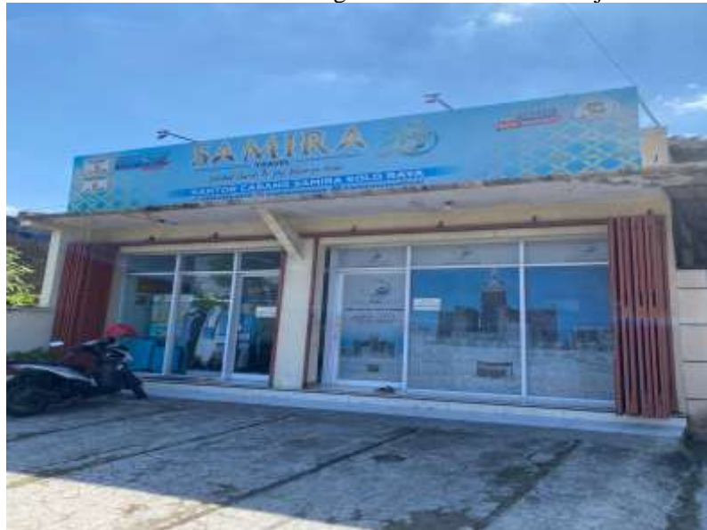
Gambar 1. Kantor Samira Travel Cabang Sukoharjo

Berdasarkan tabel 1 maka diperlukan solusi untuk mengatasi masalah mitra Samira Travel. Solusi yang diberikan adalah pelatihan public speaking. Harapan dari pelatihan ini adalah meningkatnya kepercayaan diri mitra dan pengetahuan product knowledge sehingga mampu menjadi nara sumber yang handal dan kompeten dalam bidangnya. Berikut adalah foto kantor cabang Samira Travel Sukoharjo.