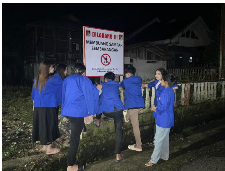
Gambar 2. Pemasangan Spanduk Himbauan Untuk Tidak Membuang Sampah Sembarangan

Program kerja pengabdian kepada masyarakat yang dilaksanakan di Kawasan Wisata Baru Rano Reindang berhasil mencapai tujuan utama, yaitu meningkatkan kesadaran pengunjung mengenai pentingnya menjaga kebersihan lingkungan. Di mana observasi yang dilakukan sebelum dilakukannya sosialisasi dan pengadaan fasilitas, menunjukkan bahwa masih minimnya kesadaran pengunjung mengenai kebersihan lingkungan di lokasi wisata Rano reindang. Namun observasi di lakukan setelah di lakukannya sosialisasi serta pengadaan fasilitas berupa papan informasi, menunjukkan adanya perubahan signifikan dimana pengunjung menjadi lebih sadar akan tidak membuang sampah sembarangan. Hal ini menunjukkan bahwa melalui berbagai kegiatan edukasi dan sosialisasi, pengunjung menunjukkan perubahan positif dalam perilaku mereka. Sebelum program dilaksanakan, banyak pengunjung yang kurang memperhatikan kebersihan, namun setelah mengikuti program, terdapat peningkatan signifikan dalam kesadaran mereka untuk tidak membuang sampah sembarangan