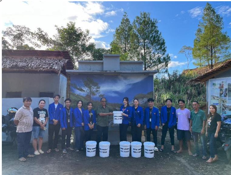
Gambar 1. Penyerahan Tempat sampah Kepada Pemerintah Desa Leilem Di Kawasan Wisata Rano Reindang

untuk mendorong partisipasi aktif dari pengunjung dan masyarakat setempat dalam menjaga lingkungan dan Kawasan Wisata yang ada.