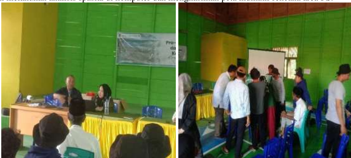
Gambar 2. Suasana Penyuluhan dan Pemetaan Lokasi Usulan PS

Proses selanjutnya adalah menggambarkan lokasi rencana kelola dalam skema HKm. Proses ini