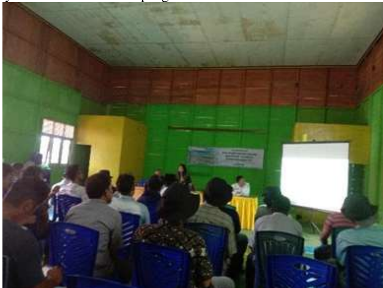
Gambar 3. Penyampaian Pilihan Skema PS

Setelah proses pembentukan kelompok dan pengusulan registrasi ke Dinas Kehutanan, proses selanjutnya adalah penyusunan administrasi kelengkapan pengusulan HKM oleh kelompok masyarakat dengan kelengkapan administrasi yang diserahkan ke KPHP. Kegiatan ini mengacu pada aturan yang ada (KLHK, 2021). Tahapan kegiatan ini dilakukan secara partisipatif dengan melibatkan kelompok masyarakat pengelola yang selanjutnya menyusun rencana-rencana pengelolaan kawasan.