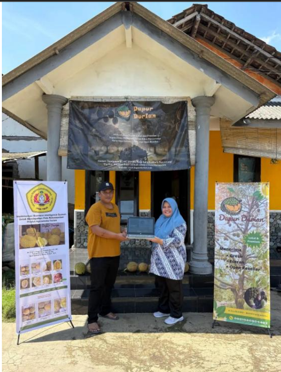
Gambar 1. Foto bersama dengan Perwakilan Mitra

Meskipun demikian, berdasarkan hasil observasi lapangan, terdapat sejumlah permasalahan yang masih dihadapi pengelola. Pertama, pengelolaan masih dilakukan secara konvensional tanpa dukungan teknologi pendataan yang memadai. Informasi terkait jumlah pengunjung, tren penjualan, dan jenis durian yang paling diminati belum terdokumentasi dengan baik, sehingga pengambilan keputusan cenderung bergantung pada pengalaman subjektif. Kedua, strategi pemasaran belum optimal karena masih terbatas pada promosi tradisional seperti pemasangan spanduk dan penyebaran informasi dari mulut ke mulut. Minimnya pemanfaatan media digital mengakibatkan jangkauan promosi yang seharusnya dapat lebih luas tidak terealisasi.