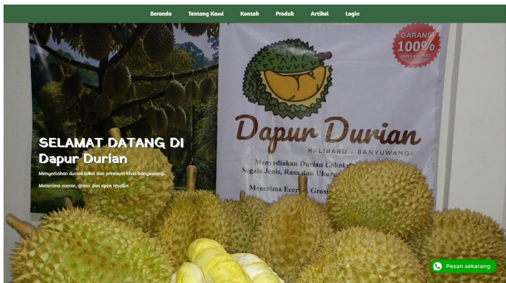
Gambar 2. Halaman Aplikasi Web berbasis Business Intelligence

Ilustrasi pada Gambar 2 memperlihatkan halaman utama aplikasi web yang menampilkan daftar produk durian. Setiap buah digambarkan dengan foto asli yang diunggah dari mitra, sehingga calon pembeli dapat membandingkan pilihan secara visual. Pada bagian lain dari aplikasi (Gambar 3), sistem menampilkan hasil rekomendasi produk. Misalnya, setelah pengunjung memilih satu jenis durian, sistem akan menampilkan saran produk lain yang paling sering dipilih bersamaan atau yang sesuai dengan selera pengunjung.