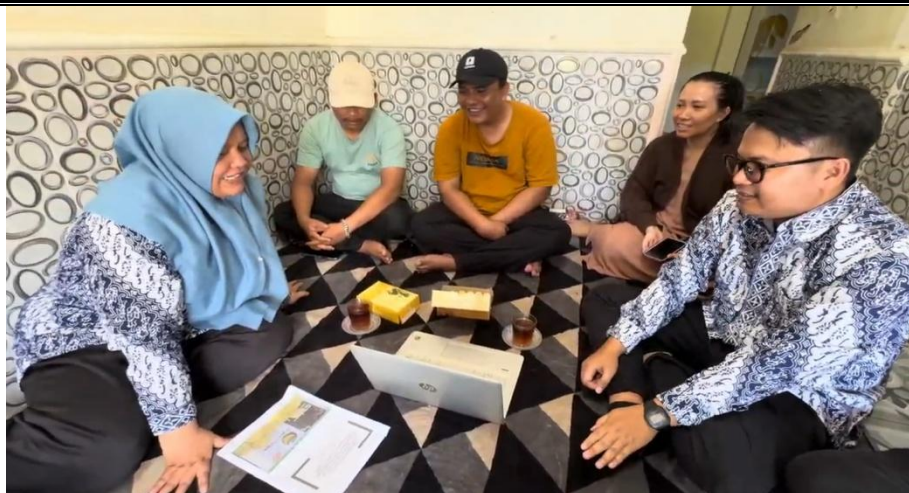
Gambar 4. Pendampingan Mitra oleh Tim Pengabdian

Secara keseluruhan, hasil implementasi aplikasi web berbasis Business Intelligence ini menunjukkan bahwa pengelolaan dan pemasaran agrowisata dapat ditingkatkan secara signifikan dengan dukungan teknologi digital. Aplikasi tidak hanya berfungsi sebagai media informasi, melainkan juga sebagai sarana analisis data dan rekomendasi produk yang relevan dengan kebutuhan pengunjung. Dampak yang dihasilkan tidak terbatas pada peningkatan efisiensi internal, tetapi juga pada penguatan daya saing destinasi serta pertumbuhan ekonomi lokal yang lebih berkelanjutan.