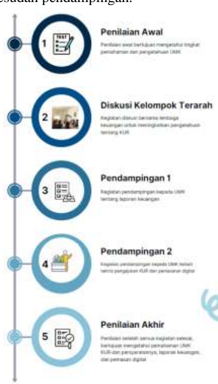
Gambar 2. Tahapan Pelaksanaan Program

Metode pelaksanaan kegiatan pengabdian ini dilakukan melalui pendekatan partisipatif dengan melibatkan langsung pelaku UMK. Dalam hal ini, sebanyak 75 UMK di Kota Cibinong dilibatkan sebagai sasaran atas kegiatan yang akan dibagi ke dalam tiga tahap, yaitu: (1) identifikasi masalah dan kebutuhan UMK; (2) pelaksanaan diskusi kelompok terarah dan pendampingan yang berisi pelatihan literasi KUR, penyusunan laporan keuangan, serta pemanfaatan teknologi pemasaran; dan (3) evaluasi hasil melalui perbandingan kondisi sebelum dan sesudah pendampingan.