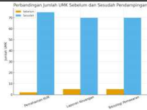
Gambar 3. Peningkatan Jumlah UMK Hasil Pendampingan dan Diskusi Kelompok Terarah

Hasil analisis tersebut secara tidak langsung menunjukkan bagaimana krusialnya peran pembinaan dalam meningkatkan kapasitas pengetahuan masyarakat terkait operasional bisnis dan keuangan yang dapat memperbesar potensi keterlibatan para pelaku UMK dalam program pembiayaan KUR masyarakat di Cibinong, Jawa barat. Penemuan tersebut sejalan dengan beberapa penelitian lapangan di daerah lain seperti Bali, Karawang, dan Wonogiri (Johadi et al. 2023) juga menunjukkan penemuan yang sama bahwa pendampingan langsung dalam proses pengajuan kredit, pengembangan platform digital bersama, dan aksi dukungan sosial dari komunitas menjadi kunci utama yang dapat membantu para UMK menjadi lebih maju dan dapat melewati hambatan pembiayaan yang bersumber dari kurangnya literasi masyarakat.