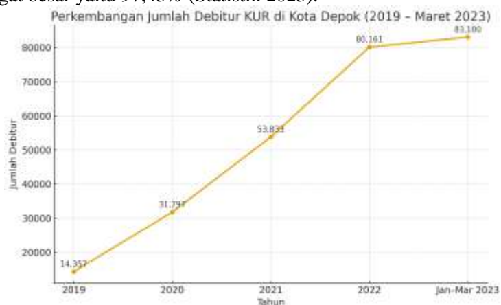
Gambar 1. Perkembangan Jumlah Debitur KUR di Cibinong, Jawa Barat

Di Indonesia sendiri, berdasarkan laporan yang diperoleh dari Kementerian Koperasi dan UKM pada tahun 2024, 99.71% atau sekitar kurang lebih 30.09 juta unit usaha merupakan usaha mikro yang dalam hal ini seringkali menghadapi tantangan dalam mendapatkan akses pembiayaan lembaga keuangan formal. Selain itu, unit usaha kecil dalam hal ini menduduki jumlah usaha kedua terbanyak setelah usaha mikro, yaitu sebesar 73.816. Cibinong dalam hal ini menjadi salah satu kota dengan dominasi unit Usaha Mikro dan Kecil (UMK) yang sangat besar yaitu 97,43% (Statistik 2023).