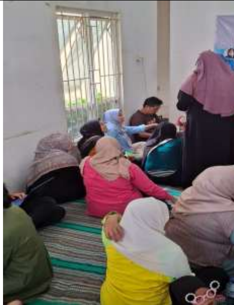
Gambar 2. Lokasi Pendampingan UMK