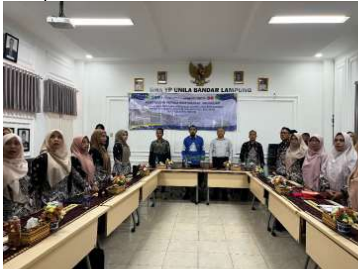
Gambar 1. Gambaran Peserta dan Proses Pelatihan

belum memahami model Pembuatan Bahan Ajar sehingga mereka kurang percaya diri dalam menerapkan metode tersebut. Akibatnya mereka tetap menggunakan model/pendekatan pembelajaran Bahasa Inggris Lisan. Peroses pembelajaran Task-Based Language Teaching (TBLT) bisa digunakan juga untuk guru pelajaran lain dengan mengutamakan penguasaan aspek bahasa ( forms ) sehingga terbukti kurang efektif dalam pembelajaran Bahasa Inggris karena tidak dapat memfasilitasi siswa.