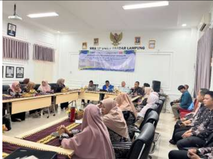
Gambar 3. Suasana saat pelatihan tim pengabdian memberikan materi

Para guru Di awal dan akhir pelatihan diberikan angket untuk melihat pemahaman mereka terhadap konsep Pembuatan bahan ajar bahasa Inggris lisan berdasarkan prinsip task-based language teaching (TBLT). Pada tahap selanjutnya, para partisipan dimohon untuk membuat ataupun meningkatkan bahan ajar bahasa Inggris lisan berdasarkan prinsip task-based language teaching (TBLT) cocok dengan modul yang sudah diinformasikan oleh para narasumber kemudian mendapatkan penilaian yang sangat baik ketika dilakukan pengecekan. Aspek-aspek Pembuatan bahan ajar bahasa Inggris lisan berdasarkan prinsip task-based language teaching (TBLT) yang dinilai dari materi ajar yang dikembangkan oleh para peserta pelatihan adalah task yang terdiri dari beberapa stages dan aspek: 1) pre-task ; 2) during task ; 3) post task ; dan 4) faktor kognitif ( resource-directing dan resource dispersing ).