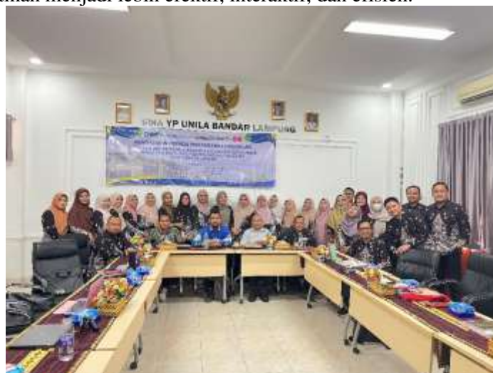
Gambar 2. Suasana awal pelatihan

Pengabdian kepada masyarakat yang dilaksanakan di Kota Bandar Lampung dengan lokasi bertempat di SMA YP Unila yang diikuti oleh 26 peserta dengan durasi waktu pelatihan selama 32 jam. Selama proses pelatihan berlangsung, para peserta tampak antusias menyimak materi yang disampaikan oleh para narasumber yang dilakukan secara daring yang dengan penuh kesabaran memberikan materi kepada peserta dengan diselingi humor membuat kelas terasa semakin nyaman untuk belajar. Tanya jawab dan diskusi terjadi manakala ada bagian yang dirasa tidak jelas dan kurang dipahami oleh para peserta. Para peserta diberi kebebasan untuk menyela untuk meminta penjelasan kepada narasumber tentang materi salah satunya adalah berkaitan dengan Menjadi guru harus memahami karakter siswa dan jadilah guru yang baik. Hal tersebut bertujuan untuk proses pelatihan menjadi lebih efektif, interaktif, dan efisien.