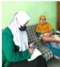
Gambar 1. Observasi awal dengan Ibu RW