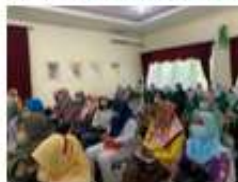
Gambar 3. Pertemuan dengan warga