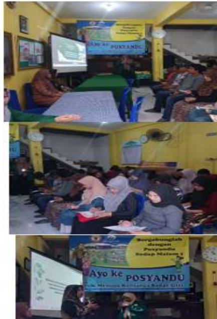
Gambar 4. Kegiatan Pengabdian Masyarakat