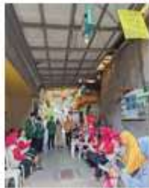
Gambar 2. Pertemuan dengan kader