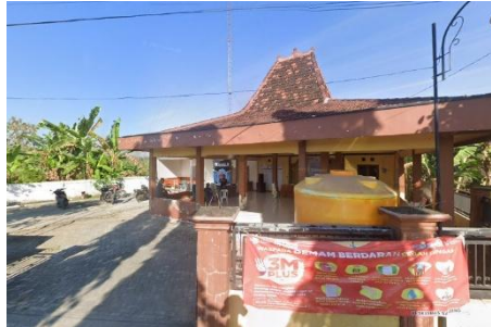
Gambar 1. Lokasi Pelatihan (Balai Desa Wonorejo)

Permasalahan juga tampak pada aspek inovasi produk. Jagung dan pisang memang sudah lama dikenal sebagai bahan pangan utama, tetapi produk turunannya yang inovatif masih jarang dikembangkan di Wonorejo. Padahal, menurut Nirmalasari et al. , (2023), pemanfaatan bahan lokal maupun limbah hasil pertanian menjadi produk inovatif dapat meningkatkan nilai ekonomi sekaligus membuka lapangan kerja baru. Kurangnya eksplorasi inovasi produk menyebabkan peluang besar bagi pengembangan ekonomi lokal belum tergarap secara maksimal.