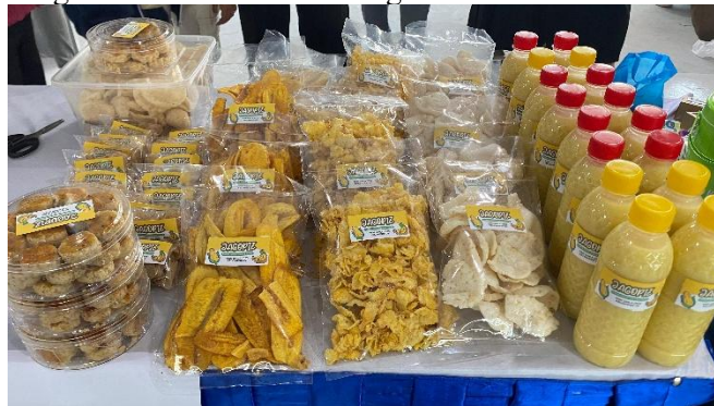
Gambar 4. Produk yang Dihasilkan

Pelaksanaan kegiatan pelatihan diversifikasi olahan jagung dan pisang di Desa Wonorejo Kecamatan Sambeng Kabupaten Lamongan berlangsung selama tiga hari, tepatnya pada tanggal 26–28 Agustus 2024. Kegiatan ini bertujuan meningkatkan keterampilan masyarakat dalam mengolah hasil pertanian lokal menjadi produk bernilai tambah, sekaligus menumbuhkan semangat kewirausahaan.