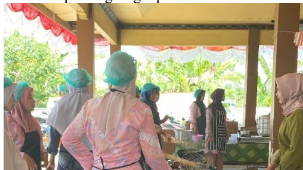
Gambar 2. Kegiatan Pelatihan

Kegiatan pengabdian kepada masyarakat ini dilaksanakan pada tanggal 26–28 Agustus 2025 bertempat di Balai Desa Wonorejo, Kecamatan Sambeng, Kabupaten Lamongan, dengan melibatkan 30 orang peserta yang berasal dari Desa Wonorejo dan desa sekitarnya (Sekidang, Kedungbanjar, Wudi, Pataan, Ardirejo, dan Nogojatisari). Peserta didominasi oleh ibu-ibu PKK, pemuda desa, serta pelaku usaha kecil yang memiliki ketertarikan dalam mengembangkan produk pangan lokal. Pemilihan sasaran ini didasarkan pada pertimbangan bahwa kelompok tersebut merupakan motor penggerak utama dalam rumah tangga dan masyarakat, sehingga hasil pelatihan dapat langsung dipraktikkan dan memberikan dampak ekonomi nyata.