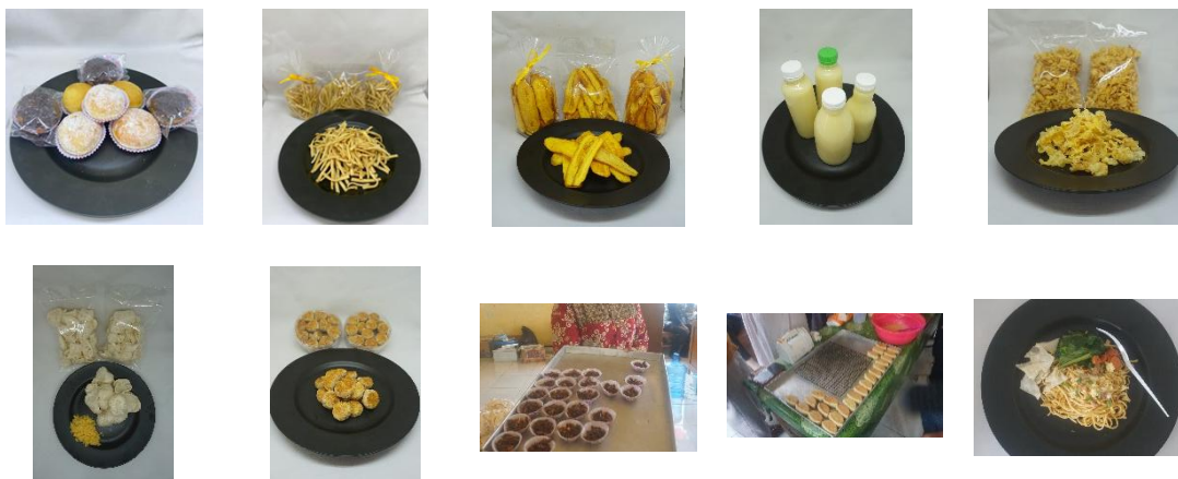
Gambar 3. Produk yang Dihasilkan

Pelaksanaan pelatihan dibagi ke dalam tiga hari dengan variasi materi yang berbeda. Pada hari pertama, peserta dilatih membuat produk kering berbasis pisang dan jagung yaitu kripik pisang, kerupuk jagung, stik jagung, dan cookies jagung. Hari pertama ini difokuskan pada produk ringan dengan daya simpan relatif lama sehingga dapat dijadikan peluang usaha dalam skala rumahan. Pada hari kedua, pelatihan diarahkan pada produk setengah basah dan minuman, meliputi donat pisang, bolu pisang, molen pisang, serta minuman sari jagung. Produk ini dipilih karena relatif disukai masyarakat luas dan memiliki potensi pasar di tingkat lokal. Sedangkan pada hari ketiga, peserta diperkenalkan pada produk berbasis tepung dan olahan basah yaitu brownies kukus jagung dan mie jagung. Produk hari ketiga ini dirancang untuk membuka wawasan peserta bahwa jagung tidak hanya terbatas sebagai bahan pangan pokok, tetapi juga dapat dikembangkan menjadi produk modern yang memiliki nilai jual tinggi.