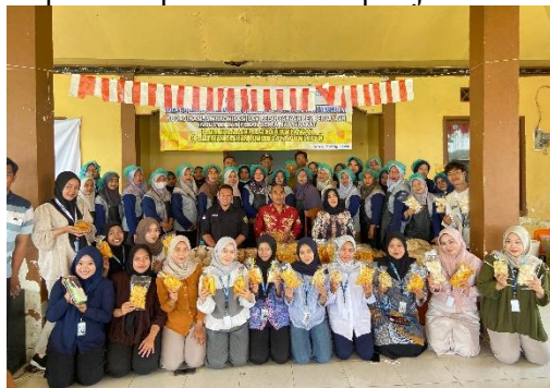
Gambar 5. Peserta Pelatihan

Pelatihan diikuti oleh 30 peserta yang terdiri dari ibu-ibu PKK, pemuda desa, dan pelaku UMKM. Antusiasme peserta terlihat sejak hari pertama, ketika mereka mempraktikkan pembuatan kripik pisang, kerupuk jagung, stik jagung, dan cookies jagung. Hasil olahan cukup memuaskan dengan tekstur dan rasa yang sesuai standar. Pada hari kedua, peserta dilatih mengolah produk yang lebih kompleks, seperti donat pisang, bolu pisang, molen pisang, serta minuman sari jagung. Pelatihan ini mengasah keterampilan baking dan minuman sehat berbahan dasar lokal. Keberhasilan peserta membuat produk olahan ini menjadi indikator bahwa masyarakat memiliki kemampuan adaptif dalam mempelajari teknik baru.