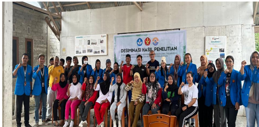
Gambar 3. Peserta Focus Group Discussion

Peningkatan kapasitas ini sejalan dengan pandangan (Muslih et al., 2020); (Sulaeman et al., 2023) yang menegaskan bahwa pendekatan Participatory Rural Appraisal (PRA) mampu memperkuat rasa memiliki masyarakat terhadap program, sehingga hasilnya lebih berkelanjutan. Selain itu, metode FGD yang diterapkan juga memberikan ruang bagi petani untuk mengungkapkan pengalaman, kendala, dan solusi lokal yang mereka miliki (Gambar 3). Dengan demikian, proses pembelajaran berjalan dua arah dan menghasilkan inovasi berbasis kearifan lokal.