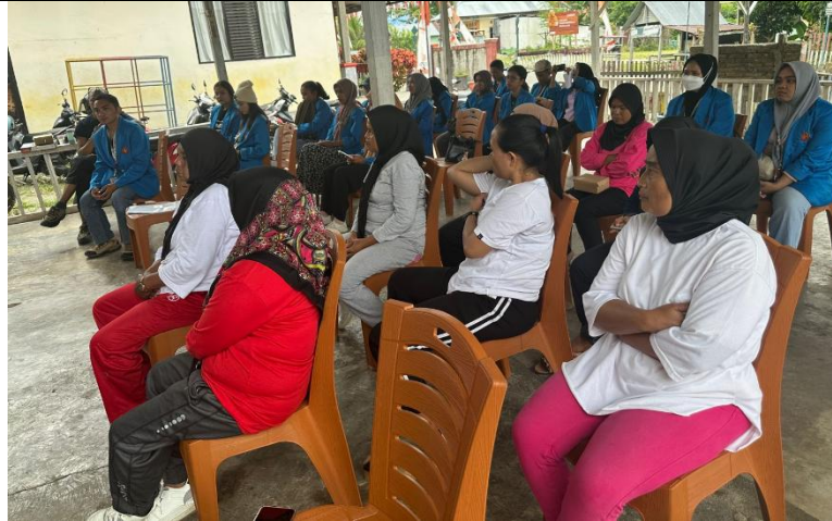
Gambar 2. Sosialisasi Program

Hasil evaluasi menunjukkan adanya peningkatan kapasitas pengetahuan dan keterampilan teknis peserta. Hal ini terlihat dari indikator kemampuan mereka dalam memahami materi, berdiskusi, serta mempraktikkan langsung teknik-teknik konservasi yang diperkenalkan. Secara khusus, tiga keterampilan utama yang diperoleh adalah: (1) teknik pembuatan kompos baik fermentasi maupun konvensional, (2) teknik konservasi tanah dan air melalui pembuatan teras kontur, saluran pengendali air, dan sumur resapan, (3) teknik penanaman pola agroforestri sebagai strategi diversifikasi produksi pertanian.