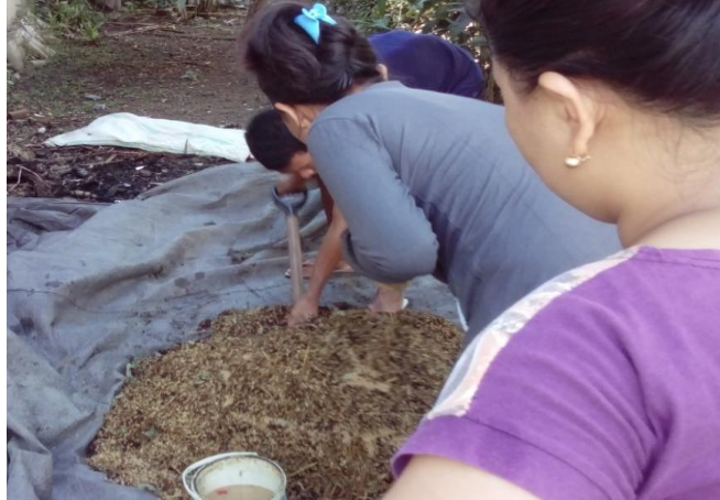
Gambar 4. Pengolahan Limbah Organik Pertanian Menjadi Pupuk Kompos

Kompos fermentasi berhasil dipanen dalam waktu 7–10 hari, sedangkan kompos konvensional baru dapat digunakan setelah \pm 2 bulan. Perbedaan waktu ini memberikan pembelajaran penting kepada petani mengenai pilihan teknologi yang sesuai dengan kebutuhan lahan mereka. Kompos fermentasi dapat dimanfaatkan lebih cepat, sementara kompos konvensional lebih berperan dalam penyediaan bahan organik jangka panjang.